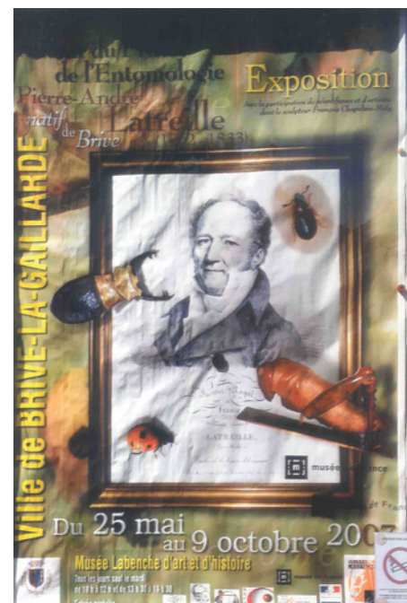
1. Aankondiging van de tentoonstelling over Latreille in een etalage in Brive-la-Gaillarde.

Tijdens zijn verblijf in de gevangenis ziet hij op zekere dag een kevertje op de muur van zijn cel zitten. Hij kent de naam van de kever niet en een arts die op dat moment de ronde doet zegt dat hij wel iemand weet die het insect op naam kan brengen. Dat is de jeugdige Bory de Saint-Vincent, die later bekend zal worden als geograaf en natuuronderzoeker. Latreille stuurt hem het kevertje keurig