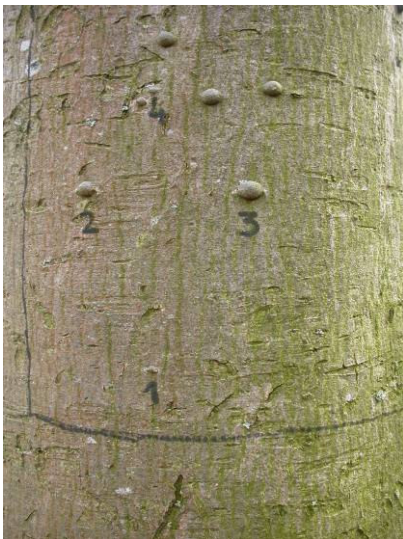
Foto 2. Bastknobbels op Fraxinus in Alphen a/d Rijn