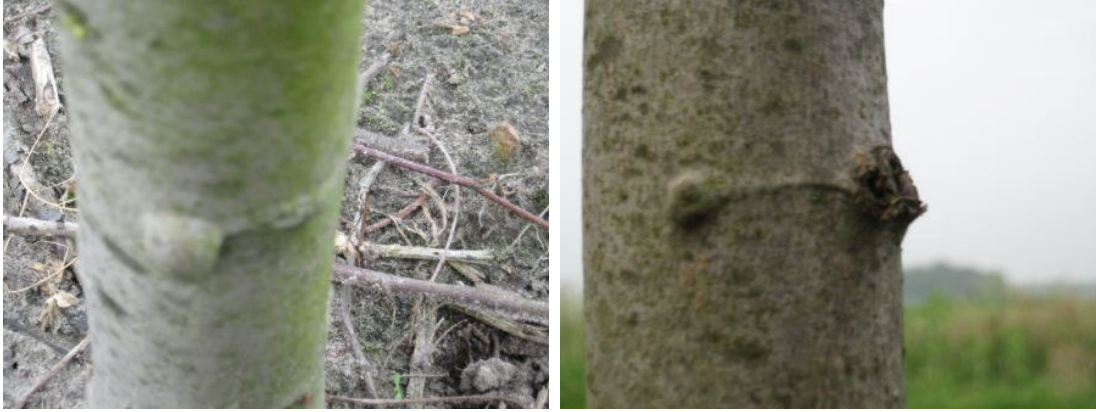
Foto 1. Bastknobbels op bomen in de kwekerij