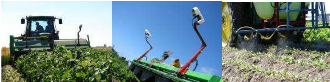
Figuur 1. Foto's van sensorgestuurde loofklap-spuit-machine.

De plaatsspecifieke NDVI-waarden werden vervolgens gebruikt om dosering van de spuitdoppen plaatsspecifiek aan te sturen en daarmee dus op de klap-spuitbaan het loofdodingsmiddel plaatsspecifiek te doseren. De rekenregel hiervoor die NDVI doorvertaalt in een minimum effectieve dosering van Finale was afgeleid uit proefgegevens van Plant Research International. Rekenregel 'basisschema Finale pootgoed+10%, afgestemd op rijenbespuiting 70% van het oppervlak van een geklapte rij' werd geprogrammeerd en getest op het prototype. Deze rekenregel geeft afhankelijk van de NDVI waarde een dosering van 1 tot 1,6 L Finale per ha. Voorbeelden van NDVI-kaarten met pleksgewijze verschillen in gewasreflectie staan verderop weergegeven in Figuur 2 en in een aparte bijlage.