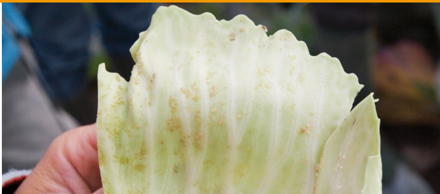
Trips op kool

symptomen van trips echter op en in de kool te zien. De planten reageren op de vraat van trips door 'schuurpapier' en wrat-achtige bobbeltjes te vormen, iets wat de consument niet wil. De enige remedie is de aangetaste bladeren eraf te halen. Dat kost veel arbeid, maar ook kilo's opbrengst. De symptomen van trips zijn vooral in september en oktober te zien. Ook tijdens de bewaring blijven de trips actief, waardoor de aantasting zich kan voortzetten.