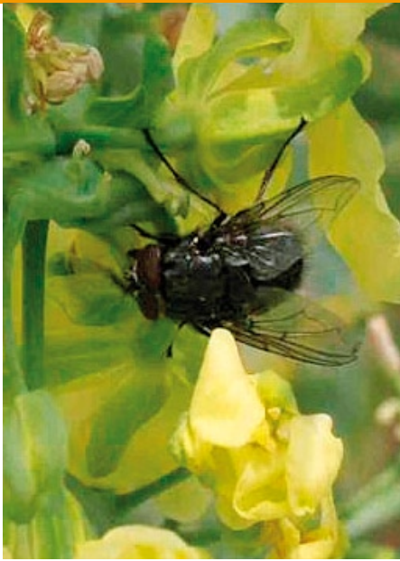
Vlieg op bloem