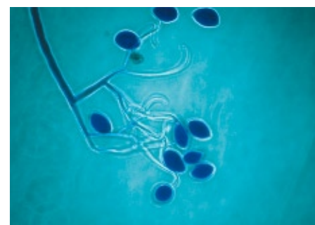
Valse meeldauw onder de microscoop

Voor zaadbedrijven zijn de resultaten nog niet voldoende om er mee verder te gaan, omdat de behandeling van het zaad veel minder effectief is dan behandeling van de kiemplant. Daar komt bij dat geen van de middelen een toegestaan gewasbescher-