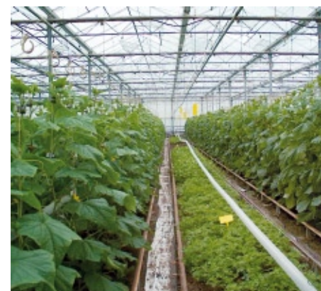
Combinatieteelt komkommer en tagetes

Een echte wisselteelt bestaat er niet- of nauwelijks binnen de intensieve biologische teelt van groenten onder glas. Afwisselin-