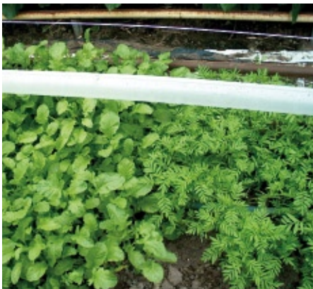
Tussenteelt met mosterd en tagetes

vrijlevende J2 aaltjes komen uit de wortel om weer opnieuw een plant binnen te dringen. Dit stadium is beperkt (ongeveer een week) actief. De eiproppen, in met name wortelresten, blijven langer vitaal. De latente aanwezigheid kan oplopen, afhankelijk van de bodemtemperatuur, tot jaren. Door de schade aan de wortels wordt er minder efficiënt water en voedingsstoffen naar de bovengrondse delen van de plant getransporteerd. Dit veroorzaakt vergeling en slaphangen van de plant.