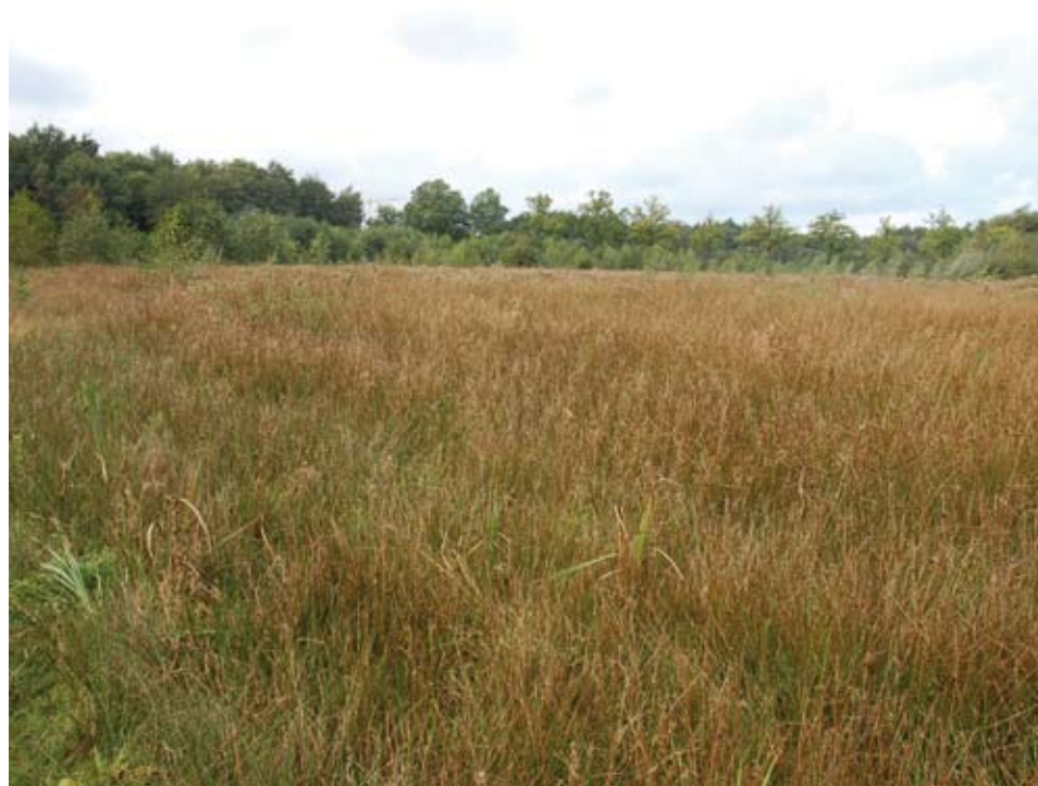
Figuur 2 Onzorgvuldige inrichtingsmaatregelen bieden weinig resultaat

We stellen voor dat de aanvraagperiode vaker opengesteld wordt, bijvoorbeeld maandelijks,