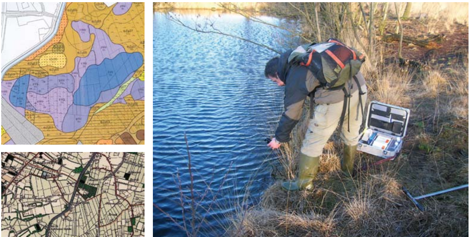
Figuur 1 praktisch veldonderzoek gericht op onderbouwing van landschapsecologische analyse

Oorzaak 4: beperkte toepassing kennis abiotiek en landschapsecologie Om de (on)mogelijkheden voor de realisatie van natuurdoelen in te kunnen schatten is ecologische systeemkennis nodig (zie figuur 1). Elk natuurdoel stelt specifieke eisen aan de standplaats en het beheer. Dit komt te beperkt in de planvorming tot uiting. Wij merken dat de kloof tussen wetenschappelijke kennis en de uitvoering veel te groot is. In de huidige inrichtingsplannen wordt veel aandacht besteed aan inpasbaarheid van het plan in de regeling, de fysieke uitvoering en het beheer. Beschikbare