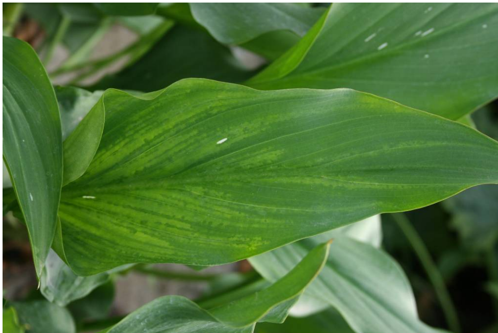
Figuur 2. Virussympptomen in Zantedeschia