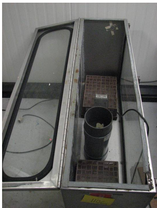
Figuur 4. Container met een inhoud van 250 liter met daarin een ventilator voor luchtcirculatie.

Om vermenging van de middelen tegen te gaan werd voor het verdampen van de GNO's gebruik gemaakt van afsluitbare containers (figuur 4) met een inhoud van 250 liter.