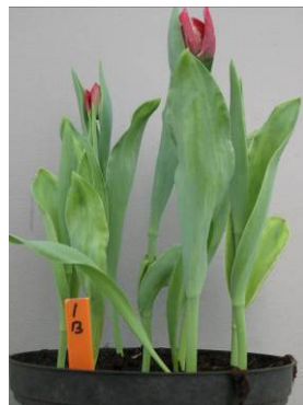
Figuur 2 en 3. Bloem- en bladafwijkingen in de kas, veroorzaakt door galmijten tijdens de bewaring van de bollen

De biologische telers hebben dit al aan den lijve ondervonden met de teelt en broeierij van tulpen, deze activiteiten waren uitzichtloos wanneer er geen bestrijding van galmijt plaats kon vinden. Galmijtschade kan in alle tulpencultivars voorkomen al is er duidelijk een soortgevoeligheid. Voor bollenmijt geldt hetzelfde, al speelt de plaag zich hoofdzakelijk alleen af in de cultivars uit de Oriëntal- en Longiflorumgroepen. Om het probleem van de verminderde werking van Actellic op te lossen werd onderzoek uitgevoerd naar alternatieven voor bestrijding van gal- en bollenmijt.