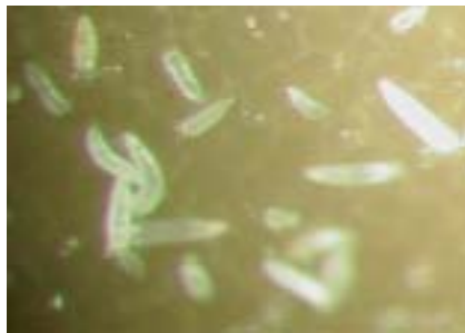
Tulpengalmijten 0,2 mm groot

Er is ook een middel, een etherische olie, gevonden dat kan worden verdampt en als ruimtebehandelingsmiddel kan worden toegepast. In een gezamenlijk onderzoek van PRI Wageningen en PPO Bloembollen werden vele etheri-