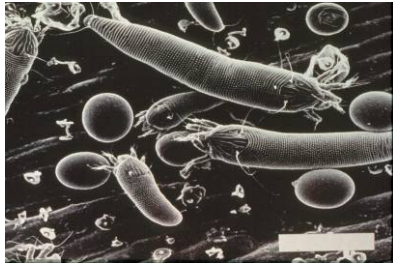
Figuur 1. Galmijten, grootte 0.2 mm.

Het middel Actellic (werkzame stof pirimifos – methyl) wordt in bloembollen gebruikt om grote veel voorkomende plagen zoals bollenmijt ( Rhizoglyphus soorten) en tulpengalmijt ( Eriophyes tulipae ) te bestrijden tijdens de opslag.