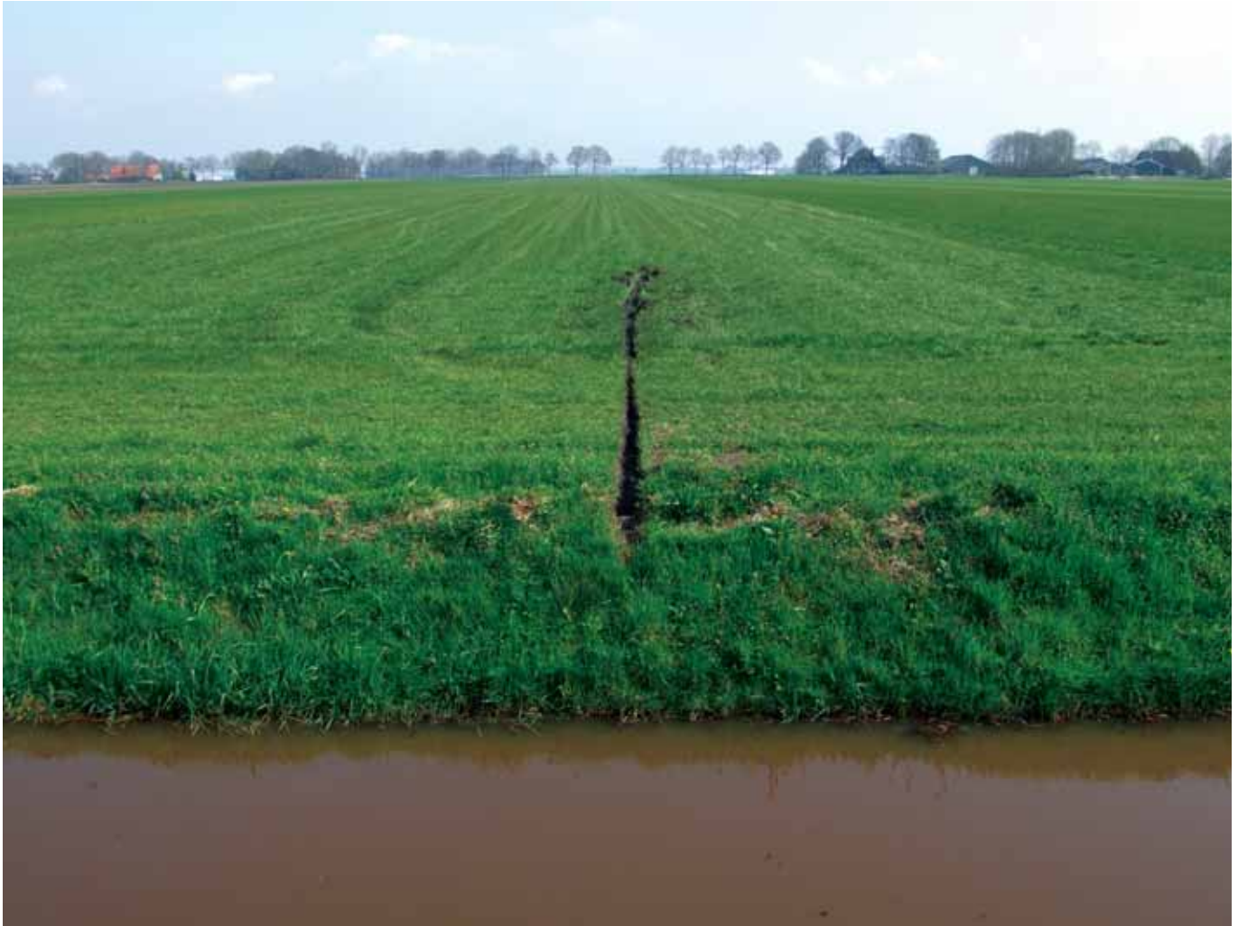
Greppel in een graslandperceel om wateroverlastproblemen te reduceren (april 2007).

problematisch ervaren. Daarnaast wordt bij landbouwschade bij grondwaterwinningen vaak gebruik gemaakt van een correctie op de verdroging in de vorm van een achtergrondverdroging (meestal wordt 10 tot 30 cm aangehouden). Het is echter de vraag of de achtergrondverdroging met het oog op numerieke verdroging in het verleden goed is ingeschat. Aangezien de voedingsweerstand en daarmee de grondwateraanvulling wordt beïnvloed door anisotropie hoog in het bodemprofiel kan ook het areaal waarover de grondwateronttrekking invloed heeft, veranderen. Een geringere grondwateraanvulling heeft immers bij een gelijkblijvende onttrekking tot gevolg dat het onttrokken water uit een groter gebied afkomstig moet zijn, hetgeen overeenkomt met de grotere ruimtelijke interactie via het watervoerende pakket.