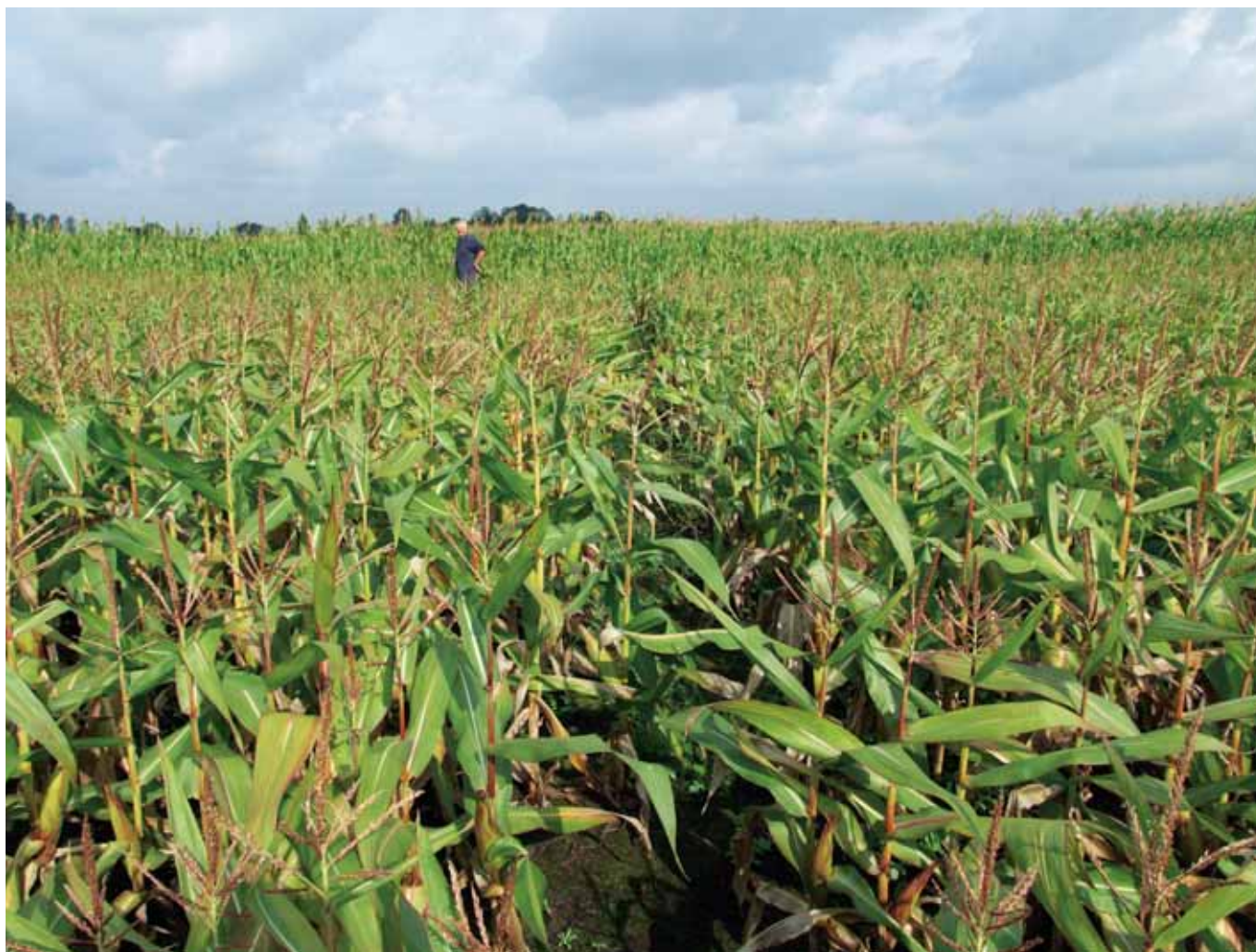
Mais met schade als gevolg van wateroverlast op een gedraineerd perceel op een drainageproefveld te Scheerwolde (augustus 2007).

als gevolg van deze veelal niet verdisconterende weerstand in werkelijkheid groter is, hetgeen ook effect heeft op de grondwateraanvulling.