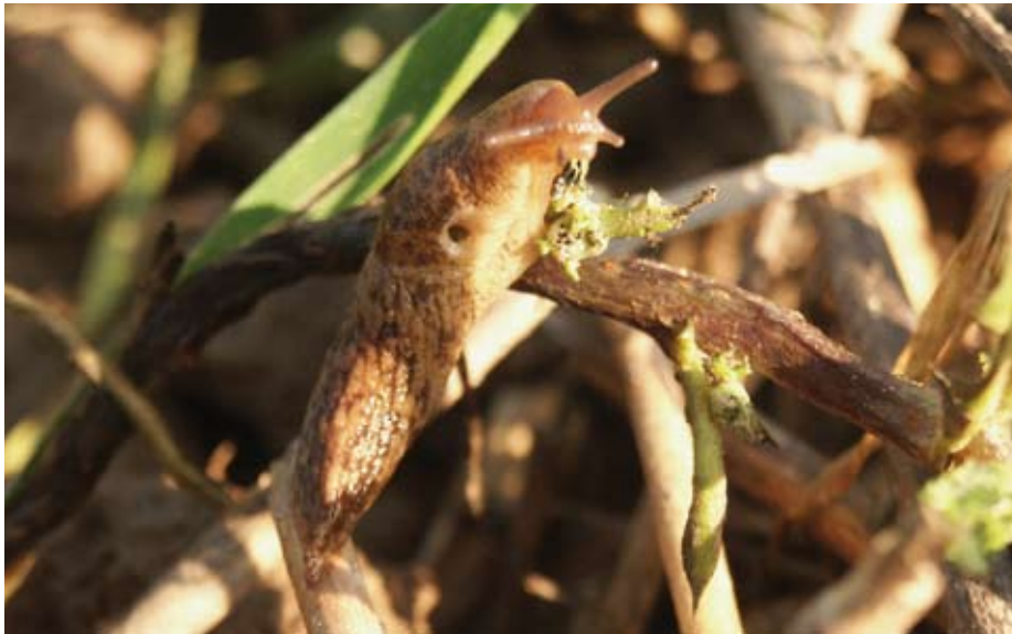
De gevlekte akkerslak is de belangrijkste veroorzaker van schade

Veel biologische telers proberen grondbewerking tegenwoordig tot een minimum te beperken. Dit is goed voor de bodemstructuur en het bodemleven. Maar minimale grondbewerking lijkt schade door slakken juist te bevorderen. Ook de brede inzet van groenbemesters kan de slakkenpopulatie bevorderen. Dit kan leiden tot aanzienlijke schade als gevolg van verontreiniging en vraat. In dit biokennisbericht een aantal handreikingen om opbrengstderving door slakken te beperken.