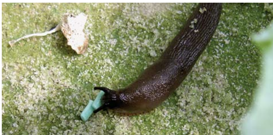
Gewone weglak bij Ferramolkorrels

Naast teelttechnische en preventieve maatregelen kunt u slakken bestrijden met ijzerfosfaatkorrels, in de handel verkrijgbaar onder de naam Ferramol. Ijzerfosfaat komt van nature in de bodem voor en is toege-