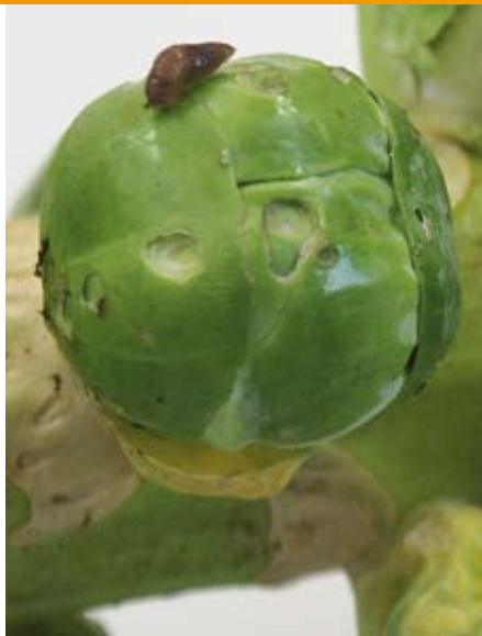
Schade bij spruitkool

Bij koolgewassen treedt schade vooral op in de oogstperiode. Bij sluitkool is de schade te beperken door verwijdering van het voor consumptie onbelangrijke omblad. Bij spruitkool zijn de gevolgen ernstiger, omdat de beschadiging dan plaats vindt