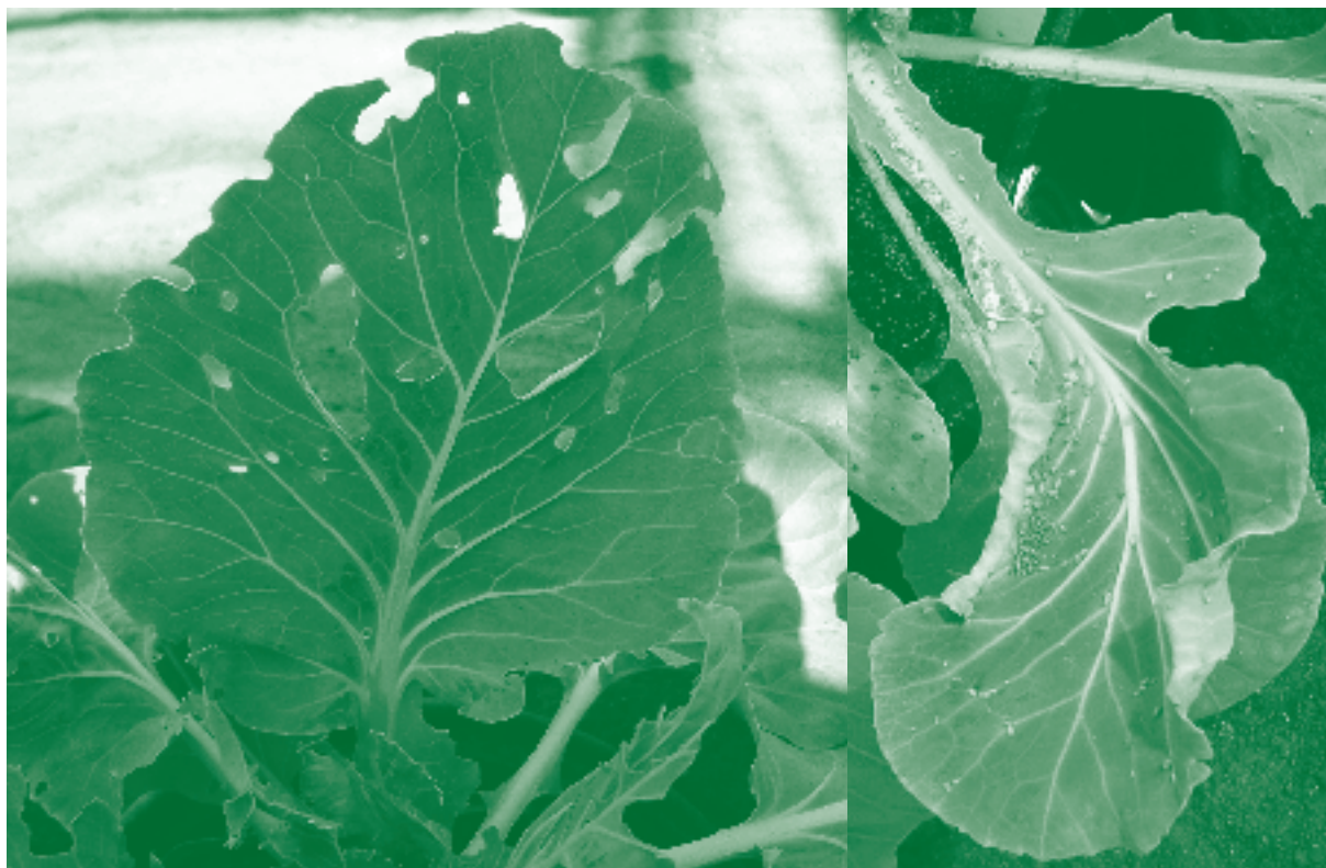
Figuur 2. Schade door rupsen (links) en luizen (rechts) op kool.

verschillen in groei en ontwikkeling van de insecten. Door een van deze genen uit te schakelen in een plant is het mogelijk om de functie van dit gen te onderzoeken. Helaas is het nog niet mogelijk om dit te doen in Brassica -planten. Om toch een idee te krijgen over de functie van bepaalde genen zijn knock-out mutanten, planten waarin één bepaald gen is uitgeschakeld, van de zandraket gebruikt. Onderzoek naar de groei en ontwikkeling van de insecten op deze knock-out planten liet zien dat een 'trypsine- en protease-inhibitor'-gen een negatief effect had op zowel rupsen als bladluizen.