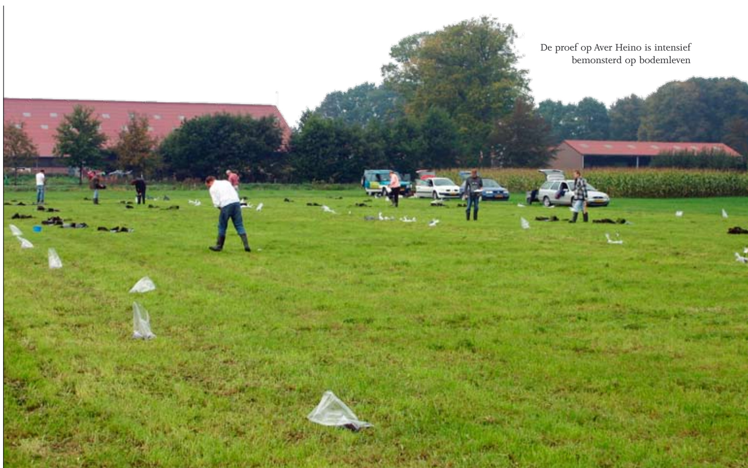
De proef op Aver Heino is intensief bemonsterd op bodemleven

Is de afvoer van mest van invloed op de bodemkwaliteit van een melkveebedrijf?