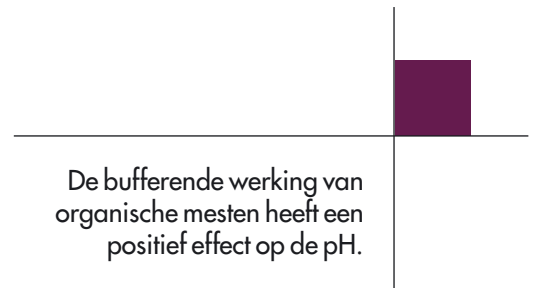
Figuur 1: pH bij verschillende niveaus van organische mest

Op een veehouderijbedrijf draagt gras sterk bij aan het behoud van bodemkwaliteit. Naast de aanvoer van organische stof zorgt klaver voor de stikstofvoorziening. De combinatie van aanvoer van organische stof en stikstof door klaver maakt dat het al dan niet gebruiken van organische mest weinig invloed heeft op de bodembioologische kwaliteit. Wel heeft de bufferende werking van organische mesten een positief effect op de pH. Daarnaast wordt de bodemdichtheid verlaagd door de extra organische-stofvoorziening uit de mest. ■