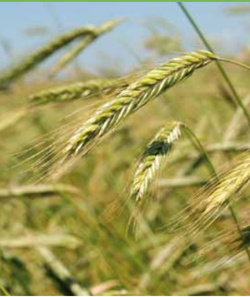
Naast grasklaver teelt Ormel nog 6 hectare zomergraan dat hij geplet aan de koeien voert

ik heb ook heel weinig kosten. Ik hoef bijna niet te maaien en rijd alleen in het voorjaar mest uit.' Naast grasklaver teelt de melkveehouder nog 6 hectare zomergraan dat hij geplet aan de koeien voert. De teelt rouleert over het bedrijf. Extra krachtvoer is niet nodig. De koeien kalven allemaal in het voorjaar af. Ormel: "Het is goedkoper om met de natuur mee te werken. Als het gras begint te groeien, heb je de beste kwaliteit. Precies op het moment dat de koeien dat het meest nodig hebben. Kalven ze in het najaar af, dan moet je krachtvoer