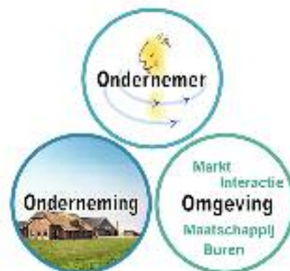
Figuur 1. Met de strategisch management tool beoordeelt de ondernemer zijn eigen situatie door scores in te vullen voor de drie O's van ondernemer (competenties), onderneming (structuur en performance) en omgeving (markt en maatschappij).

Op basis van de drie ISM-uitgangspunten is in diverse projecten een aanpak op maat ontwikkeld, afhankelijk van het doel en de context van het project. We gaan hier in op de groepstraining “Ondernemen met visie”, om ondernemers te ondersteunen in het maken van strategische keuzen voor de lange termijn. Ter ondersteuning van het proces dat de ondernemer gaat doorlopen, is een aantal webbased tools ontworpen. Met de strategisch management tool (SMT) beoordeelt de ondernemer zijn eigen situatie door scores in te vullen voor de drie O's van ondernemer (competenties), onderneming (structuur en performance) en omgeving (markt en maatschappij) (zie figuur 1). Op basis van deze scores berekent de tool een score voor vijftien mogelijke bedrijfstrategieën, bijvoorbeeld toegevoegde waarde ontwikkelen voor producten, bukkproductie, economisch efficiënt ondernemen,