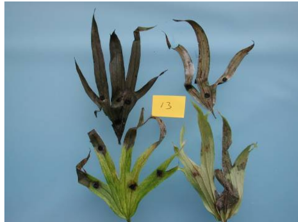
Figuur 13. Symptomen door Phoma schimmel

Uit de bladvlekken zijn opnieuw isolaties gemaakt waarbij dezelfde schimmels werden terug gevonden als waarmee de blaadjes waren geïnoculeerd. Deze schimmels zijn daarna nogmaals microscopisch gedetermineerd waarbij het in alle gevallen om de schimmel Phoma ging. Na genetisch onderzoek bleek de Phoma -schimmel het meest overheen te komen met Phoma cucurbitacearum , die in dit geval dus als de ziekteverwekker mag worden bestempeld. Gezien de zeer grote verscheidenheid van Phoma soorten is een zekere mate van onzekerheid in de soortbepaling moeilijk uit te sluiten.