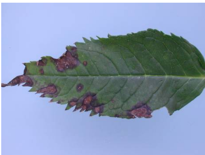
Figuur 14. Symptomen van bladvlekken in Chelone

De bladvlekken in Chelone zijn als volgt beschreven "Bruine ingevallen plekken met een zwarte rand erom. Vooral aan uiteinde van het blad. In een zeer vol gewas". Afbeelding 14 laat een Chelone blad met deze symptomen zien. Uit de bladvlekken zijn de schimmels