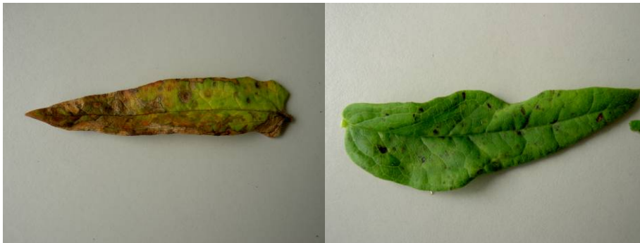
Figuur 18. Symptomen bij Asclepias

De bladvlekken in Asclepias zijn als volgt beschreven: “Rode en donkere vlekken en vergeling op het blad in de kop van de plant. Bladval en afsterven van de plant. Donkere plekken op de stengel”. Uit de bladvlekken zijn de schimmels Alternaria , Phoma en Cladosporium geïsoleerd. Met deze schimmels is een infectieproef uitgevoerd in Bleiswijk.