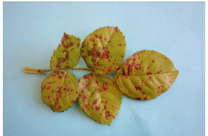
Figuur 2. Diplocarpon in Roos