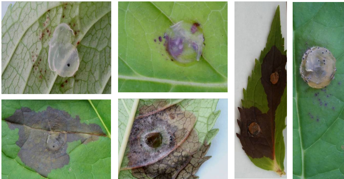
Figuur 15. Isolaat H: Botrytis

Terugisoleren van isolaat H is succesvol geweest. Er is dezelfde Botrytis teruggevonden. Vanwege het iets afwijkende uiterlijk van de bladvlekken in de infectieproef t.o.v. het oorspronkelijke zieke materiaal moet nog wel een slag om de arm gehouden worden. Een sterke overeenkomst waren wel de donkere puntjes voorafgaand aan de infectie en de kleur van het aangetaste weefsel. Er zou nog een tweede infectieproef uitgevoerd moeten worden.