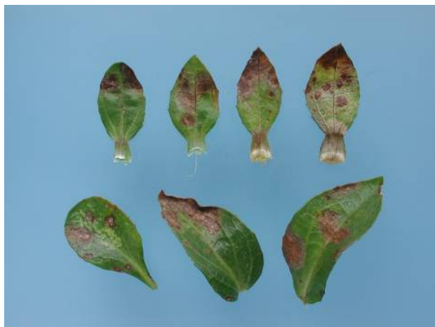
Figuur 3. Bladplekken in Carthamus