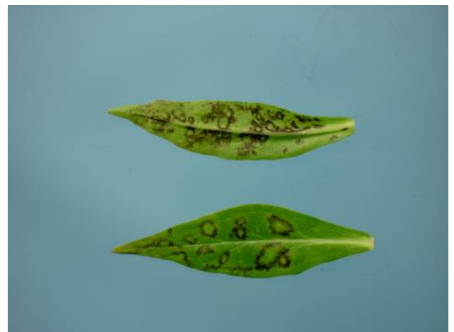
Figuur 4. Bladplekken in Phlox