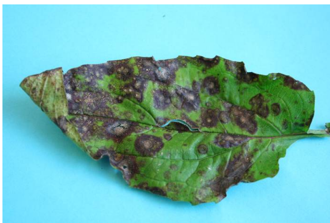
Figuur 5. Bladplekken in Echinaceae