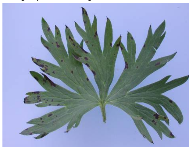
Figuur 11. Vroege symptomen van bladvlekken in Delphinium

Van onderaf ontstaan op het blad onregelmatige, niet scherp begrensde, bruinzwarte bladvlekken die vaak omringd zijn met licht vergelend bladweefsel. Soms is het aangetaste bladweefsel meer zwart dan bruin. In