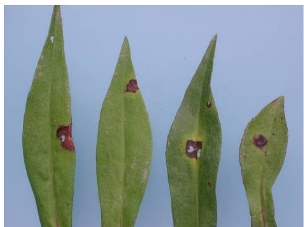
Figuur 6. Bladplekken in Aster