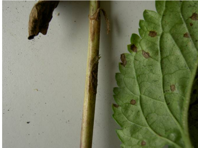
Figuur 16. symptomen bij Veronica

Zowel de paars- als de witbloemige Veronica gaf alleen na kneuzing van het blad enige vlekken. Deze leken niet op de originele vlekken. Terugisoleren leverde echter uitsluitend Cladosporium op. De werkelijke ziekteverwekker is in Veronica dus niet vastgesteld.