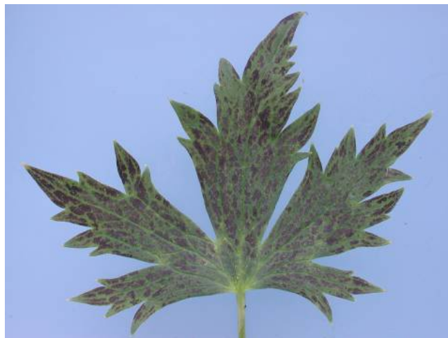
Figuur 8. Gebrekverschijnselen in Delphinium