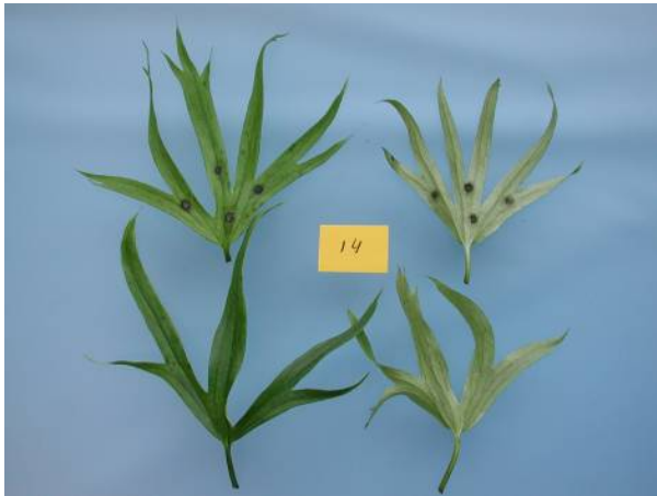
Figuur 12. Geen symptomen door schimmel

Bij de niet-beschadigde blaadjes bleek dat met de schimmel-isolaten 1, 6, 12 en 13 bladvlekken ontstonden met ongeveer dezelfde symptomen als de oorspronkelijke bladvlekken waaruit de schimmels waren geïsoleerd. De bladvlekken ontstonden op zowel de boven- als onderzijde van het blad. Alle andere schimmels en de bacterie waren niet in staat om bladvlekken te veroorzaken. Het maakte daarbij niet uit of de schimmels of bacterie aan de bovenzijde of onderzijde van het blad waren aangebracht.