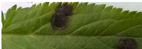
Figuur 17. Bladvlekken op gekneusd blad van Veronica