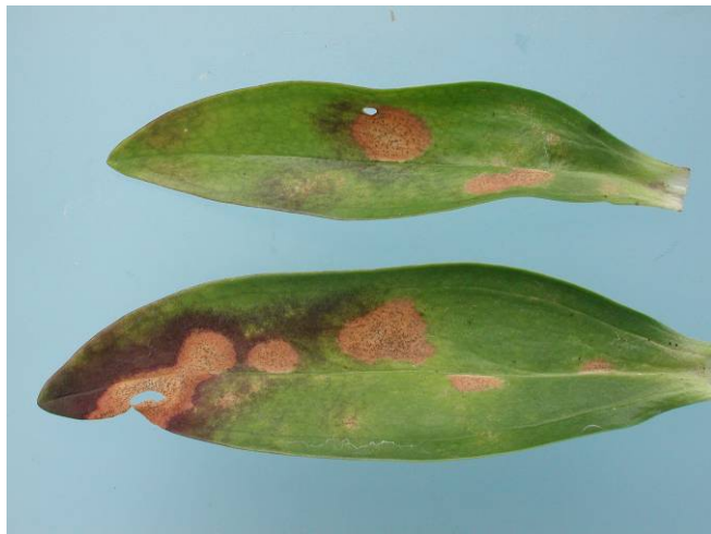
Figuur 7. Bladvlekken in Gentiaan