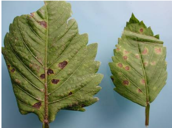
Figuur 1. Entyloma in Dahlia

Hieronder volgen enkele foto's van de gevonden bladplekken die niet verder beschreven worden bij de infectieproeven.