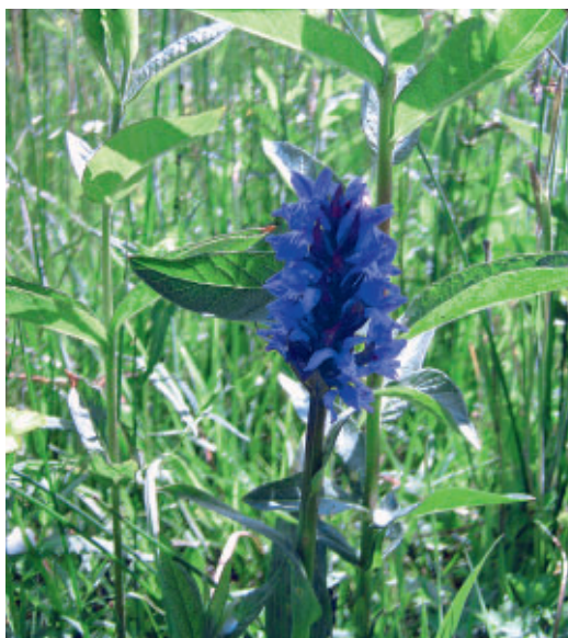
Figuur 5: De landbouwdiversiteitsvisie: het Loonerdiepje