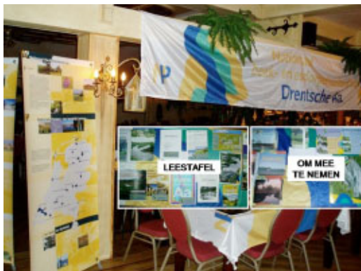
Figuur 2: Een sfeerimpressie van de inloopavond

een Nationaal Landschap. Nationale Landschappen kenmerken zich door de specifieke samenhang tussen de verschillende onderdelen van het landschap, zoals natuur (flora en fauna), reliëf (bijv. beekdalen en terpen), grondgebruik (bijv. landbouw, watermanagement) en bebouwing (bijv. dorpsgezichten en forten) en bieden dus meer mogelijkheden om functies te combineren.