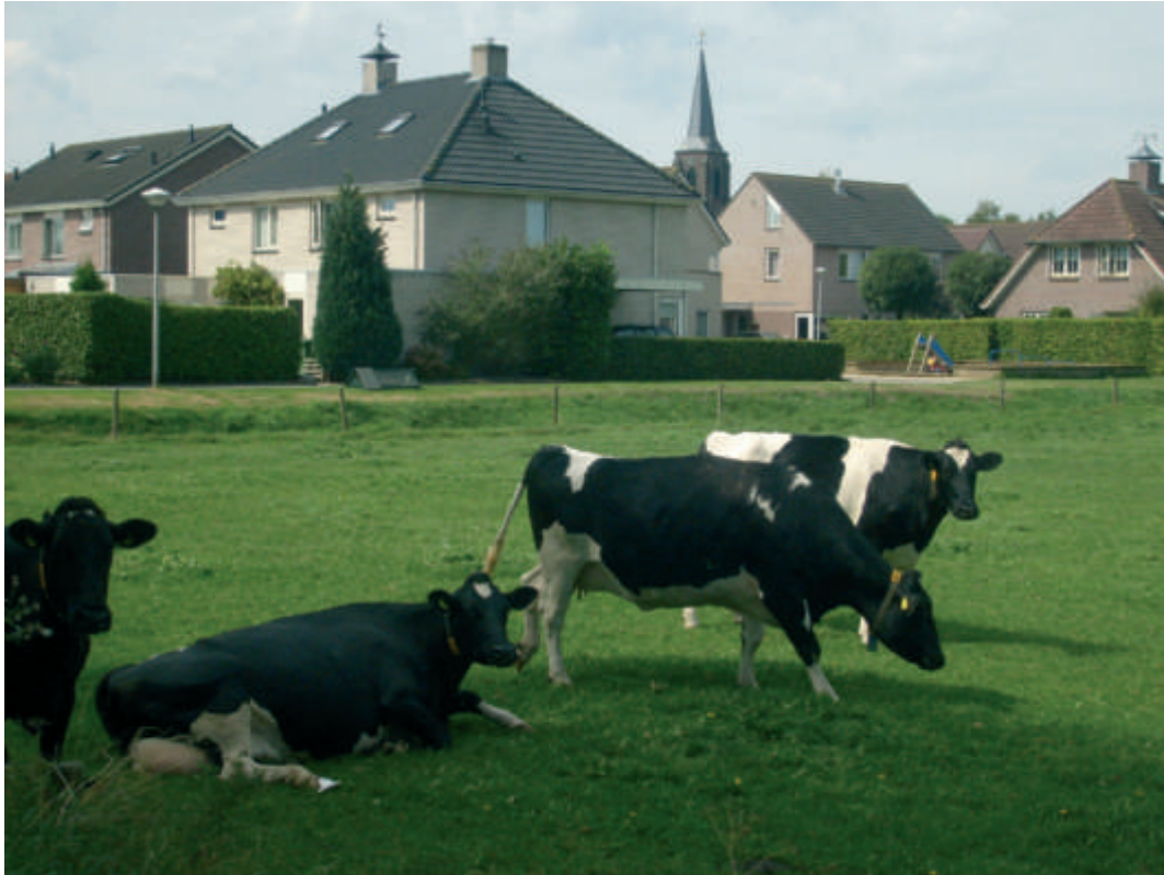
Nieuwbouwwijkje in Lierderholthuis, grenzend aan weilanden.