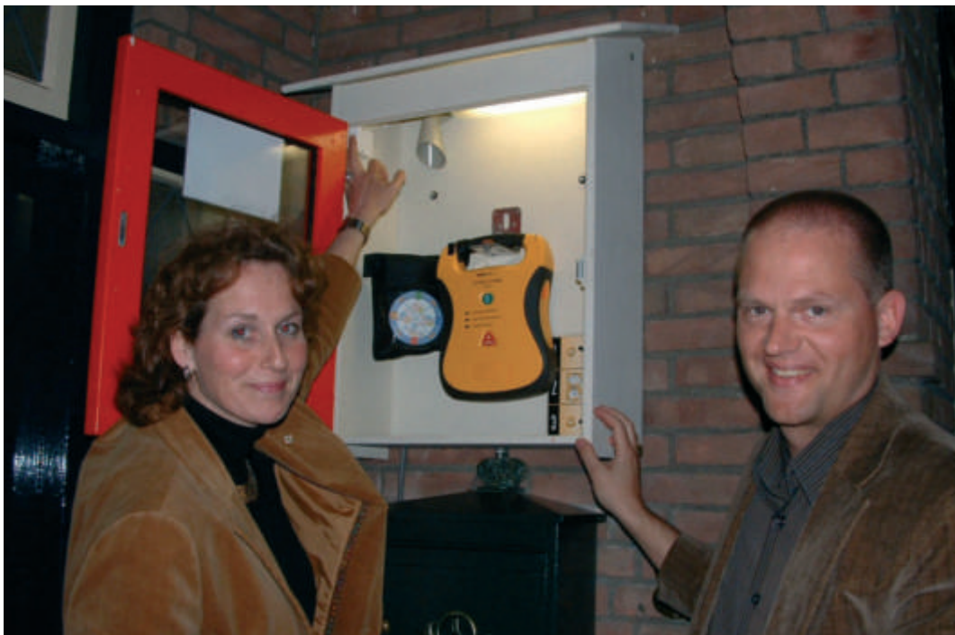
Ritueel bij de installatie van defibrillators in Wesepe.