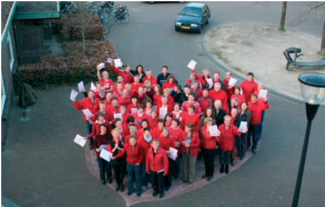
Feestelijk ritueel ter afsluiting van de cursus reanimeren in Lierderholthuis (foto door Theo Keizers).