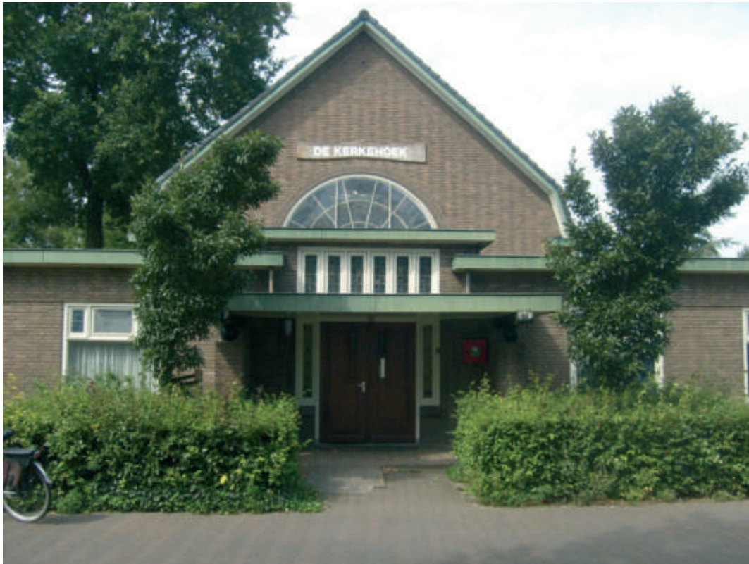
Het verenigingsgebouw Kerkehoek in Liederholthuis dat verbetering behoeft.