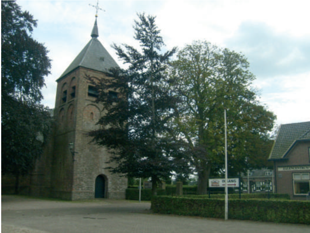
De dorpskern van Wesepe.