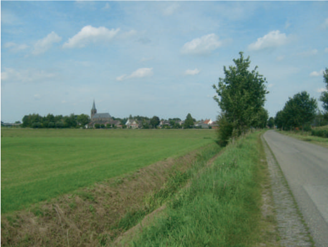
Gezicht op Lierderholthuis.