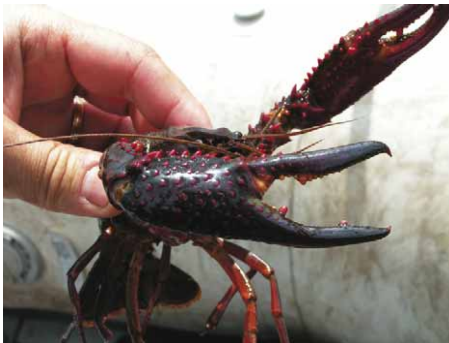
Rode Amerikaanse rivierkreeft.

De Amerikaanse rode rivierkreeft bleek een opportunist te zijn; alles wat beschikbaar was in de cilinders werd ook gegeten. Het grootste gedeelte van het dieet bestond uit organisch bodemmateriaal en plantenresten (zie afbeelding 2). Ook werden in kleinere hoeveelheden zandkorrels en dierlijke resten (vrijwel altijd schelpfragmenten van mollusken) aangetroffen. Identificatie van de dierlijke resten leverde een gevarieerd beeld op: in de maag en darm van elke kreeft werden resten van mollusken aangetroffen, zowel tweekleppigen (Bivalvia) als slakken (Gastropoda). Verder werden er in de helft van de kreeften resten van adulte kevers (Coleoptera) aangetroffen, in 30 procent