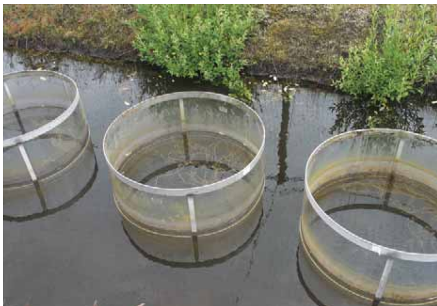
Proefsloot op de Sinderhoeve met hierin de cilinders met kreeften.