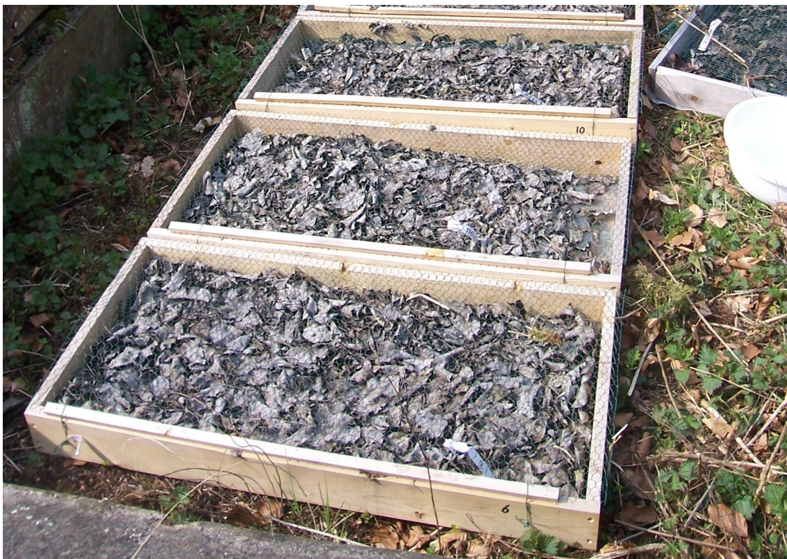
Foto 1 Kooien met overwinterend blad

de winter. De bovenzijde was voorzien van kippengaas tegen het wegwaaien. De kooien werden buiten overwinterd op kale grond. In het voorjaar werden de gaaskooien verplaatst naar een locatie nabij het meetlaboratorium. De plek bevond zich op zandgrond, waar van tevoren het onkruid verwijderd was, zodanig dat alle bakken evenveel vocht uit de ondergrond zou kunnen opnemen en evenveel zonlicht van boven zou kunnen ontvangen. In geval van naderende regen werd doorzichtig plastic boven de gaasramen gespannen, zodanig dat het bladmateriaal niet nat kon regenen en er nog voldoende ventilatie mogelijk was. Dit om te voorkomen dat de sporen voortijdig vrijkwamen. Het moment van het monsternamen uit de bakken werd bepaald door een aaneengesloten warme en droge periode, circa 20°C overdag. De eerste bemonstering vond plaats op 15-4-2009, waarna het aantal ascosporen op het blad is gemeten. Voor de tweede bemonstering is 100 g blad uit elke kooi op 22-4-2009 verzameld, en vervolgens een week geïncubeerd in aluminium bakken op vochtig filterpapier afgedekt met plastic bij kamertemperatuur, waarna op 29-4-2009 het aantal ascosporen is gemeten.