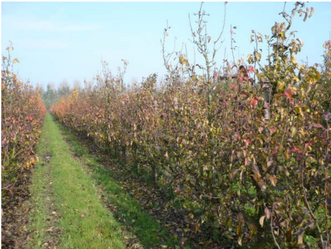
Foto 2 Bruinverkleuring van het blad na bespuiting met Vinasse

In de dagen na de bespuiting kleurde het blad bruin aan de boom. De niet bespoten bomen vertoonden een geleidelijke overgang van groen naar geel/oranje. Zie bomen op de achtergrond van foto 2. Er was geen sprake van echte verbranding. Bij het uitlopen in 2009 viel niets bijzonders op aan de bladstand of de bloei. Er zijn geen tellingen verricht aan deze aspecten.