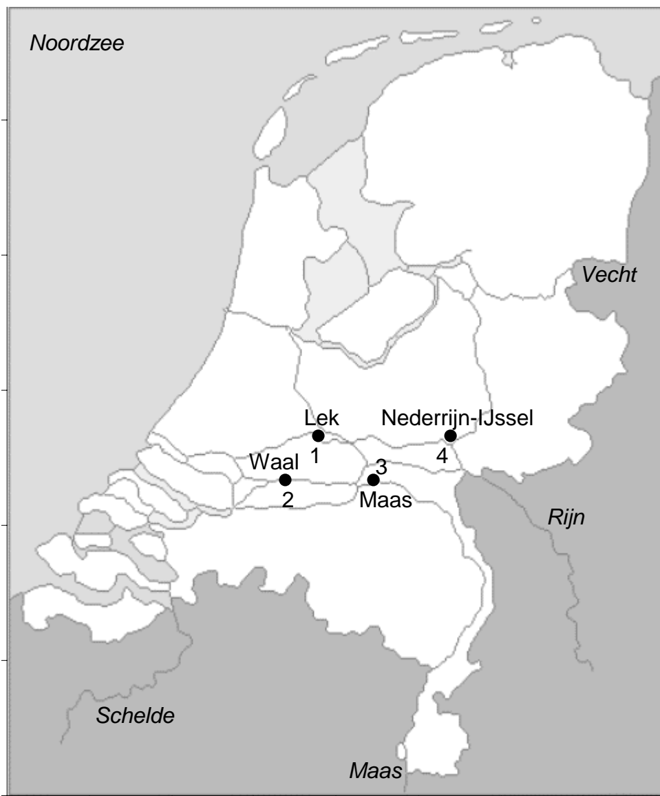
Figuur 2. Overzicht van de locaties van de zalmsteken die worden geregistreerd