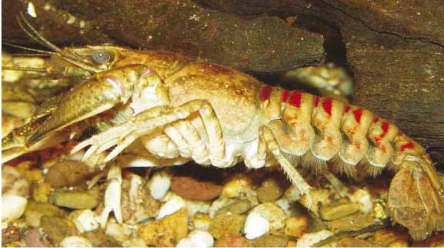
De gevlekte Amerikaanse rivierkreeft is de meest voorkomende kreeftensoort in de Nederlandse wateren (foto: Fabrice Ottburg).

kreeften voorkomen, worden nauwelijks waterplanten aangetroffen. Indirect effect is het afnemen van ei-afzetplaatsen voor vissoorten als rietvoorn ( Rutilus erythrophthalmus ), grote modderkruiper ( Misgurnus fossilis ) en snoek ( Esox lucius ). Onderzoek in Engeland 7) toont aan dat rivierdonderpad ( Cottus rhenanus ) moet concurreren om schuilplaatsen met de aanwezige exotische rivierkreeften. Ook juveniele donderpadden worden door de kreeften gepredeerd. De aanwezigheid van deze exotische rivierkreeften kan dus grote gevolgen hebben voor het aquatisch ecosysteem, onder andere door de hoge dichtheden waarin de soort voorkomt en het gebrek aan natuurlijke vijanden bij volwassen exemplaren 5) .