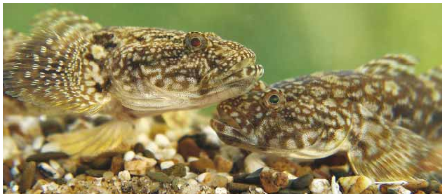
Sinds 2007 is een sterke toename van Kesslers grondels waar te nemen op de grote rivieren.

komen al lang hier voor, zoals karper, regenboogforel, bronforel en snoekbaars. Dit zijn soorten die hier uitgezet zijn voor de sportvisserij (zie tabel). De karper komt al heel lang in Nederland voor, maar wordt nog regelmatig uitgezet om de populatie op peil te houden. Het Nederlandse klimaat is niet geschikt voor het in stand houden van de populatie.