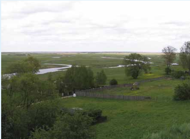
De Biebrza-vallei in de zomer.