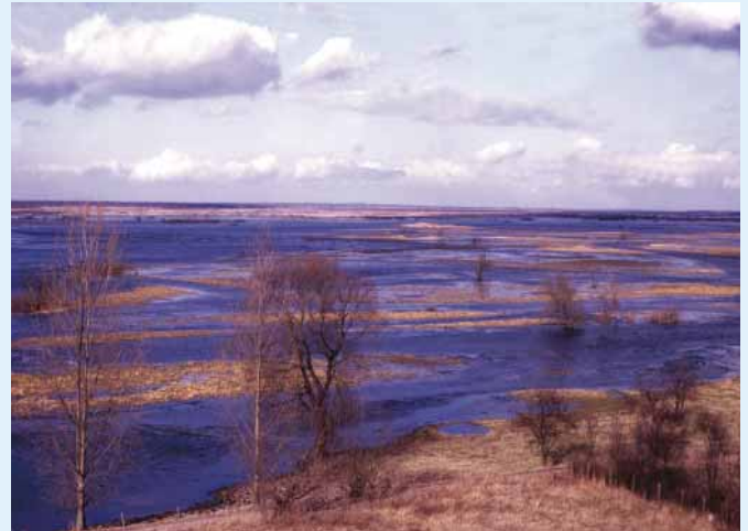
De Biebrza in het vroege voorjaar als de gehele vallei overstroomt.

en het oppervlaktewater wordt op geïntegreerde wijze gemodelleerd. Voor IMUZ was het toepassen van een toch wel complex model als SIMGRO niet nieuw: sinds 1994 werd het reeds in enkele projecten gebruikt, gericht op landbouwkundige aspecten als peilbeheer en waterbeschikbaarheid. Voor de Biebrza, met strenge winters en langdurige perioden met sneeuw, is het van belang dat deze weersomstandigheden in het hydrologisch model worden meegenomen. Hiervoor is een module aan het model gekoppeld die de hydrologische processen in perioden met sneeuw en strenge vorst beschrijft. Het model is voorts getoetst aan beschikbare grondwaterstandgegevens en afvoeren van de rivier de Biebrza.