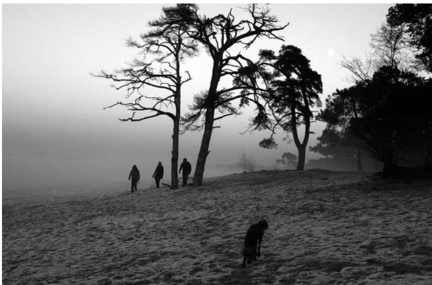
Imatge 2. Parc nacional de Loonse en Drunense Duinen.

paisatges que s'hi emmarquen tenen un gran protagonisme per l'obtenció d'ingressos derivats d'activitats de lleure i del turisme.