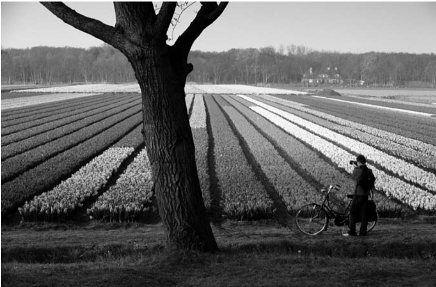
Imatge 1. El Memoràndum del paisatge es basa en el principi de la segregació funcional, característica associada internacionalment a la política ambiental i paisatgística dels Països Baixos.

específiques s'adreça als camps d'actuació següents: el patró paisatgístic natural, que recull una selecció dels patrons i els elements que determinen la identitat del paisatge holandès a escala nacional; les zones amb característiques històriques, culturals, geològiques i geomorfològiques de gran valor, anomenades paisatges culturals valuosos; les zones amb una obertura o un tancament visual singular, que es tradueix en la voluntat de conservació dels límits visuals a escala de paisatge; les zones on la qualitat del paisatge és tan minsa que cal plantejar-se una nova estructura del paisatge mitjançant plans de millora, i, per acabar, el paisatge periurbà que limita amb les grans ciutats situades al centre del país.