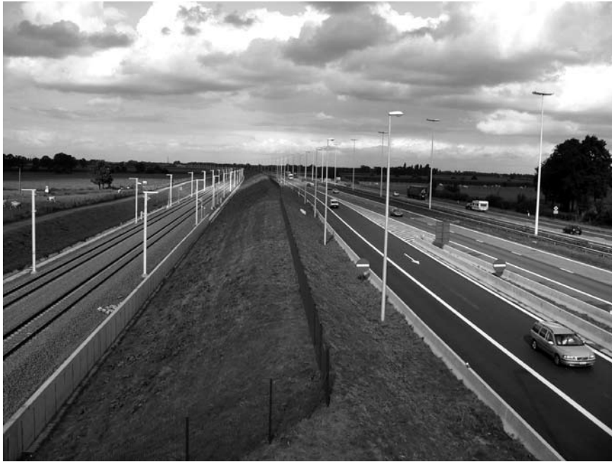
Imatge 3. Tren d'alta velocitat i autopista al sud d'Holanda.

Pel que fa a la política nacional de cinturons verds ( Rijksbufferzone-beleid ), segons l'Agència de Control Mediambiental els resultats han estat força positius. En aquest camp, el Govern central ha exercit des de la dècada de 1950 una gran influència en els plans de planificació regionals i locals, mitjançant la compra de terrenys per utilitzar-los com a espais verds i de lleure. En la major part dels casos, com a Midden Delftland, les administracions locals han compartit aquesta preocupació pels espais verds i han col·laborat activament en el manteniment i el control de les polítiques territorials. Tot i així, l'espai de lleure de la regió de Randstad encara és insuficient, i al voltant de les grans ciutats encara hi ha pocs llocs per anar amb bicicleta o caminar (Kuiper, 2008). Aquesta manca d'espais verds per a activitats de lleure és un dels problemes persistents de les polítiques holandeses.