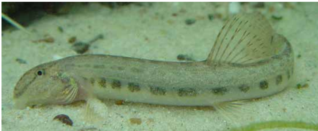
De Kleine modderkruiper. De soort wordt gekenmerkt door een fraai patroon van zwarte vlekken op een lichtbruine ondergrond. Het dier is in ons land niet zeldzaam en kan worden aangetroffen in allerhande stilstaande en langzaam stromende wateren, waaronder sloten en weteringen.

Hoewel de soort landelijk gezien niet bedreigd is, kunnen lokale populaties verstoord worden door vermesting en/of achterstallig baggeronderhoud van sloten. Dit kan leiden tot een zuurstofarme omgeving, waarin zich maar weinig macrofauna en waterplanten kunnen handhaven. Door het ontbreken van voedsel wordt de situatie voor de Kleine modderkruiper in dit type sloten onleefbaar. Het baggeren zelf kan echter ook funest voor het voortbestaan van de soort zijn, indien dit te rigoureuus gebeurt. Om te voorkomen dat soorten als de Kleine modderkruiper binnen een stelsel van poldersloten verdwijnen, kan men het baggeren het beste gefaseerd uitvoeren.