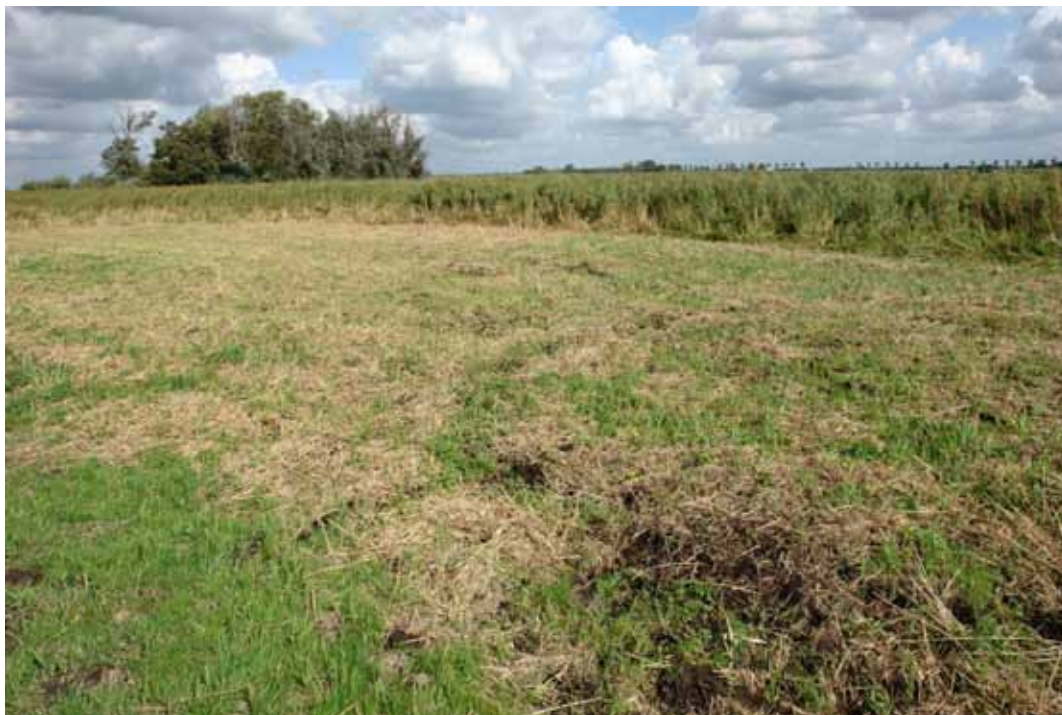
Niet afgevoerd maaisel.

Het is van groot belang dat verruiging (meer voedselrijke situaties met voedselminnende planten) wordt tegengegaan. Daarom is het van belang dat maaisel wordt afgevoerd. Ten tijde van een excursie (eind september 2009) was dit (nog?) niet gebeurd. Tevens moet op plekken waar nu al opslag en bosvorming is opgetreden deze opslag worden verwijderd. Om toevoer van nutriënten tegen te gaan zou de (kunstmest en drijfmest) bemesting in het gebied moeten worden gestaakt. Bemesting met stalmest in de polder verdient de voorkeur, zoals nu op sommige percelen al gebeurt. De directe omgeving van en de percelen met veenmosrietland moeten niet worden bemest.