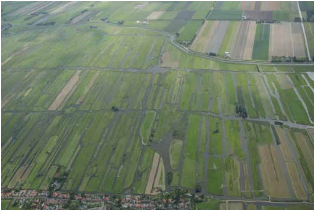
Zicht op de Eilandspolder-Oost.