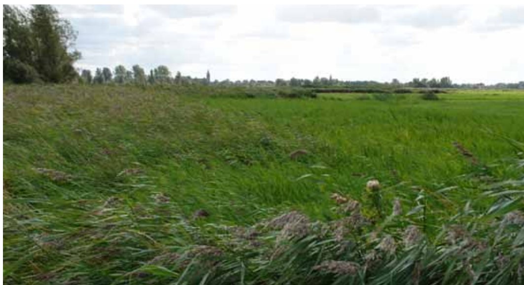
Overjarig en recent gemaaid riet.

De Eilandspolder-Oost bevat nog een klein aantal locaties, die ecologisch de moeite waard zijn en ook een aantal gewenste soorten is nog in het gebied aanwezig. Het beheer is echter onvoldoende om de typen en soorten te behouden en een grotere beheersinspanning is noodzakelijk. Dit kan deels zeer eenvoudig door bijvoorbeeld de aanwezige bemalingsmolentjes te herstellen en goed te gebruiken, het maaibeheer adequaat uit te voeren en de mestgift op sommige percelen te stoppen. Daarnaast is het zeer noodzakelijk om de waterstandregulatie natuurvriendelijker te maken en achterstallig onderhoud (verwijderen bosopslag) uit te voeren. De hydrologische situatie dient op orde te worden gebracht en als het zoute element van de strooiselruigte behouden moet blijven, zal toevoer van zout water moeten worden geregeld (vanuit diepere watervoerende lagen?). Als dit onverhoopt niet mogelijk is moet worden ingezet op behoud van de zoete variant van dit habitattype. Het behoud van beide typen is alleen te realiseren als het oppervlak van beide typen wordt uitgebreid. Daarvoor is zeker nog potentie aanwezig in het gebied.