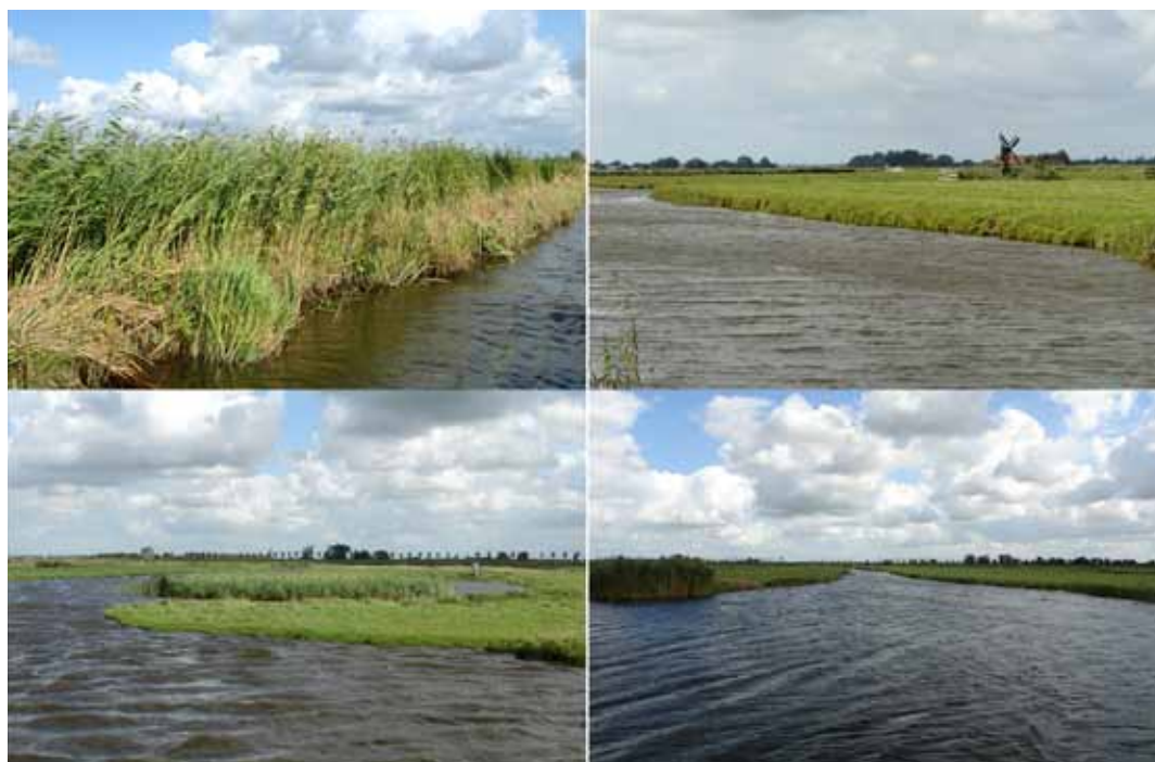
Bovenstaande foto's illustreren goed dat de oevers geen goed habitat vormen voor kleine modderkruipers, juveniele bittervoorns en andere soorten als meerkikkers, rugstreppadden, libellen en noordse woelmuizen.

Meer geleidelijke oevers met de bijbehorende vegetatie in combinatie met een gefaseerd beheer, zullen ook bijdragen aan meer duurzame populaties van andere soorten organismen, waaronder de Noordse woelmuis.