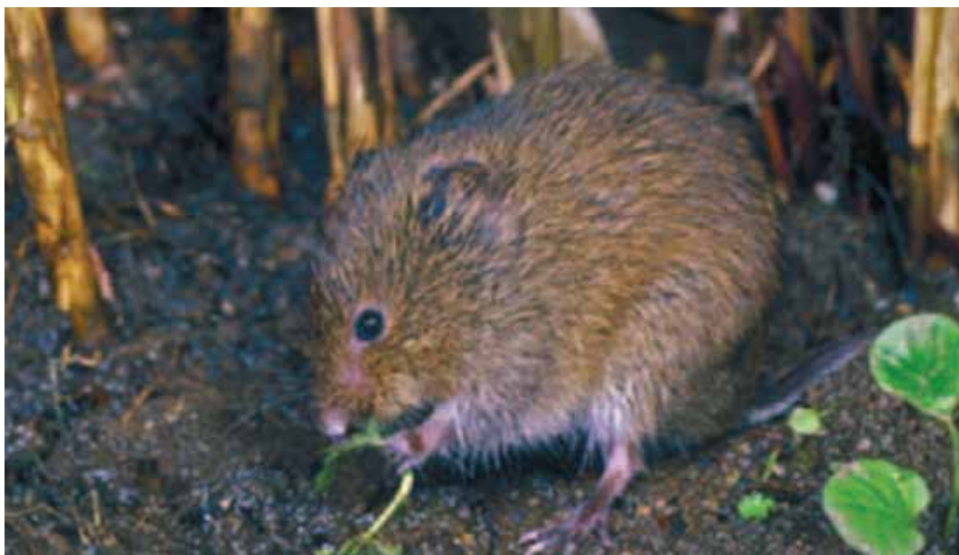
Noordse woelmuis.

Het beheer dat afgestemd is op het handhaven van de soort in deze vegetaties ziet er als volgt uit (Nijhof & van Apeldoorn, 2001; Bergers et al., 1998):