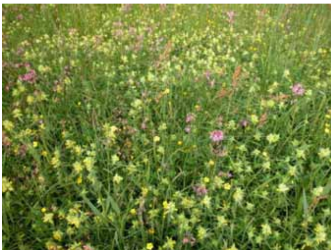
Bloemrijke graslanden stellen hoge eisen aan het waterbeheer.