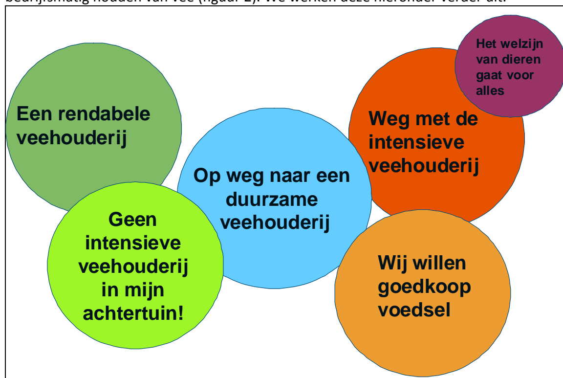
Figuur 2: Zes configuraties

In de media konden we een zestal configuraties onderscheiden in discussies over het bedrijfsmatig houden van vee (figuur 2). We werken deze hieronder verder uit.