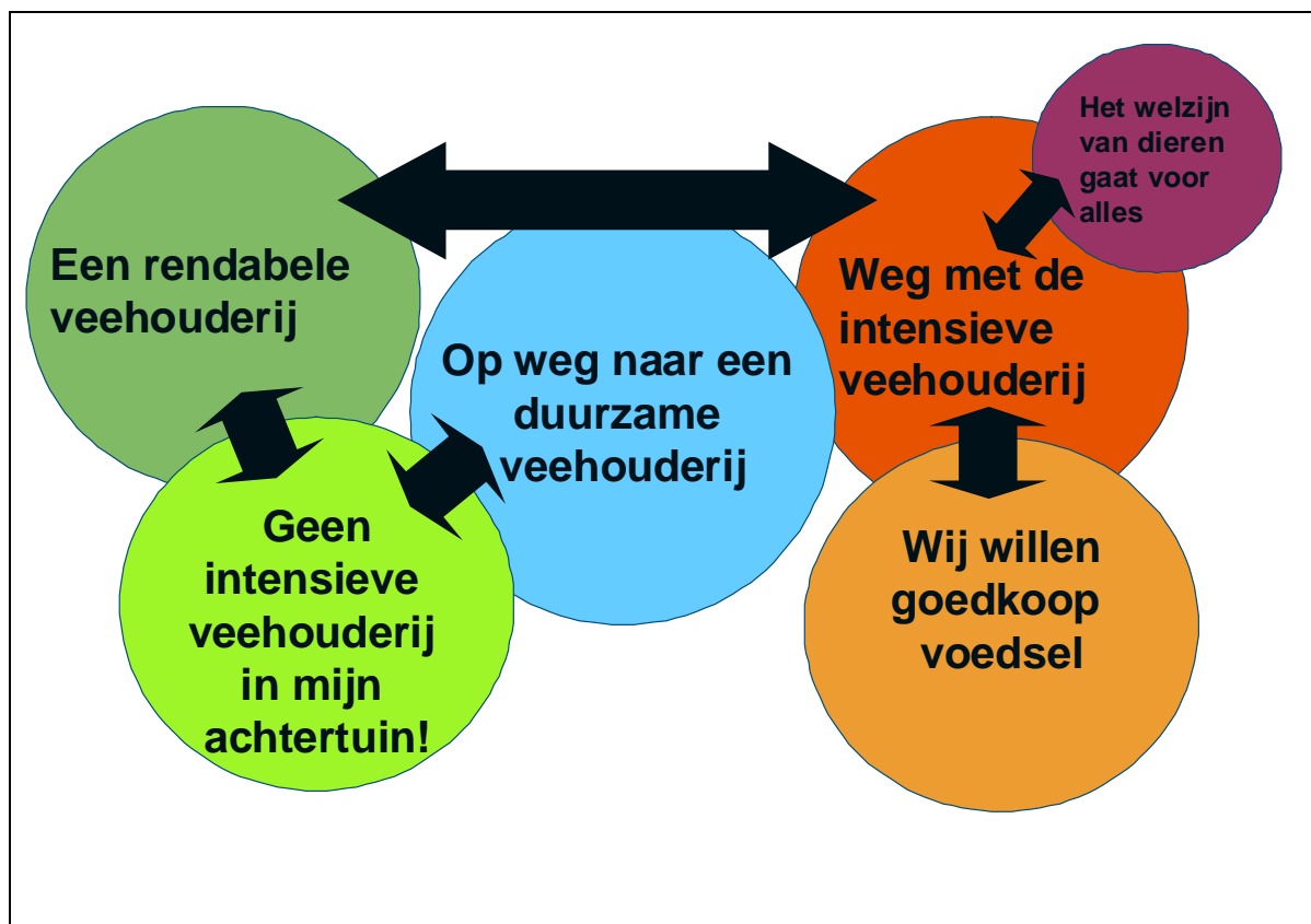
Figuur 3: Spanningen tussen configuraties

Wanneer mensen vanuit verschillende belevingswerelden en fixaties met elkaar communiceren, kan dat tot spanningen leiden. Deze zijn groter naarmate er meer interacties zijn en naarmate de verschillen in opvattingen en frames groter zijn, en configuraties vooral gericht zijn op het bevestigingen van de eigen overtuigingen en het buitensluiten van andere opvattingen. Uit de media-analyse kwamen een aantal spanningen tussen configuraties naar voren die hieronder nader worden toegelicht (figuur 3).