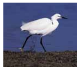
Kleine Zilverreiger Uitgestorven 19 e eeuw, terug 1979