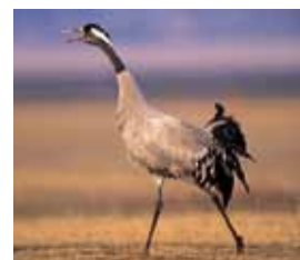
Kraanvogel Uitgestorven 18 e eeuw, terug 2001