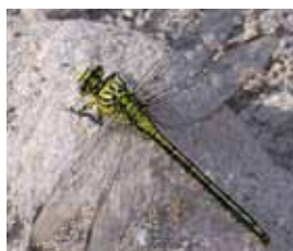
Rivierrombout Uitgestorven 1902, terug 1996