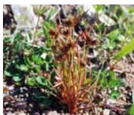
Kopus Uitgestorven 1975, terug 1997