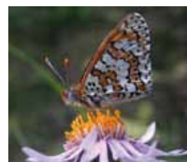
Veldparelmoervlinder Uitgestorven 1995, terug 2004