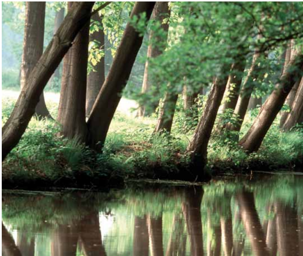
Nederland kan kiezen voor natte Deltanatuur.

Voor de toekomst ziet de ambtelijke werkgroep twee mogelijke richtingen voor het natuurbeleid. Nederland zou de EHS kunnen versterken en uitbouwen om de Nederlandse natuur beter bestand te maken tegen klimaatverandering en de daarmee gepaard gaande risico's van overstromingen / risico van zeespiegelstijging: 'Hoog en droog, robuuste nationale ruggengraat'. De tweede optie is 'Nederland bolwerk van Deltanatuur'. Daarin wordt Nederlandse natuur bekeken door een Europese bril. Investerings moeten vooral gedaan worden in gebieden die de Nederlandse natuur uniek maken in Europa: de Zeeuwse Delta, de Waddenzee, gebieden langs de grote rivieren en heide- en zandgebieden. Nederland zou dan ook moeten investeren in de dynamische natuur die kenmerkend is