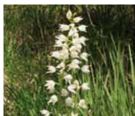
Wit Bosvogeltje Uitgestorven 1994, terug 2009