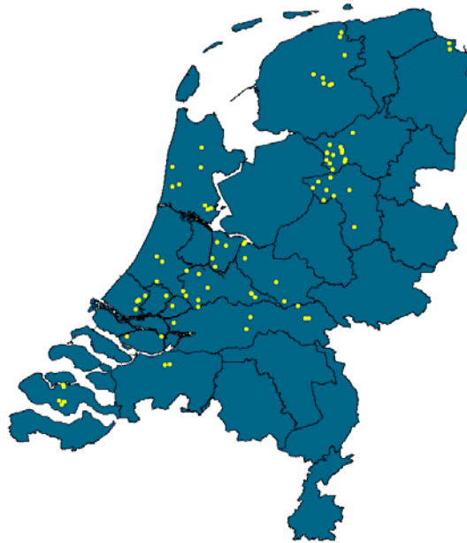
Figuur 1 Veldinventarisatie naar het voorkomen van kroossoorten in 2007 (project PLONS), waarbij van 80 sloten in Nederland vegetatieopnamen zijn gemaakt

Er is gekeken naar het voorkomen van Klein kroos ( Lemna minor ), Dwergkroos ( Lemna minuta ), Bultkroos ( Lemna gibba ), Puntkroos ( Lemna trisulca ), Wortelloos kroos ( Wolffia arrhiza ), Veelwortelig kroos ( Spirodela polyrhiza ) en Grote kroosvaren ( Azolla filiculoides ).