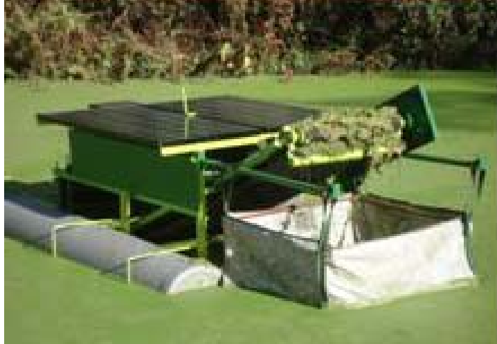
Afbeelding 3 Krooswiel van firma BOM Aqua BV dat draait op zonne-energie