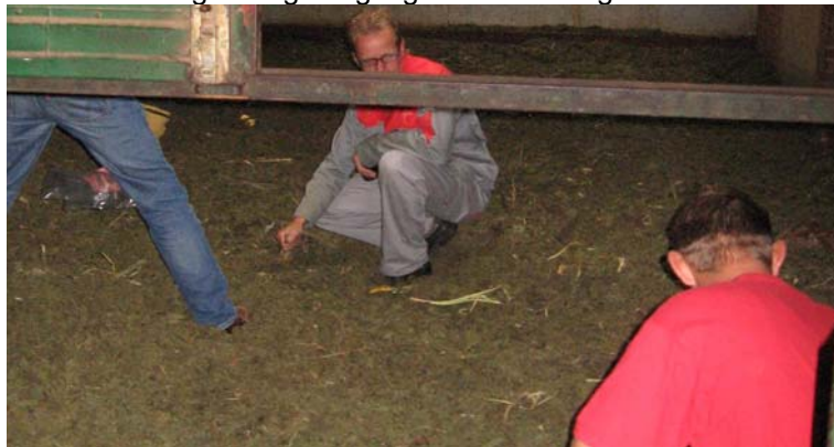
Afbeelding 1 Eendenkroos gedroogd in gasgestookte droogkamers

Bij een snellere oogstmethode moet worden voorkomen dat veel afval wordt mee geoogst, zodat de sorteerstap achterwege kan blijven.