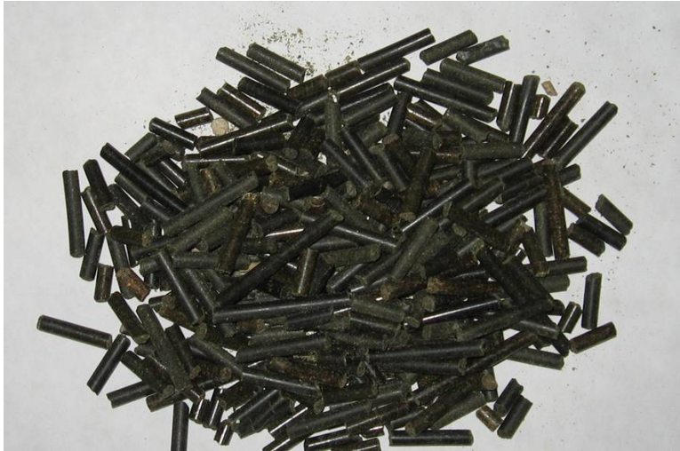
Afbeelding 2 Kroosbrok

Het voordeel van gedroogd kroos is dat we het voor langere tijd kunnen opslaan. Zo kan voldoende voorraad worden opgebouwd, waarmee vervolgens in één keer een bepaalde hoeveelheid brok geperst kan worden met kroos als basisgrondstof. Op deze manier kan kroos bijvoorbeeld ingezet worden op het moment dat de sojaprijzen relatief hoog zijn. Kroos kan ook op verzoek van een afnemer kunnen worden toegevoegd aan een bepaalde partij.