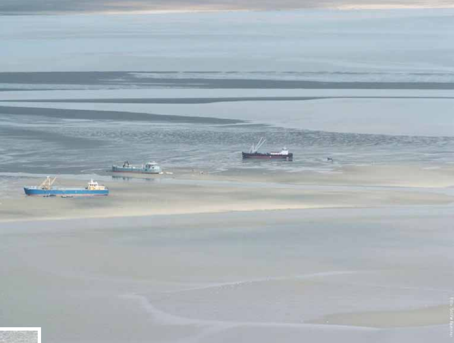
Schepen van handkockelaars

wordt ook een opmars van andere bronnen van grondstof verwacht. Afhankelijk van het succes van deze alternatieven zal stapsgewijs de bodemvisserij worden beëindigd. In de loop van de jaren zal het areaal aan natuurlijke en oudere mosselbanken in de Waddenzee