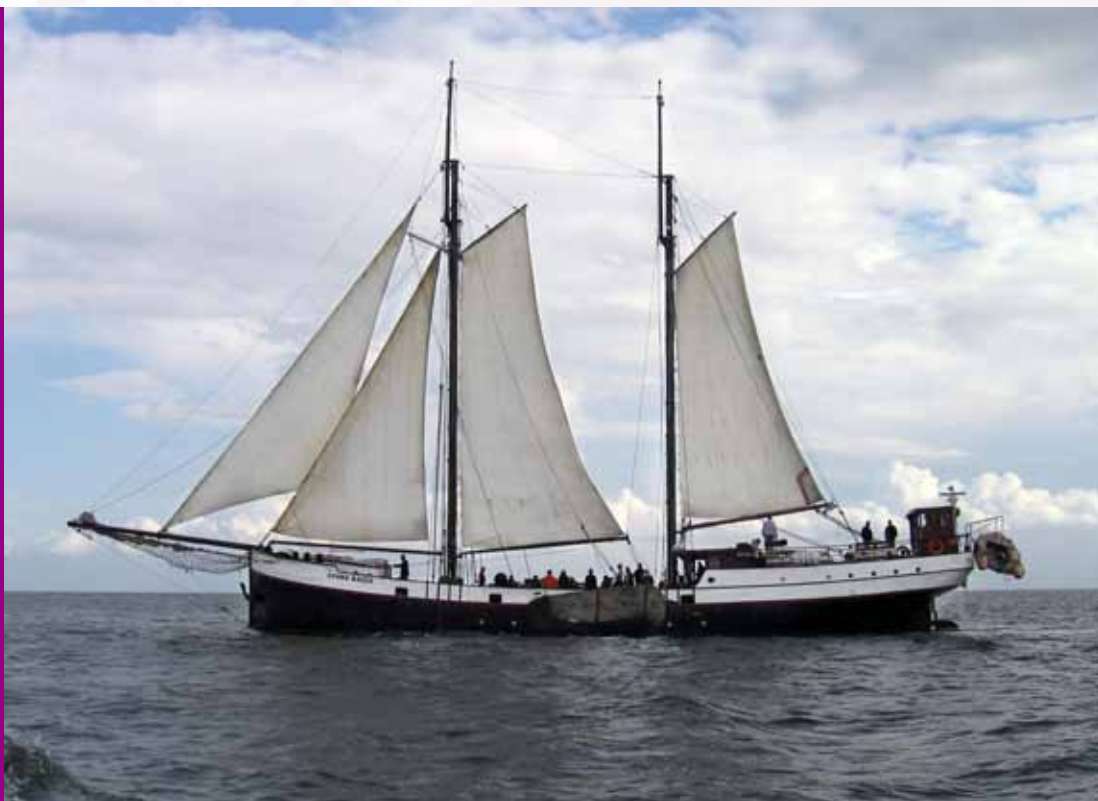
Zeilen op het Wad

In het Waddengebied vindt ook sportvisserij plaats met hengels, recreatieve visserij met vaste vistuigen (tot 2011) en recreatieve visserij door handmatig rapen van schelpdieren. De recreatieve visserij en de beroepsvisserij ervaren elkaars activiteiten als concurrentie om ruimte en om vis. Betere communicatie tussen beide groepen kan de situatie verbeteren: door duidelijkere afspraken over ruimtegebruik en het exploiteren van visbestanden kunnen conflicten vermeden worden.