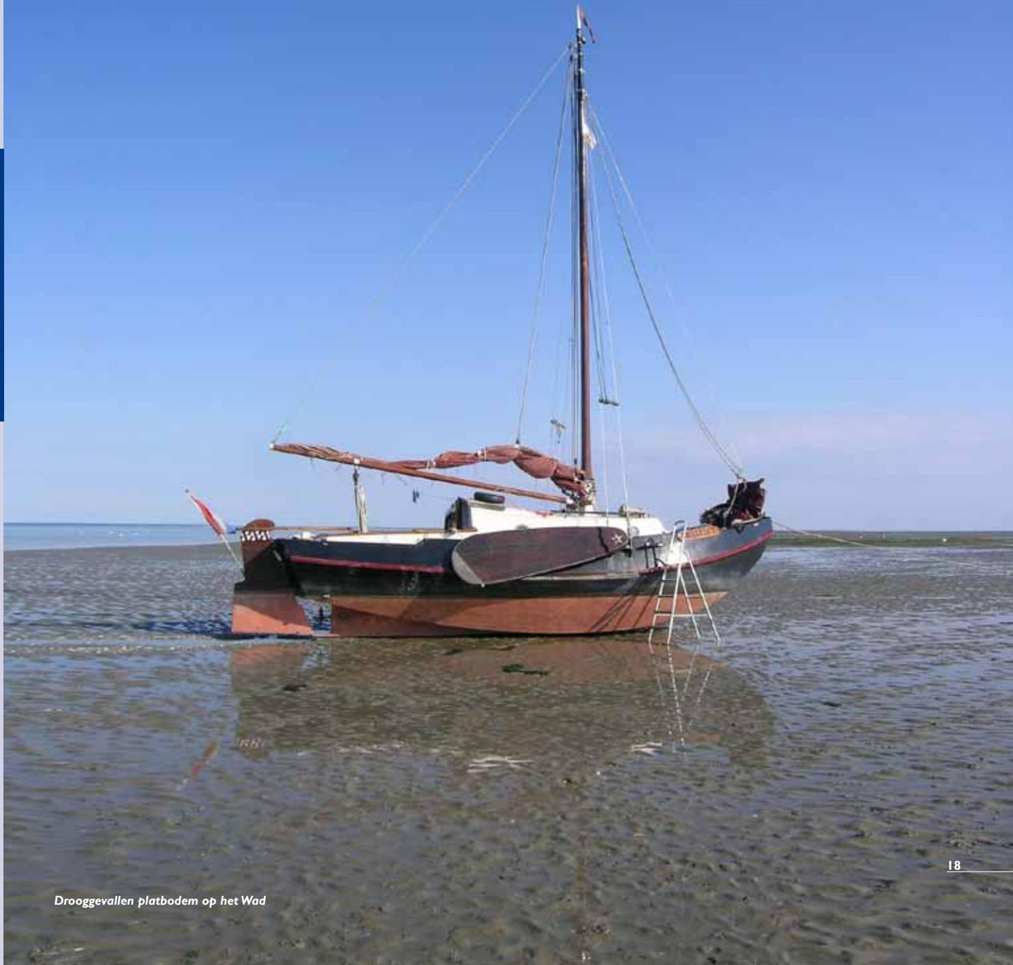
Drooggevallen platbodem op het Wad