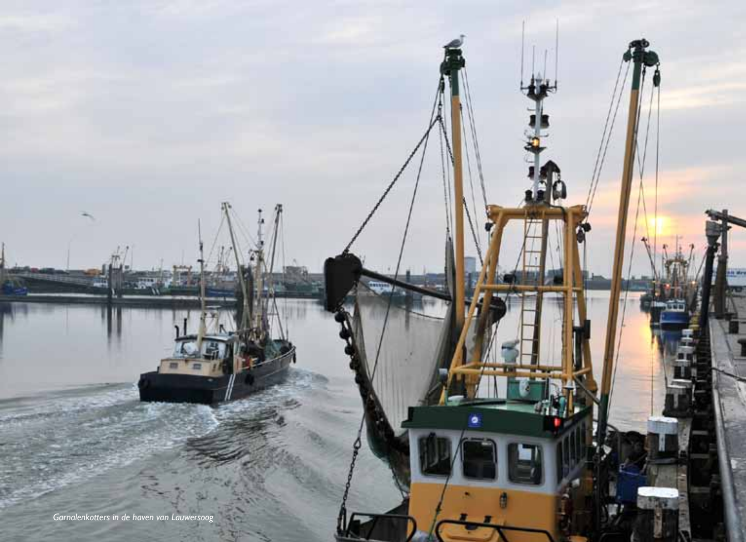
Garnalkotters in de haven van Lauwersoog