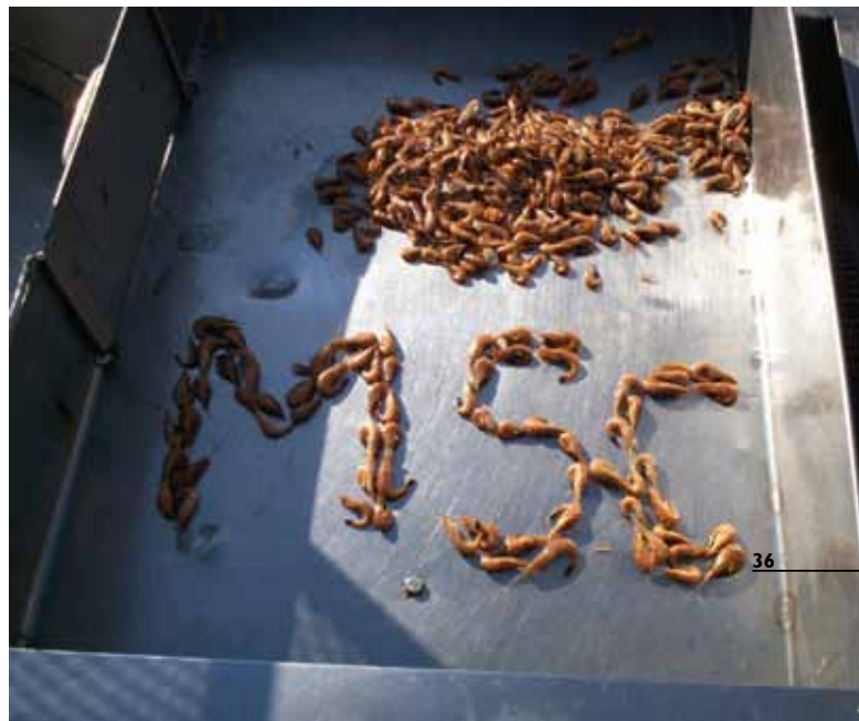
Garnalenvissers gaan voor MSC certificaat

Een derde traject dat invloed heeft op alle visserijen op de Waddenzee, is de ontwikkeling van het Beheerplan Natura 2000 door Rijkswaterstaat. Het beheerplan is de nadere uitwerking van het Natura 2000 beleid voor de Waddenzee. In dit beheerplan wordt vastgelegd