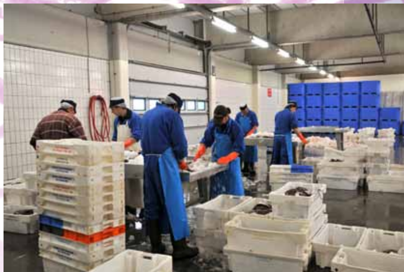
Visafslag in Lauwersoog

De vermarkting van producten uit de Waddenzee kan beter: men is nu nog teveel gericht op kwantiteit in plaats van kwaliteit. Er wordt te weinig gebruik gemaakt van het feit dat producten uit het bijzondere Waddengebied een hoge waarde voor de consument kunnen hebben. Meer aandacht voor de kwaliteit en diversiteit van de producten en voor de mogelijkheden van vermarkting van deze producten, is nodig. Bovendien leggen de producten van zee naar consument een lange weg af via teveel schakels. Dat kan efficiënter. Vissers zouden hogere en stabilere prijzen voor hun vis moeten kunnen krijgen door gebruik te maken van nichemarkten (dus: specifieke en