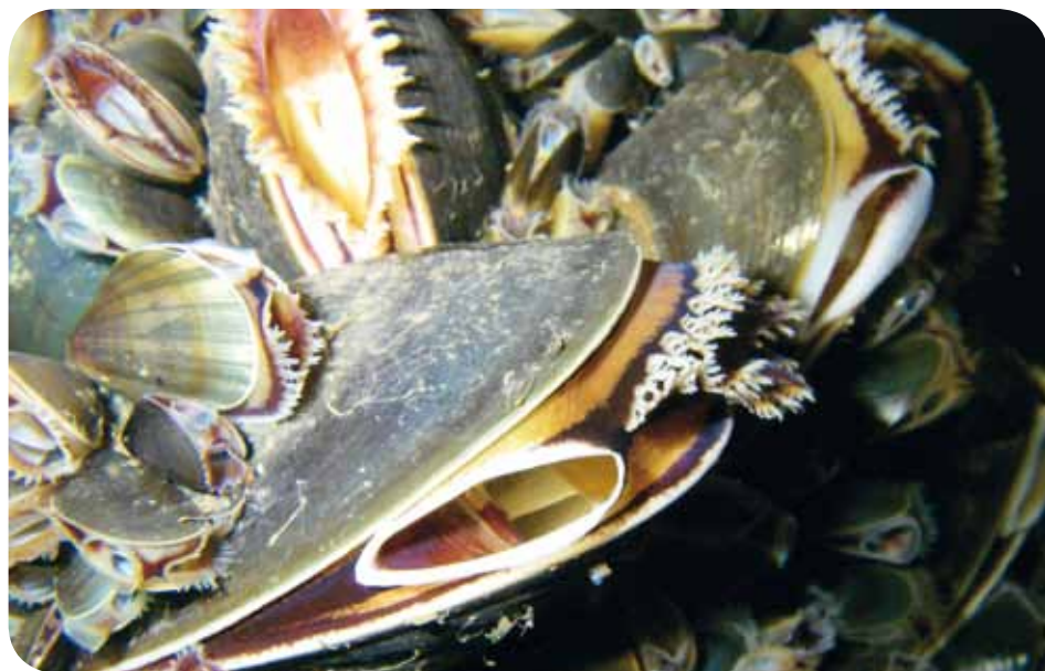
Close up van een mosseltouw (Pijler I: individuele niveau)

brengsten minder achteruit zijn gegaan dan de totale productie. Momenteel wordt ongeveer 25% van de productie geëxporteerd, waarbij Frankrijk en Israël de belangrijkste exportlanden zijn. Er wordt jaarlijks 50-80 ton Noorse mosselen naar Nederland geëxporteerd. Er is geen tekort aan mosselzaad dat wordt ingevangen in de hangcultuur. Voor dit materiaal is eveneens belangstelling vanuit Nederland maar momenteel er is nog geen mosselzaadexport van betekenis. Veel Noorse kwekers werken parttime in de mosselkweek en naar schatting maken slechts 25 bedrijven maximaal gebruik van hun vergunningen. Hieronder zijn vier grote bedrijven: Åfjord Skjell, Arctic Shellfish, Snadder & Snaskum en Oldemann-groep.