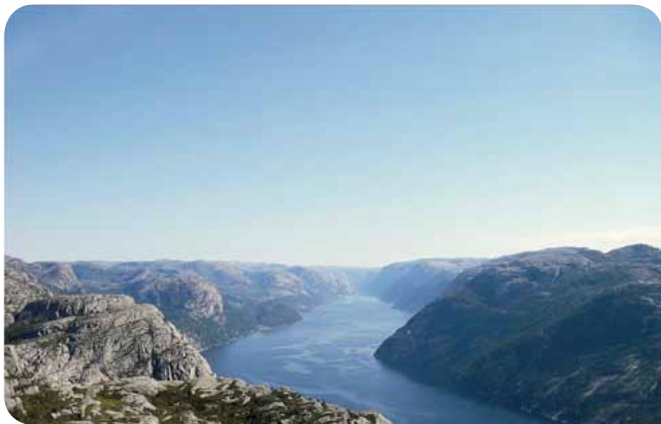
Lysefjord, een mossel-fjord in het zuid-westen van Noorwegen (pijler III: ecosysteem niveau)