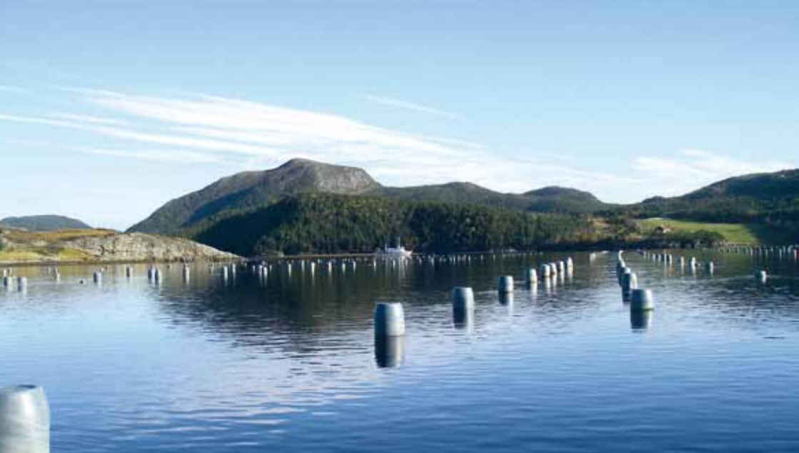
Mosselhangcultuur in Åfjord, Trøndelag (Pijler II: kwekerij niveau)

(schepen en machines om te oogsten, sorteren en resoeken). De grotere bedrijven hebben over het algemeen meer financiële mogelijkheden en zijn daardoor ook in staat om de kwekerijen beter te managen. Zoals gezegd biedt de lange Noorse kustlijn veel mogelijkheden voor de kweek van mosselen, maar transport van de kweeklocaties naar de markt kan lang duren, met kwaliteitsverlies als gevolg. Er is behoefte aan het vergroten van kennis, vooral op het gebied van resoeken, oogstechnieken, behoud van de kwaliteit van de mosselen na het oogsten en het selecteren van de juiste productiegebieden. De invoering van EU regelgeving betreffende de herkomst van producten stelt eisen aan het monitoren van productiegebieden (waterkwaliteit, ketenbeheer). Dit heeft grote financiële consequenties wanneer dit alle productiegebieden langs de gehele Noorse kust omvat. Er is daarom een voorstel gedaan om een slechts een selectie van productiegebieden te monitoren.