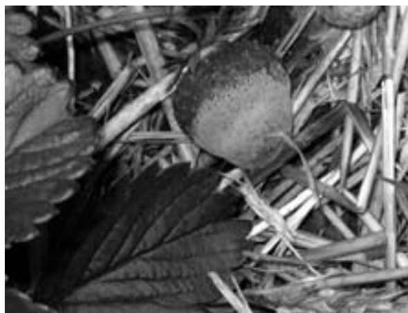
Figuur 2. Vruchtrot-aardbei.

In 2002 is begonnen met toepassing van U. atrum op basis van een BOS te vergelijken met kalenderbespuitingen van de antagonist. Toepassing van U. atrum leidde tot significant minder vruchtrot dan in de onbehandelde controle. Echter de resultaten waren onvoldoende in vergelijking met chemische bestrijding (Tabel 1). In deze proef gaven kalender bespuitingen met U. atrum betere resultaten dan bespuitingen op basis van BOS. Vanaf 2003 is de vergelijking doorgevoerd met bespuitingen met fungiciden op basis van een BOS. Gebruik van een BOS gaf betere resultaten dan bespuiting op routine. Kalenderbespuiting met U. atrum gaven in 2003 geen significante bestrijding van vruchtrot in vergelijking met de onbehandelde controle. Werd U. atrum op basis van een BOS gespoten dan leidde dat wel tot een betere bestrijding dan in de onbehandelde controle. Omdat U. atrum toch wat achterbleef bij de chemische bestrijding is vanaf 2004 gekeken naar strategieën waarbij zowel biologisch als chemisch kon worden ingegrepen. De keuze voor de behandeling was gebaseerd op de infectiekans. Hieruit bleek dat een combinatie van toepassing van U. atrum bij een matige infectiekans en een fungicide bij een hoge infectiekans vruchtrot even goed bestreden kon worden dan alleen met fungiciden. Werd alleen een fungicide toegepast bij een drempel van 25% dan was de Botrytis -aantasting hoger dan in de gecombineerde strategie antagonist / fungicide.