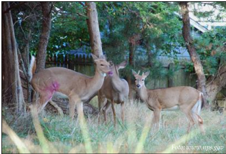
Witstaarthert dat op het achterbeen geraakt is door een vaccinatie / marker-dart.

voskoesoe (brushtail possum, Trichosurus vulpecula ) te produceren, een soort die geïntroduceerd is vanuit Australië en een plaag is in Nieuw-Zeeland 8 . Het blijkt dat het plantenmateriaal de zona pellucida-eiwitten op een of andere manier beschermt tegen vertering. Gemodificeerd voedsel is niet zelfverspreidend zoals virussen of parasieten, waardoor de toediening meer werk kost maar wel beter gestuurd kan worden en dus veiliger is. Ook bij het neerleggen van voedsel is het echter moeilijk te controleren welke dieren ervan eten.