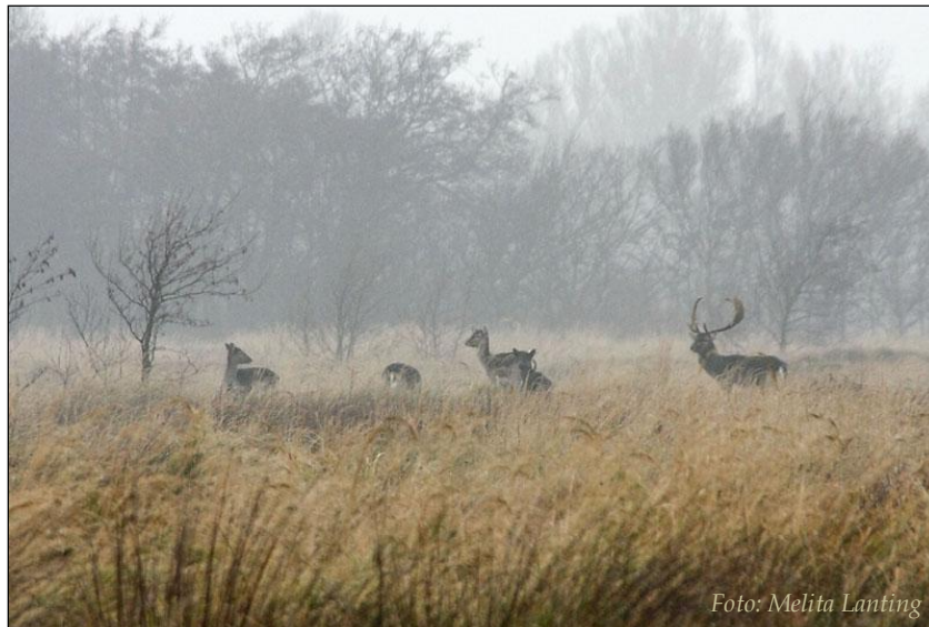
Damherten op Schouwen-Duiveland.

beschreven 11,12,23,65 , betwijfelen anderen of contraceptie wel effectief genoeg kan zijn om tegen redelijke kosten het gewenste effect te bereiken 35,100 . En hoewel contraceptie door het publiek en dierenrechtenorganisaties over het algemeen beschouwd wordt als een 'humane' methode vergeleken met de jacht 72 , is het de vraag hoe realistisch die visie is wanneer de bijwerkingen van contraceptiemiddelen op gezondheid, sociale interacties en gedrag bekeken worden. In dit rapport wordt een overzicht gegeven van de middelen die op het moment beschikbaar zijn voor contraceptie van hoefdieren, met aandacht voor effectiviteit, veiligheid en bijwerkingen. Enkele toepassingen van contraceptie in de praktijk worden ook besproken. Hiermee zal een beeld worden geschetst van de mogelijkheden en beperkingen van contraceptie voor het beheer van hoefdierpopulaties in Nederland.