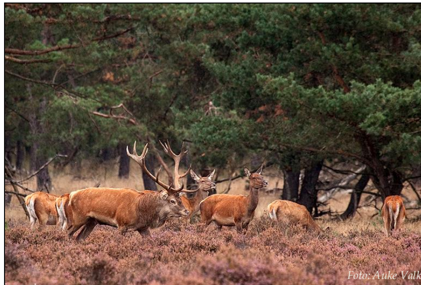
Edelherten op de Veluwe.

Een nadeel van leuprolide is de relatief hoge kostprijs. Eén behandeling kost $150-200 per dier, dat is 6 tot 8 keer zoveel als bijvoorbeeld PZP (zie 5.2), maar kan wellicht iets omlaag gebracht worden als er lagere doses gebruikt worden. Een ander nadeel kan zijn dat GnRH-agonisten soms eerst een sterk stimulerend effect hebben op de hormoonconcentratie van LH (de 'acute fase') die enkele dagen tot weken kan duren en spontane oestrus kan veroorzaken, voordat de hormoonconcentraties onderdrukt worden 43 . Echter in de studie aan edelherten duurde de piek in het niveau van LH slechts enkele uren. Na 16 uur was LH terugggevallen tot minimale concentraties, zonder oestrus te veroorzaken 4 . Dit geeft de suggestie dat het optreden van een acute fase in de praktijk geen beletsel hoeft te vormen voor het gebruik van leuprolide.