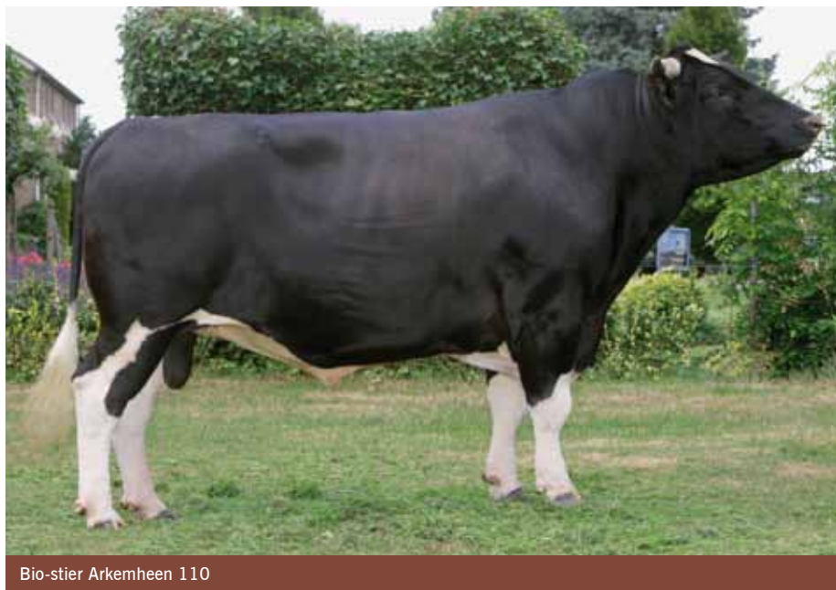
Bio-stier Arkemheen 110

In Nederland wordt gestaag gebouwd aan het opzetten van een volwaardige biologische melkveefokkerij. Vorig jaar zijn daarvoor weer stappen gezet met onderzoek, simulaties van een fokprogramma en de inzet van de eerste BioKI stier Opneij Wytze P. De kennis en ervaringen van de Praktijknetwerken Bio-KI en Fundamentfokkerij Fries Hollands Vee en het onderzoek van het Louis Bolk Instituut en Livestock Research van Wageningen UR zijn samengebracht in dit BioKennisbericht.