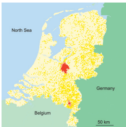
Figuur 2. Risicokaart voor vogelgriepverspreiding [15]. In de gebieden in het rose en rood is de hoge pluimveedichtheid een hoog risico voor verspreiding tussen bedrijven.

Varkenspest heeft grote schade veroorzaakt in het recente verleden, zowel in Nederland als in Duitsland en België. In deze landen bleek dat voor varkensdichte gebieden (meer dan drie á vier bedrijven per vierkante km) de EU-basisbestrijding, alleen ruimen van het besmette bedrijf en stoppen van diertransport, onvoldoende werkte. Uiteindelijk, nadat alle bedrijven binnen het varkensdichte gebied besmet zijn geraakt, zal de ziekte wel verdwijnen. Maar dat