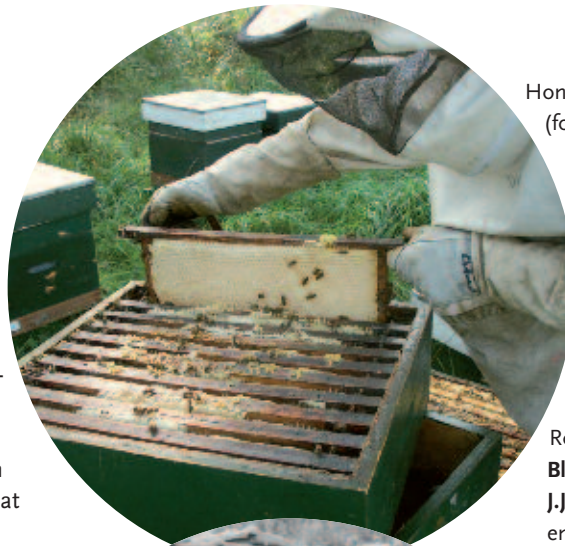
Honinggoest Biesbosch.

Anonymus, 2008. Monitoring-Projekt "Völkerluste": Untersuchungsjahre 2004-2008: