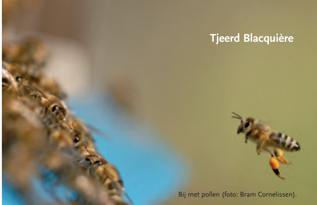
Bij met pollen.

De afgelopen jaren waren er vaak berichten in de pers over de dramatische sterfte of verdwijning van bijenvolken (Benjamin & McCallum, 2009), zowel in Nederland als elders in Europa en ook in de Verenigde Staten. Dit artikel gaat in op de achteruitgang en problemen van de honingbij, tipt ook de andere bestuivende insecten aan en geeft een overzicht van de belangrijkste oorzaken van bijensterfte en achteruitgang van bestuivers.