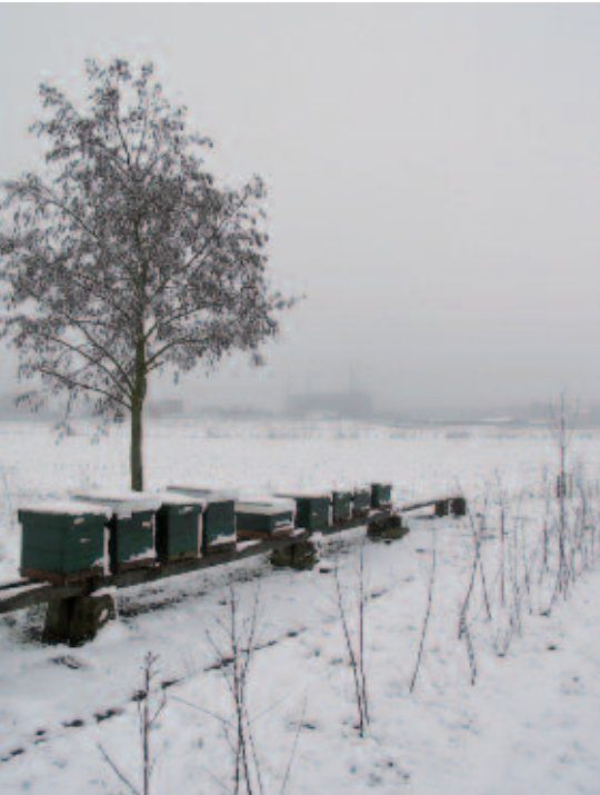
Bijenkasten in de sneeuw.

mijt en andere bijenziekten en maakt de verminderde dracht (bloeiende flora) het imkeren ook veel lastiger. Afgaan op het advies van imkers met vele jaren ervaring werkt vaak ook niet, omdat methoden van een paar jaar terug inmiddels niet meer worden van de Varroamijt tegen de gebruikte bestrijdingsmiddelen. Eigenlijk zou professionalisering van de hobbyimkerij via extra onderzoek, scholing en voorlichting op gang gebracht moeten worden. Het Ministerie van LNV heeft als reactie hierop extra monitoring van bijensterfte en bijenziekten en stimuleringsmaatregelen voor drachtverbetering afgekondigd.