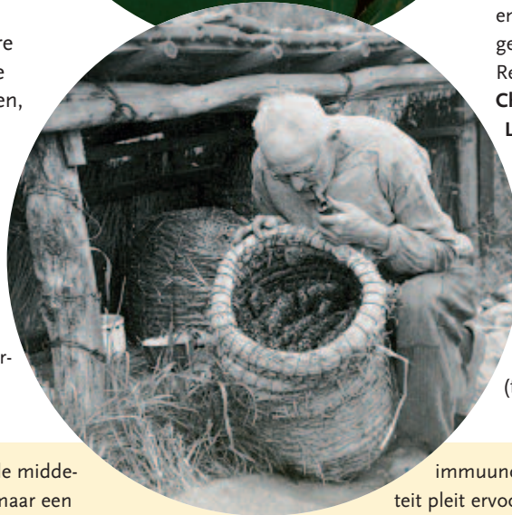
Het imkervak veroudert.