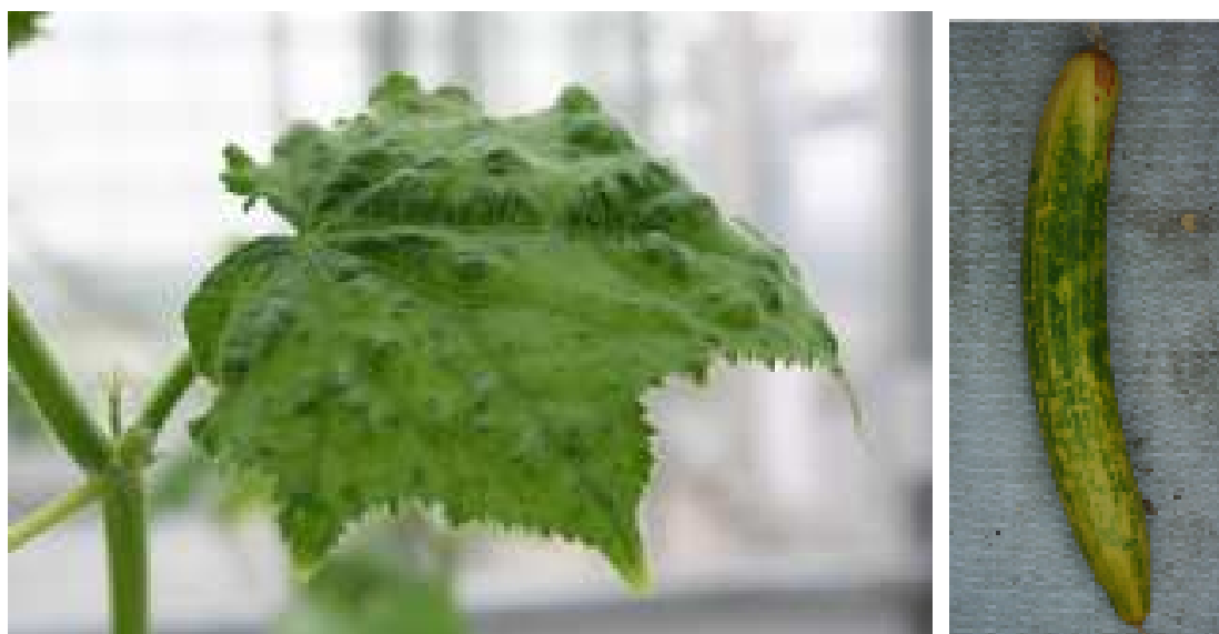
Figuur 1. Het grootste probleem rondom komkommerbontvirus zijn niet zozeer de virussymptomen (links), maar het feit dat het virus productie kost. Als de vruchten blijven hangen tot voorbij het normale oogstmoment, kunnen er wel virussymptomen ontstaan (rechts).

In de teelt van komkommer kunnen een aantal virussen voor problemen zorgen, waarbij komkommerbontvirus de belangrijkste is. In 2009 kampte de komkommerteelt met grote problemen door besmetting met komkommerbontvirus (Fig. 1). Dit virus is mechanisch overdraagbaar en door een gebrek aan bestrijdingsmaatregelen vormt dit virus een toenemend probleem waartegen alleen hygiënemaatregelen afdoende zijn. Overdracht vindt plaats bij gewashandelingen als snoeien en oogsten. Ook via besmet materiaal zoals mesjes, scharen, kleding, sieraden en fust is verspreiding mogelijk.