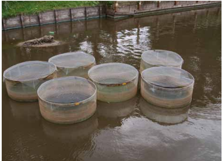
Proeflocatie Heesch met enclosures, september 2009.

Het project ontving subsidie van het Innovatieprogramma Kaderrichtlijn Water van het ministerie van Verkeer en Waterstaat en de Provincie Noord-Brabant.