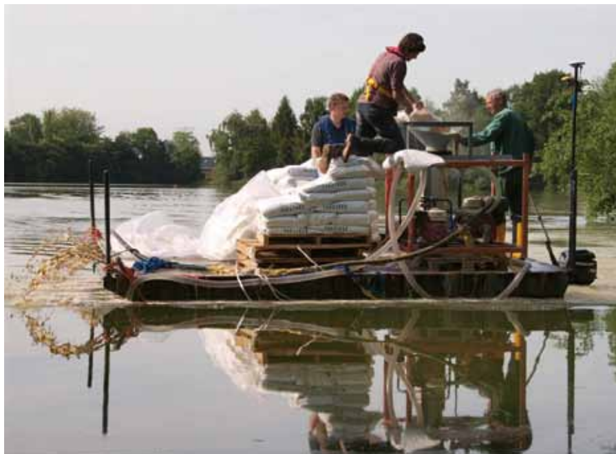
Oppervlakkige toediening van Phoslock in De Kuil, mei 2009.

blijft deze binding behouden bij een van neutraal afwijkende zuurgraad en onder zuurstofloze omstandigheden. Beide omstandigheden doen zich van nature voor bij het sediment van oppervlaktewateren, waardoor defosfateren met aluminium- of ijzerzouten vaak geen afdoende maatregel is. Tot nu toe is in Europa ongeveer tien maal Phoslock toegepast, waarbij na toediening het fosfaatgehalte in de waterfase steeds sterk daalde. Deze daling blijft meerdere jaren behouden 11) .