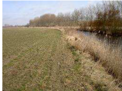
Foto 14 en foto 15: Schade door ganzen in graszaad 15 maart 2010.

Op 12 april was er weinig extra schade opgetreden. De lengte van het onbeschadigde deel was 16 cm en van het beschadigde deel 12 cm. Ook de gewasbedekking en het aantal pollen varieerde zoals tabel 4 weergeeft. De lengte is op 20 mei gemiddeld 28,8 cm op het beschadigde deel. Het onbeschadigde deel staat ongeveer 20 cm hoger.