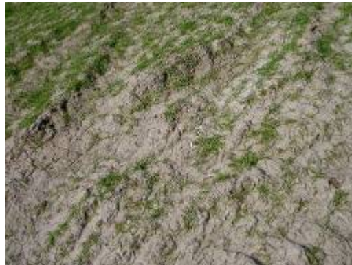
Foto 4: ganzen op perceel, 12 april 2010 Foto 5: vertrapping perceel door ganzen, 12-04-2010