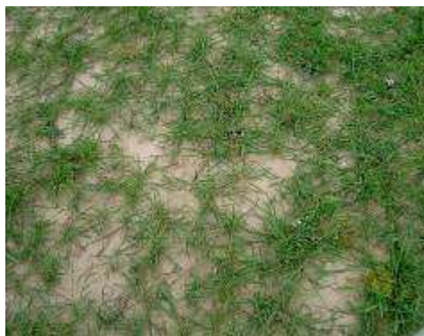
Foto 8 en 9: Nog steeds duidelijke schade aanwezig veroorzaakt door ganzen, 20 mei 2010

Op 3 augustus zijn er proefveldjes geoogst. De resultaten zijn vermeld in tabel 2. Een plek van 300 meter is helemaal niet oogstbaar. De rest is naar schatting 50% slechter.