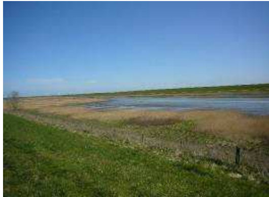
Foto 25. Gezicht op schade in perceel JKP1 Foto 26. Verblijfplaats van de schadeveroorzakers