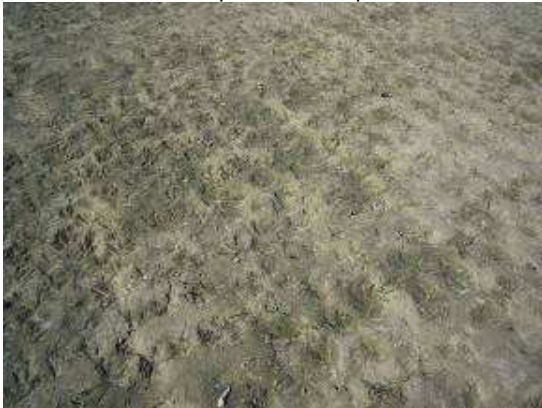
Foto 27. Verslechte plek, door wateroverlast of door ganzen platgetreden grond of door een combinatie daarvan.