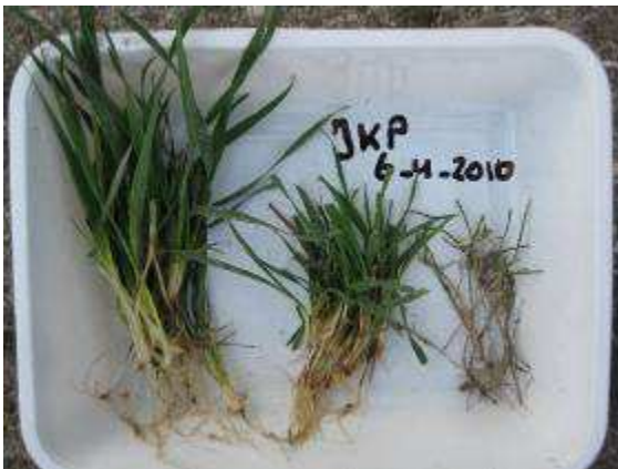
Foto 28. Verschil in beworteling en gewasontwikkeling op een goede plek, een matige en slechte plek.