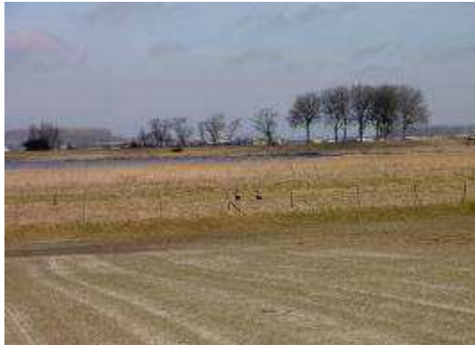
Figuur 3: Ganzen op het perceel, 15 maart 2010

Op 15 maart is de lengte van de tarwe ongeveer 2 cm op het goede stuk. Op een stuk van ongeveer 400 m 2 staat helemaal niets. Als ganzensoorten zijn de grauwe gans en de brandgans te zien. De ganzen komen vooral 's nachts. Ze komen vooral op eiwitrijk voedsel af.