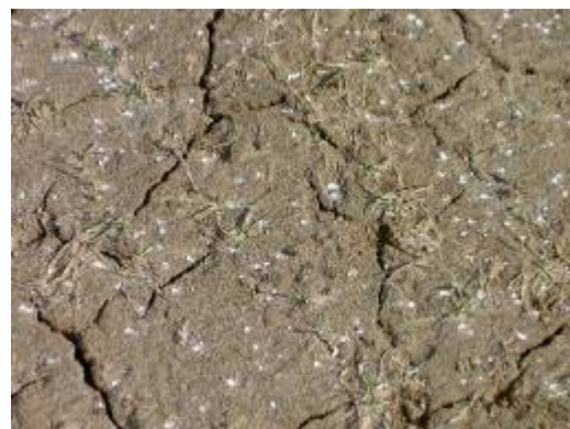
Figuur 1 en 2: Vertrapping door ganzen, 15 maart 2010