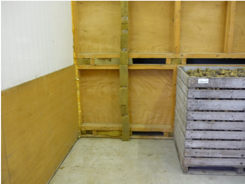
Figuur 3. Dichtmaken gaten in de drukwand voor het zuigen. De kist moet nog 10 cm om zodat de lucht vanuit de ruimte tussen de 2 rijen kisten weggezogen kan worden naar de 4 gaten in de drukwand. De kisten stonden niet strak tegen de drukwand. De schuimbanden voorkomen dat valse lucht wordt aangezogen.