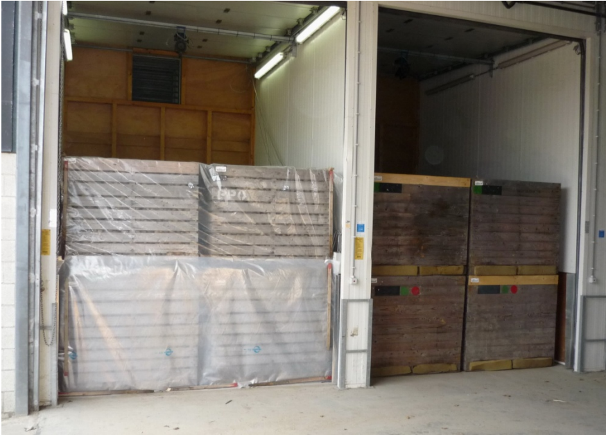
Figuur 6: In de cel links werd gezogen en in de cel rechts geblazen. Bij zuigen waren de voorzijde en bovenzijde zodanig dichtgemaakt dat de lucht alleen vanaf de beide buitenzijden kon toetreden. Boven in de cellen aan de ijzeren stangen hangen de Diabolo SL-vernevelaars.