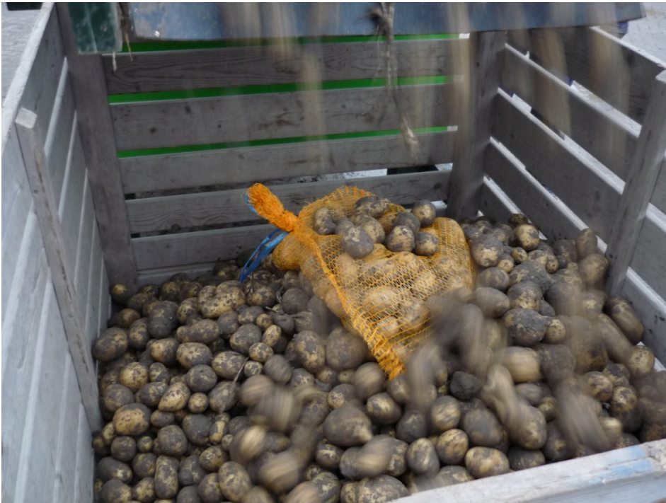
Figuur 2. Het inbrengen van een monster van 50 knollen in een kist waardoor gezogen wordt

Op alle data (= alle gemiddelde zilverschurftaantastingen per monster), is een variantieanalyse uitgevoerd. Van deze analyses is de kansberekening volgens de F-toets weergegeven; zie Bijlage 1. Onderscheid tussen de gemiddelden is weergegeven volgens de LSD-toets. Deze is gebaseerd op de t-verdeling met een waarschijnlijkheid van 5% Alle analyses zijn uitgevoerd met behulp van Genstat 13 (VSN International, 2010).