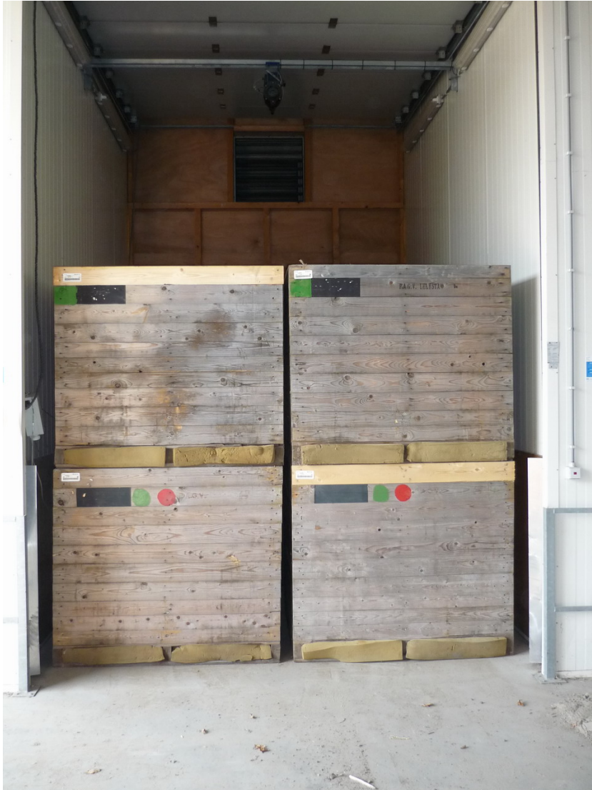
Figuur 5: Dichte kisten waarbij de lucht via de sleuven in de drukwand door de kisten wordt geblazen en vervolgens bovenlangs weer via het zichtbare gat naar de horizontaal geplaatste ventilator boven de drukkamer wordt gezogen. De onderkant van de kisten is dicht, de laag 12 cm erboven bestaat uit latten van 12 cm breed met 2 cm kieren tussen de latten.