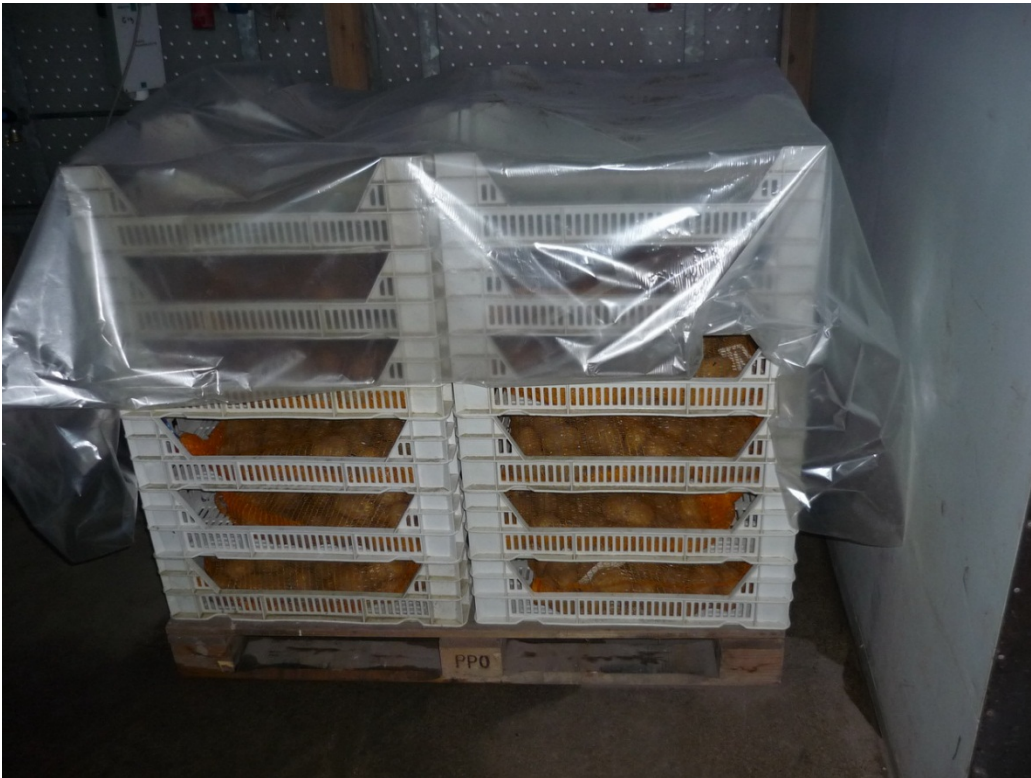
Figuur 7: De monsters van 50 knollen in wijdmazige zakjes zijn na behandeling in de vochtige cel bij 12°C in poterbakjes gelegd.