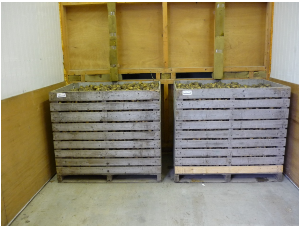
Figuur 4: 2 van de 4 kisten opgesteld voor de zuigwand