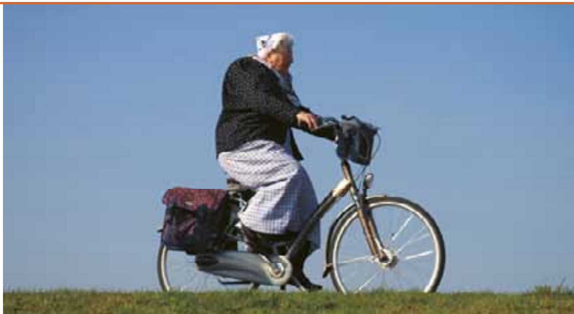
Het is van belang om helder te formuleren voor wie de betalingsverplichting geldt, om twijfelgevallen van gebruikers met andere fietstypen of recreatieve doeleinden te voorkomen.

een dagkaartensysteem waarschijnlijk zodanig hoog dat het Nationaal Park daarmee voor aanzienlijke meerkosten komt te staan.