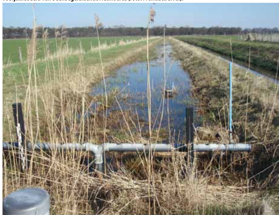
Voorjaarsbeeld van beekbegeleidende rietmoeras.

voornamelijk uit het watersysteem door denitrificatie (anaeroob), terwijl fosfor niet omgezet wordt maar zich onder aerobe omstandigheden aan deeltjes hecht, naar de bodem zinkt en niet uit het watersysteem verdwijnt. Voor beide stoffen is voor de