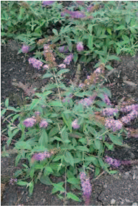
38. B. 'Blue Chip'