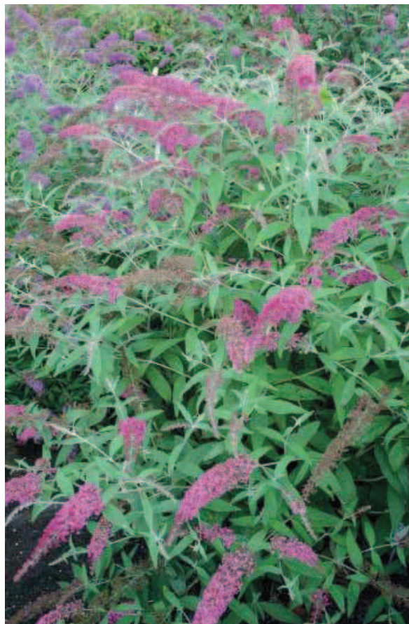
30. B. davidii 'Pink Spread'