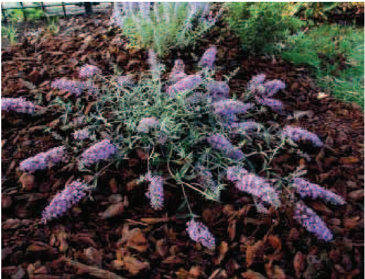
40. B. 'Podaras 12' (FREE PETITE LAVENDER FLOW)