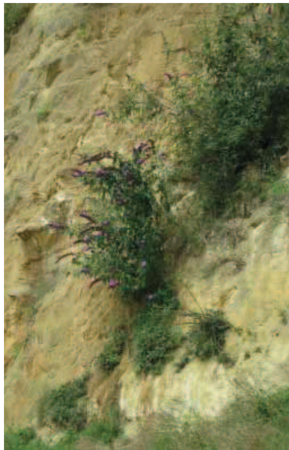
13. B. davidii verwildert gemakkelijk; zoals in deze Limburgse mergelgroeve.

Zeer veel soorten uit het geslacht Buddleja komen voor in de (sub)tropen. Buddleja davidii en veel hybriden daarmee zijn echter voor