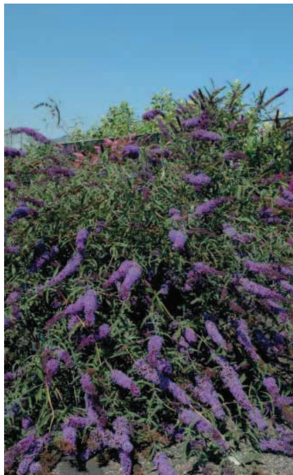
25. B. davidii 'Nanho Blue'

Bloemkleur lijkt op B. davidii 'Empire Blue'. De bladkleur contrasteert mooi met de bloemkleur. De Engelse AGM is in 2010 ingetrokken. Krijgt in Nederland een ster vanwege de breed