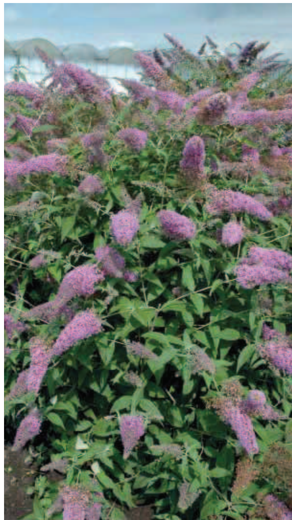
36. B. 'Silver Lilac'

Ontstaan uit een kruising van B. ×weyeriana 'Honeycomb' met een B. davidii . Hij was eerst 'Bicolor' genoemd, maar die naam is Latijn, en mag niet aan een modern ras gegeven worden. Heeft relatief breed blad. De bloemkleur is roze met een gele ondertoon, en verkleurt naar licht oranjegeel bij verbloeien. De kleur verloopt binnen één bloemtros, afhankelijk van het bloei stadium van de individuele bloemetjes. De plant kreeg een 0 in de keuring vanwege de grove habitus, en de eigenaardige bloemkleur, die lang niet iedereen waardeert.