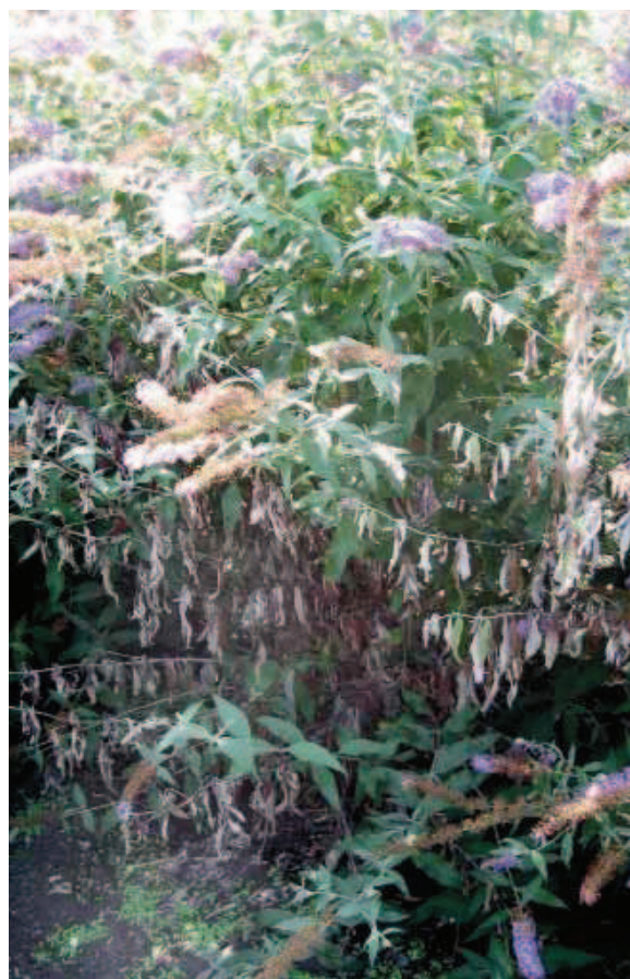
14. Verwelkingsziekte kan soms voorkomen.