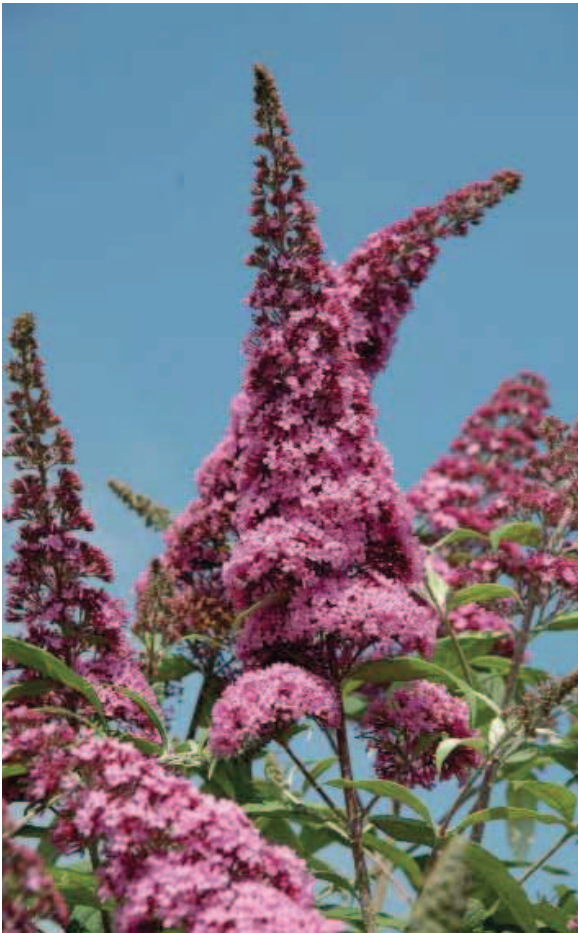
28. B. davidii 'Pink Delight'

BLAD: lichtgroen, later donkergroen, smal elliptisch, tot 23 cm lang, top toegespitst.