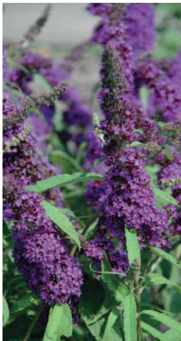
31. B. davidii 'Pyrkeep' (PURPLE EMPEROR)

BLAD: donkergroen, tot 24 bij 9,5 cm, oppervlak