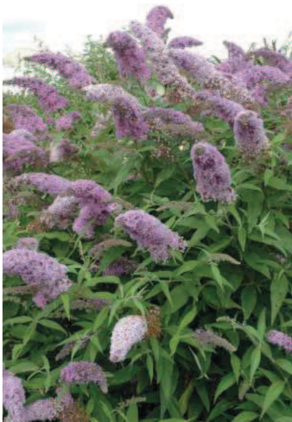
33. B. davidii 'Sunkissed'

BLOEM: wit, hart geel, 9 mm lang bij 6 mm breed; bloeit vanaf half juli, 7 weken met nabloei.