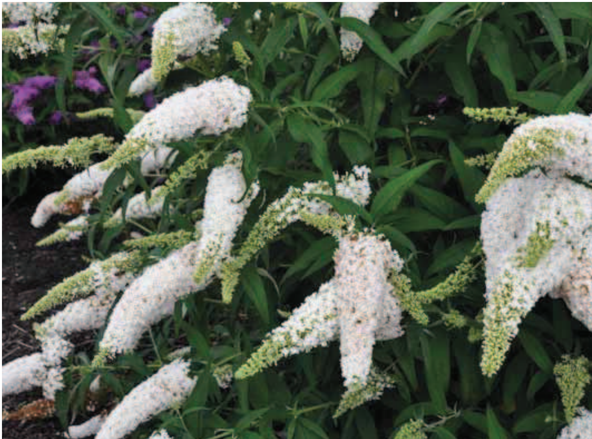
21. B. davidii 'Dart's Ornamental White'

overhangend, tak groen. Zeer rijk bloeiend met goed gevormde witte pluimen. Maakt opvallend veel vruchtjes. Volgens de keurmeesters de beste witbloeiende Buddleja.