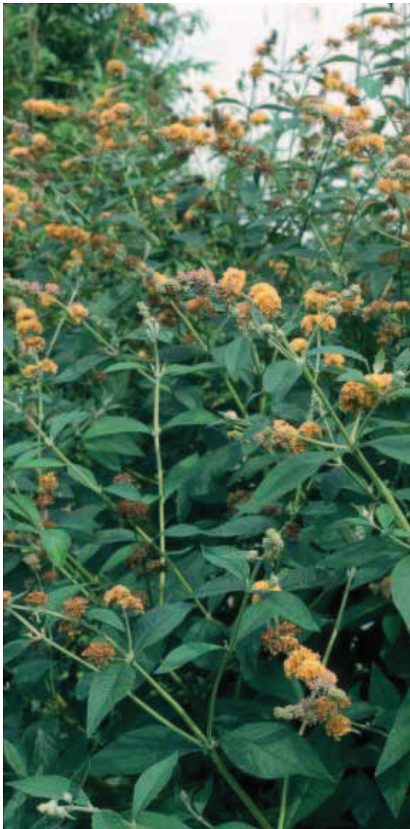
42. B. ×weyeriana 'Sungold'.

1966. Zie ook de informatie bij B. ×weyeriana 'Honeycomb'.