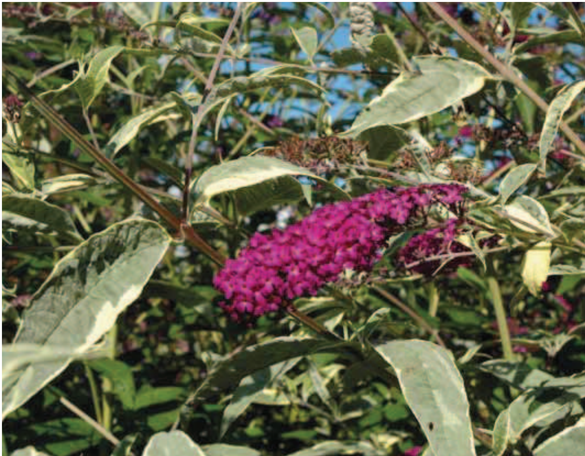
39. B. davidii 'Harlequin'