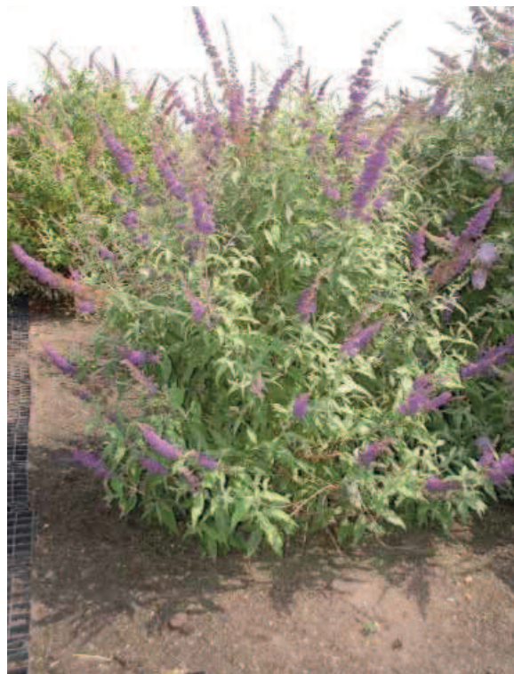
17. B. davidii 'Blue Horizon'

BLAD: donkergroen, 19 bij 6 cm, oppervlak glan-