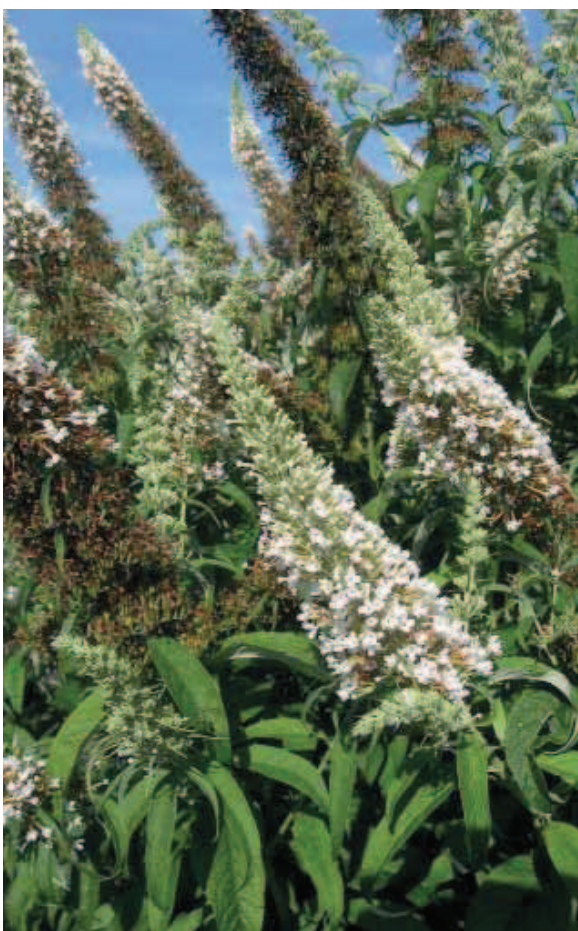
24. B. davidii 'Markeep' (MARBLED WHITE)

De merknaam suggereert dat de plant wit gemarmerd blad heeft, maar dat is niet zo; het is de Engelse naam voor vlinder Dambordje. Dit is het witbloeiende ras uit de English Butterfly series. De keuringscommissie is vooral te spreken over de mooie compacte groei van deze plant in pot of als jonge plant, en de rechtop groeiende grote bloemtrossen. Als grote plant vindt men hem minder dan B. davidii 'White Wings', en ook de gevoeligheid voor vorst en takbreuk beperken de score tot 1 ster.