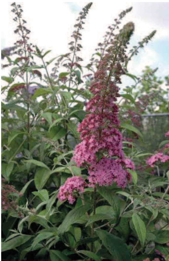
29. B. davidii 'Pink Perfection'