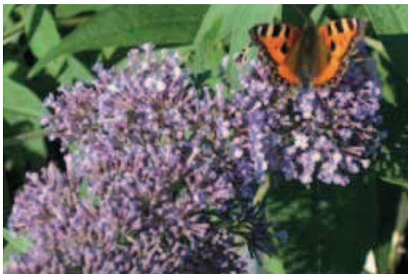
35. B. 'Ellen's Blue'

BLAD: grijsgroen, smal lancetvormig, tot 19 bij 7 cm, oppervlak dof, onderzijde zwaar behaard.