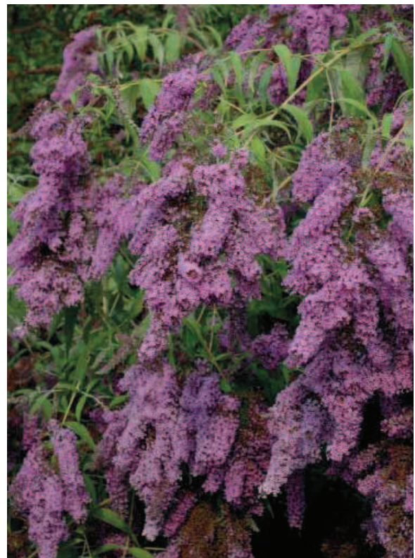
20. B. davidii 'Dartmoor'

BLOEIWIJZE: vertakt, 24 bij 15 cm, maar soms