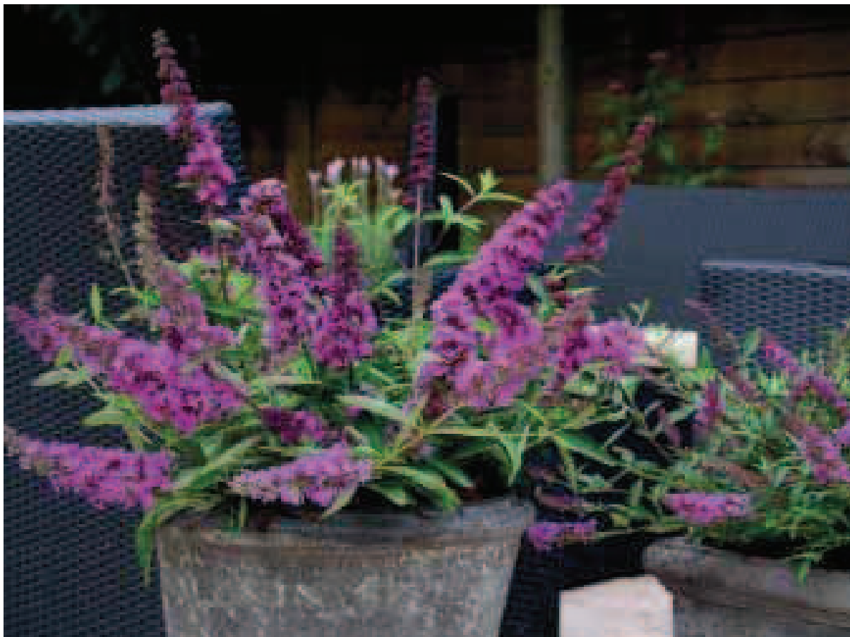
41. B. 'Podaras 13' (FREE PETITE TUTTI FRUITI)