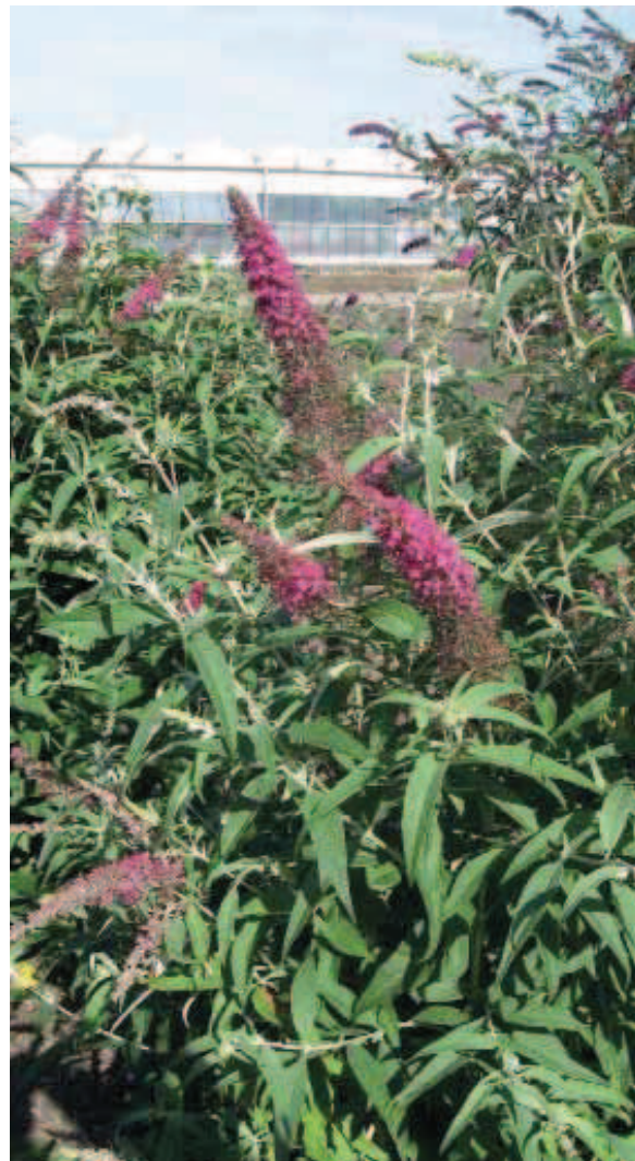
32. B. davidii 'Summer Beauty'

Stevig en met een goede compacte plantvorm, opgaand, grijsgroene twijgen, oudere planten vallen wat open. De bloemkleur is bijzonder omdat hij naar het rood neigt, hoewel er inmiddels nieuwe, nog iets rodere op de markt komen zoals 'Miss Ruby' en 'Lonplum'.