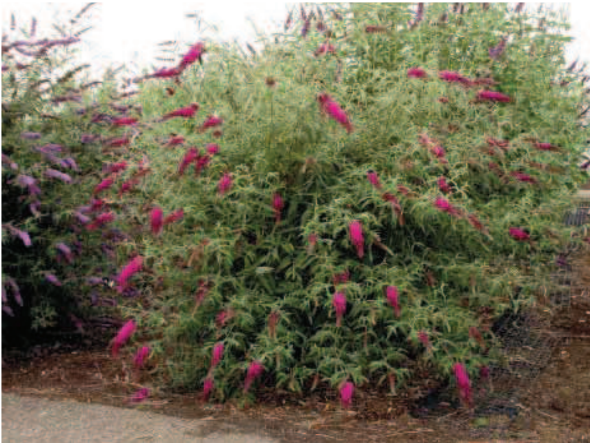
26. B. davidii 'Nanho Purple'

BLOEM: lilaroze (RHS 84A - 85A), oranjegeel hart met geelwit ringetje, 10 mm lang bij 10