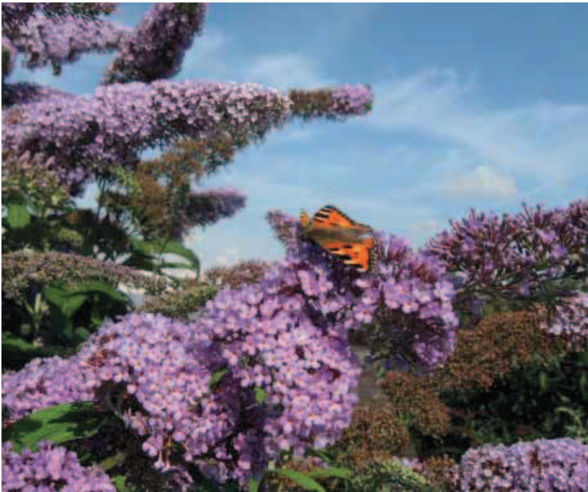
15. Cultivars met lilaroze bloemen trekken de meeste vlinders, zoals deze Kleine vos.

Zoals in het Buddleja- artikel in Dendroflora 43 is beschreven, zijn er per cultivar vlindertellin-