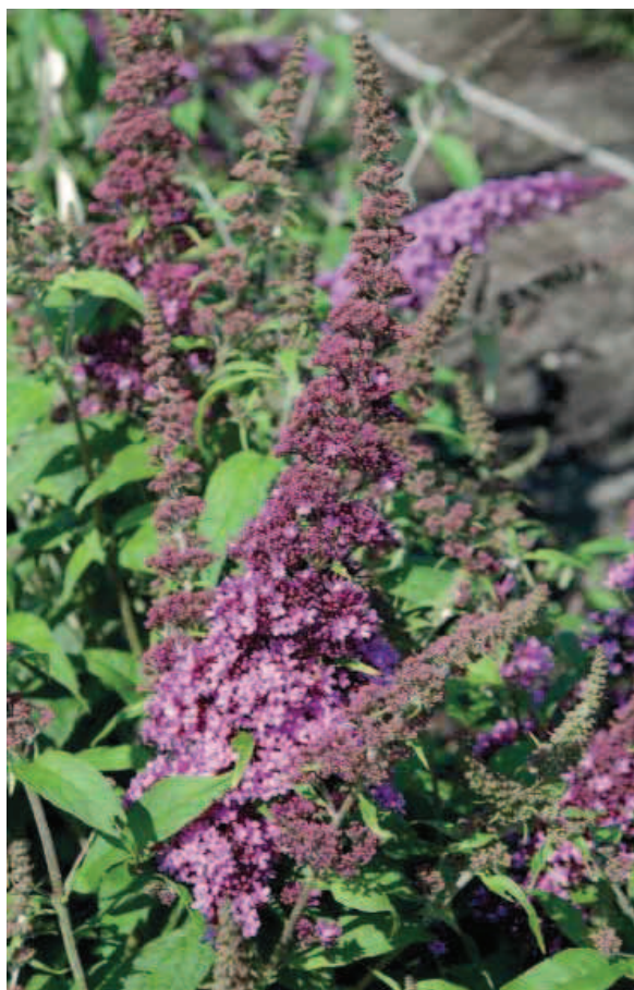
27. B. davidii 'Peakeep' (PEACOCK)

WINTERHARDHEID: USDA 6b, matig gevoelig. Na