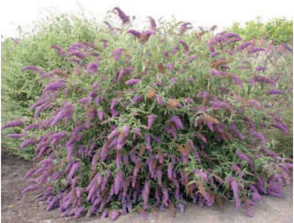
23. B. davidii 'Dart's Purple Rain'

Genoemd naar een ecologische wijk in Alphen aan den Rijn, waarvan de bewoners deze Buddleja cadeau kregen bij de oplevering. Zeer dichte struik, fijn vertakt, stengels sterk wit behaard. Het meeste blad is klein en smal, zoals bij B. davidii var. nanhoense . Een mooie habitus, maar een weinig opvallende bloemkleur; lijkt sterk op die van wilde Buddleja . De keuringscommissie vindt 'Dart's Papillon Bleu' beter.