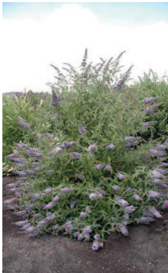
22. B. davidii 'Dart's Papillon Bleu'

In de praktijk wordt in de cultivarnaam vaak de Engelse schrijfwijze 'Blue' in plaats van het Franse 'Bleu' aangetroffen, maar het Franse woord is correct. 'Pixie Blue' bleek in alle eigenschappen identiek. Een grote, breed opgaande