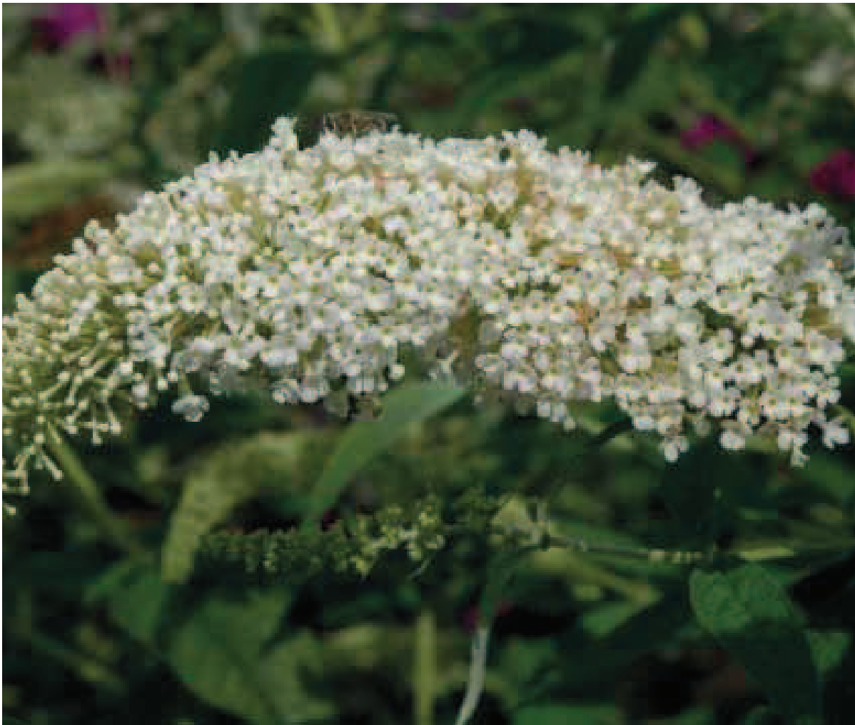
34. B. davidii 'White Wings'

rijke bloei. Volgens de keuringscommissie een van de betere witbloeiende Buddleja's, alleen B. davidii 'Dart's Ornamental White' werd hoger gewaardeerd.