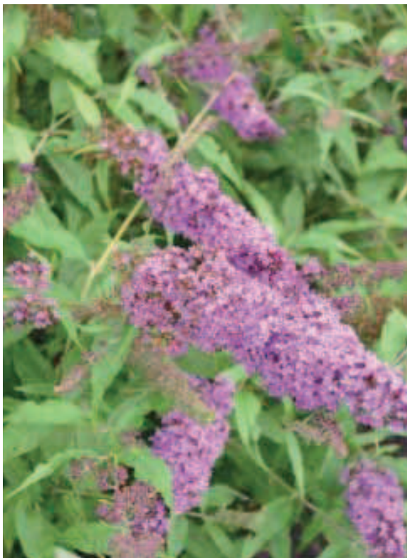
19. B. davidii 'Camkeep' (CAMBERWELL BEAUTY)

wijze, daardoor enorm groot, tot 45 cm bij 25-30 cm. Latere trossen (op zijtakken) zijn vaak niet vertakt.