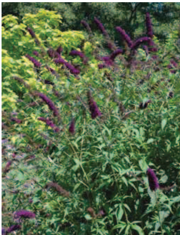
16. B. davidii 'Black Knight'

De naam 'Autumn Beauty' is de oudste volgens de RHS. Hij werd ook 'Beijing' genoemd, omdat daar het zaad vandaan komt. In het Buddleja -boek van Stuart wordt de cultivar 'Clive Farrell' genoemd naar de ontdekker van de laatbloeiende moederplant in China. De late bloeitijd is eigenaardig binnen de soort B. davidii , maar de overige plantkenmerken passen wel allemaal bij de soort; er wordt gediscussieerd of dit mogelijk een nieuwe ondersoort is. De bloemkleur is het standaard pastel paarsroze van een wilde Buddleja , en ook de enorm grote wilde habitus maakt deze cultivar niet bijzonder voor tuinen. Maar er is geen enkele vlinderstruik die zo laat bloeit als deze, en bij een mooi najaar is de plant in augustus-september echt bedekt met vlinders. Dat maakt hem heel interessant voor vlindertuinen, om te combineren met vroeger bloeiende cultivars. Voor deze toepassing krijgt de plant een S.