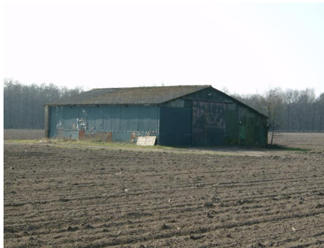
Figuur 4: Schuur in het plangebied

Wat betreft de geplande aanleg van de provinciale weg (N69) kan worden gesteld dat deze waarschijnlijk een groter effect zal hebben op de overlast van ratten dan inrichting van het waterbergingsgebied. Van een studie op Tenerife (Canarische eilanden) weten we dat wegen op zwarte ratten ( Rattus rattus ) een effect hadden: deze ratten bleken actiever om en nabij asfaltwegen dan in de omgeving [19]. Er mag worden verwacht dat ditzelfde ook geldt voor de bruine rat, Rattus norvegicus . Sowieso is het een bekend fenomeen dat op ecosysteem niveau kunstmatig gecreëerde objecten vaak dit soort problemen met zich meebrengen [20].