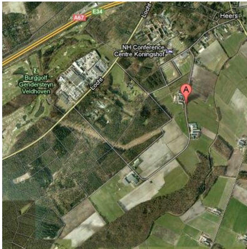
Figuur 1: de locatie Turfweg/Gagelgoorse dijk nabij Veldhoven

Hiervoor heb ik op 20 maart 2012 een bezoek gebracht aan het gebied om en nabij de Turfweg/Gagelgoorsedijk in Veldhoven (Figuur 1) in het kader van het waterberging en beekherstelproject De Run. Daarnaast heb ik een korte literatuurstudie uitgevoerd over dit onderwerp. Dit rapport is hiervan het resultaat.