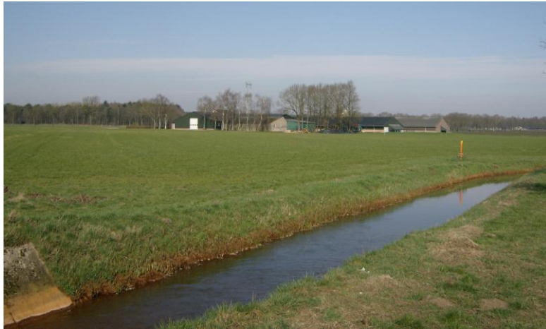
Figuur 2: in het plangebied er is sprake van een agrarisch karakter

Het studiegebied heeft een duidelijk agrarisch karakter (Figuur 2) en er is dus meer kans op het ontstaan van ratten- en muizenplagen.