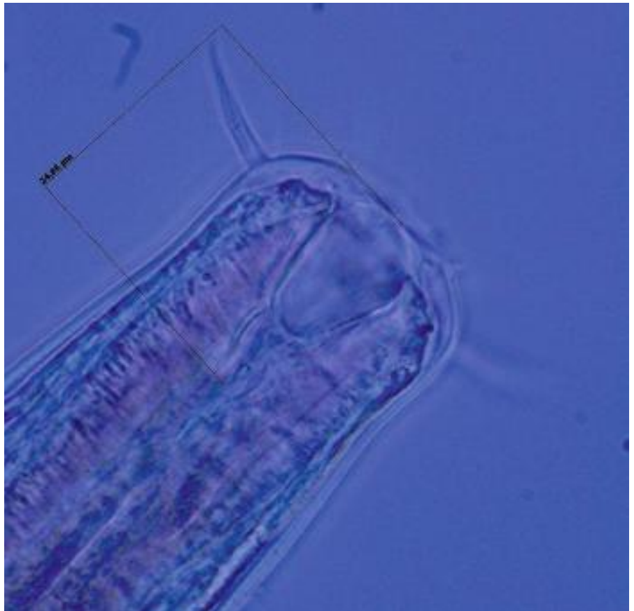
Nematode van de familie Tobriilidae.

In het najaar van 2011 hebben we een pilot-project uitgevoerd om te onderzoeken of nematoden een goede indicator voor de waterkwaliteit kunnen zijn én of DNA-barcoding een werkbare methode is voor waterbodems 3) . In het beheergebied van drie waterschappen (Veluwe, De Dommel en Velt en Vecht) en twee gemeenten (Bergen (NH) en Oisterwijk) zijn bemonsteringen uitgevoerd op locaties waarvan bekend was dat ze vervuild waren door een overstort. Ter controle zijn ook bovenstrooms monsters genomen. Voor bemonstering van de bovenste vijf centimeter van de waterbodem is een Uwitex sedimentboor gebruikt. Uit deze waterbodemmonsters zijn de nematoden geëxtraheerd. Deze nematoden zijn vervolgens zowel microscopisch als middels DNA-barcoding gedetermineerd en geteld (tot familieniveau). De microscopische analyse gaf hetzelfde beeld te zien als de DNA-barcoding. Van te voren hadden we een groep samengesteld van de meest voorkomende nematoden-