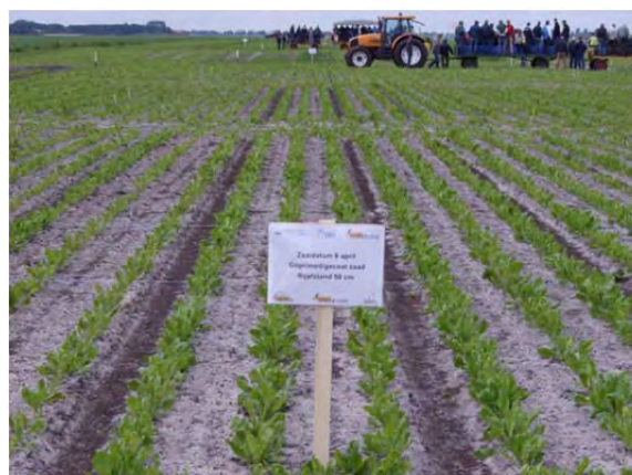
Afbeelding 3 en 4. Gewasontwikkeling op 4 juni 2009 in Valthermond, zaaitijdstip 8 april. Links: ongeprimed zaad, rechts: geprimed zaad.

Na opkomst is er in de proeven teruggedund tot op de beoogde plantaantallen van 16 of 20 planten per m 2 . Hierdoor heeft het effect van plantaantal niet door kunnen werken in de vroegheid grondbedekking en de opbrengst. Desondanks gaf geprimed zaad meestal een iets snellere grondbedekking dan ongeprimed zaad. Indien het A-en het B-geprimede zaad buiten beschouwing gelaten wordt, dan gaf geprimed zaad gemiddeld over alle jaren 1,9% meer opbrengst dan ongeprimed zaad. Uit PAGV-onderzoek uitgevoerd in