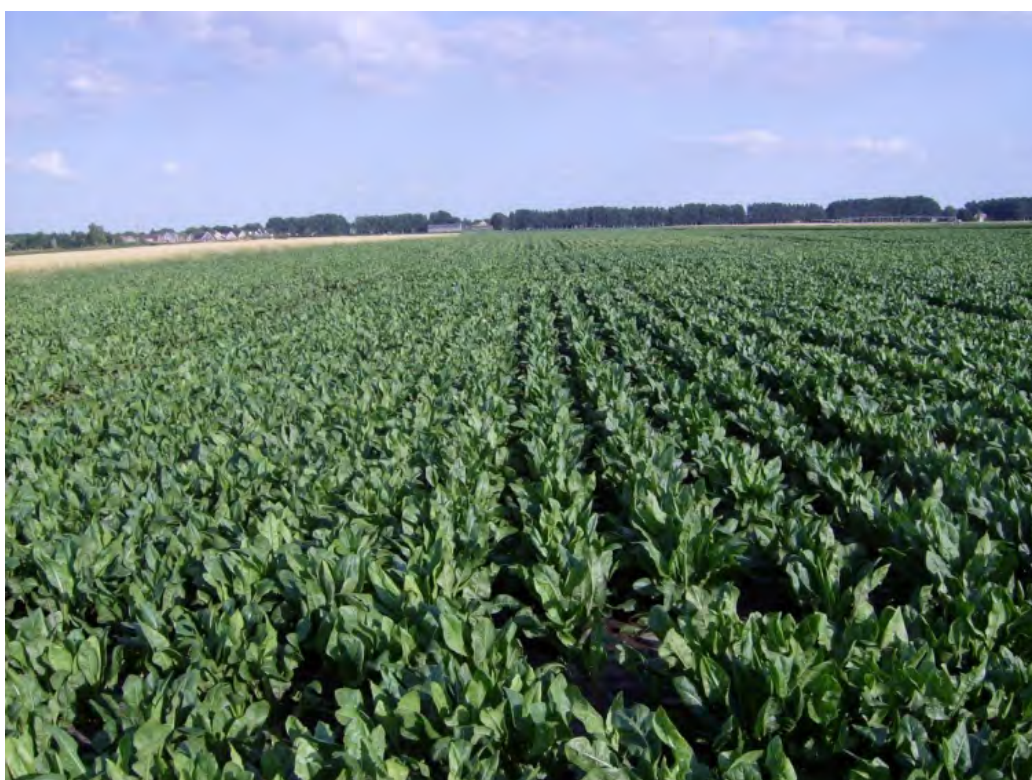
Afbeelding 5. Gewasontwikkeling Valthermond in juli 2009. Links: 37,5 cm rijafstand, rechts: 50 cm rijafstand.