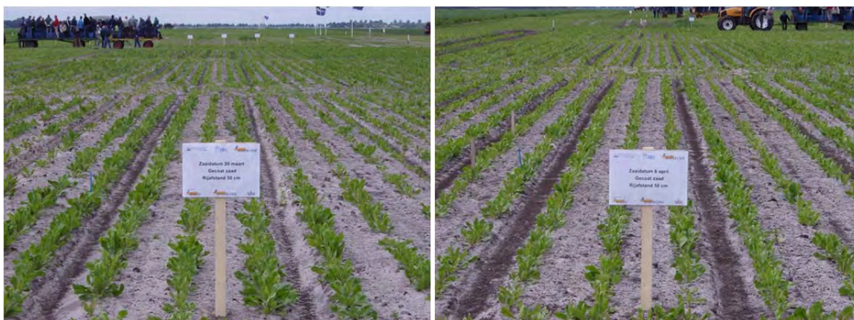
Afbeelding 1 en 2. Gewasontwikkeling op 4 juni 2009 in Valthermond. Links: zaaitijdstip 20 maart, rechts: zaaitijdstip 6 april.

In 2010, leidde vroeg zaaien, zowel in Valthermond als in Colijnsplaat tot een behoorlijke verhoging van het percentage schieters. Het voorjaar van 2010 was ook duidelijk kouder dan van 2009 en 2011 (zie figuur 1). Met name de eerste twee decades van mei waren relatief koud.