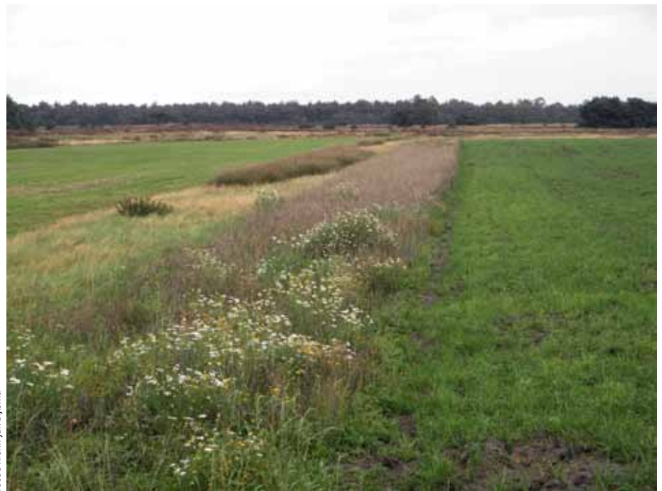
Figuur 6. Strabrechtse heide. Extensieve akkerbouw als onderdeel van het heidelandschap.

keuterontginningen en kampjes, of voormalige rijke heide die nu nog onder naaldbos ligt. In deze zone liggen de beste kansen voor gradienten met heischraal grasland en rijke droge heide. Te zwaar bemeste landbouwgrond kan door uitmijningsbeheer verschaald of lokaal ondiep geplagd worden zodat wel voldoende P achterblijft. Rijkere bodems onder naaldbos kunnen oppervlakkig verzuurd zijn. Lokaal plaggen in combinatie met bekalking levert hier de meeste winst op: het brengt het rijkere moedermateriaal aan maaiveld en maakt verzuring ongedaan. Aldus wordt ook de voedselkwaliteit voor de fauna hersteld en niet alleen ten aanzien van struikheide. In dergelijke rijkere (herstelde) systemen kunnen ook plantensoorten van heischrale graslanden met hoge bedekking voorkomen. Veel van deze soorten zijn van levensbelang voor fauna van heideterreinen (denk aan waardplantfunctie voor dagvlinders,