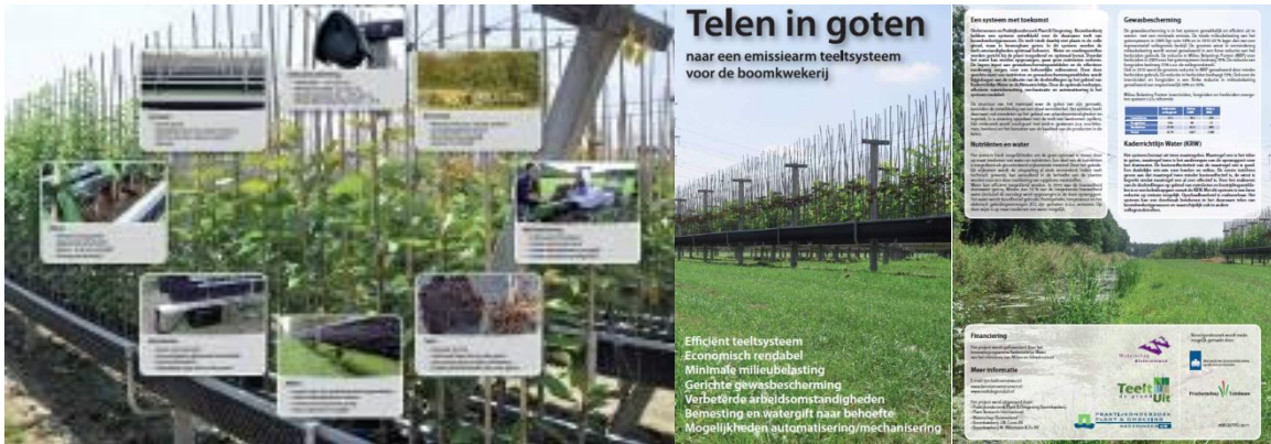
Foto 1. Overzicht van systeem en resultaten.

Foto 1 geeft een overzicht van de onderwerpen waar o.a. aan gewerkt is en een beeld van de geboekte resultaten.