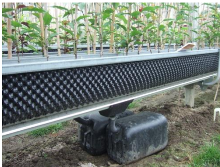
Foto 3. Ondergoot en opvang drainwater.

Vochtgehalte, temperatuur en het elektrisch geleidingsvermogen (EC) zijn gemeten m.b.v. sensoren. Op deze wijze is op maat toedienen van water mogelijk.