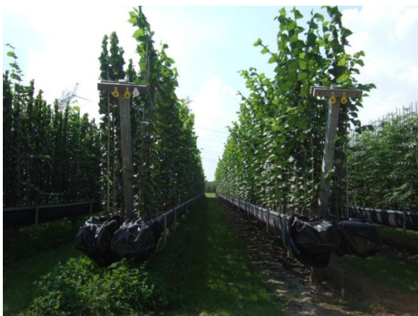
Foto 2. Groei gewas zomer 2010.

De teelt resultaten waren uitstekend (zie foto 2). De uitval aan planten werd teruggebracht naar 4 tot 8 % t.o.v. 20 tot 30% in de volle grond. Ook kon in een kortere periode 30 tot 70 % meer groei dan in de volle grond bereikt worden. Nieuwe soorten zijn getest, waardoor nieuwe markten zijn gevonden. De kwaliteit van de planten en wortelstelsel wordt als zeer goed beoordeeld en de meerwaarde van dit product wordt getest in een vervolg traject. De planten worden met kluit geoogst waardoor een snelle aanslag in de volgende teeltfase wordt bereikt. De uitval in volgende teeltfase was, ondanks de strenge winters, zeer laag.