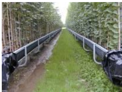
Foto 4. Een groenbemester (witte weideklaver) onder de rechtergoot gezaaid tegen onkruidgroei. Links goot met zwartstrook.

De reductie aan de inzet van gewasbeschermingsmiddelen in de teelt zal uiteindelijk leiden tot minder emissie van deze gewasbeschermingsmiddelen en dus tot lagere gehalten in het oppervlaktewater. Daarnaast worden kosten bespaard zowel op middel als arbeid.