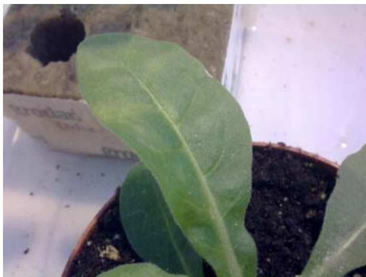
Figuur 2. Symptomen van pepinomozaïekvirus op toetsplant.

Ook in de laatste proef blijkt het wassen van de shirtjes en jassen onder alle omstandigheden effectief te zijn geweest. Op geen van de toetsplanten is nog virus vastgesteld. Alleen op de ongewassen kleding kon het virus in een toets worden vastgesteld.