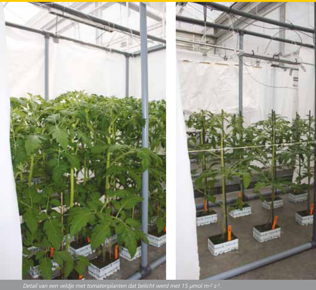
Detail van een veldje met tomatenplanten dat belicht werd met 15 \mu\text{mol m}^{-2} \text{s}^{-1} .

minderde bij de planten met 75 \mu\text{mol m}^{-2} \text{s}^{-1} rood licht ten opzichte van de controlebehandeling, en dat tegelijkertijd het glucanasegehalte in de plant toenam na besmetting met meeldauw (Figuur 1). De behandeling met 15 \mu\text{mol m}^{-2} \text{s}^{-1} leek daarentegen de infectie te bevorderen. In een bladpontosentest zijn de meeldauwsporen van de lichtbehandelingen op schone bladeren gezet. Beide behandelingen met rood licht verminderden de vitaliteit van de sporen gemiddeld met 70-80% ten opzichte van de sporen die op bladeren waren ontwikkeld zonder een extra nachtelijke lichtbehandeling. Dit lijkt erop te wijzen dat de effecten van belichting met rood licht op de schimmelontwikkeling in de loop van de tijd sterker worden en dat de tweede meeldauwgeneratie zich minder snel ontwikkelt. Samen met Philips en de leerstoelgroep Tuinbouwketen van Wageningen University zal dit onderzoek naar lichtrecepten verder opgepakt worden om toe te werken naar sturing met rood licht onder praktijkcondities.