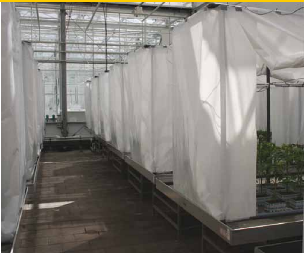
Overzicht van de kooiconstructies met bovenin de ledbelichting boven een veldje planten. Elke lichtbehandeling werd afgeschermd met plastic folie om beïnvloeding tussen de verschillende lichtbehandelingen te voorkomen. Overdag werden de luiken geopend om voldoende natuurlijk licht op te vangen en in de namiddag werden ze weer gesloten.

niet duidelijk in hoeverre uv-licht de weerstand van belangrijke gewassen in de glastuinbouw en boomkwekerijsector beïnvloedt en of deze extra energie die gestoken wordt in weerstand ten koste gaat van groei­kracht (productie).