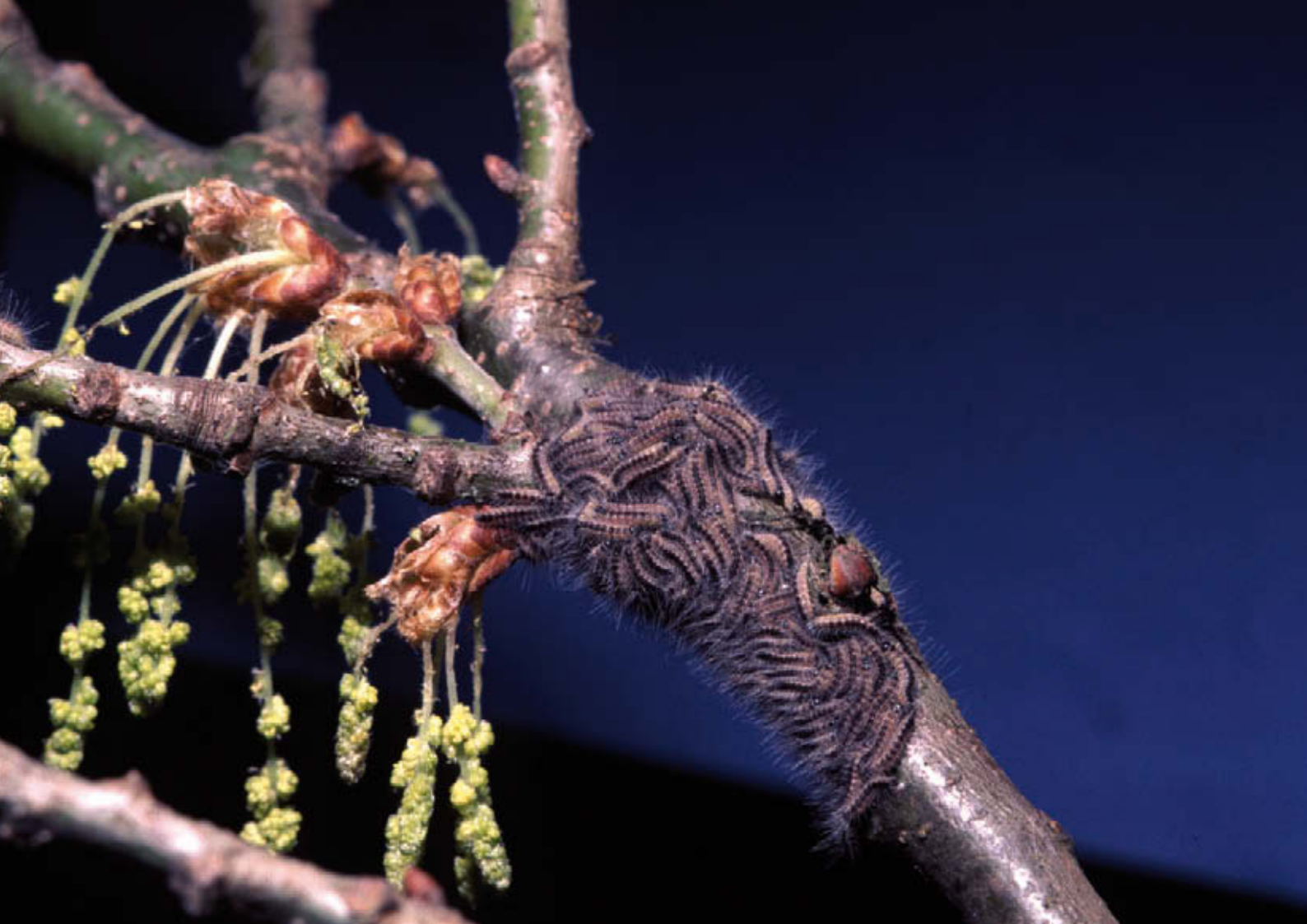
Pas uitgekomen eerste-stadium eikenprocessierups blijven dicht bij elkaar en verplaatsen zich al in processie