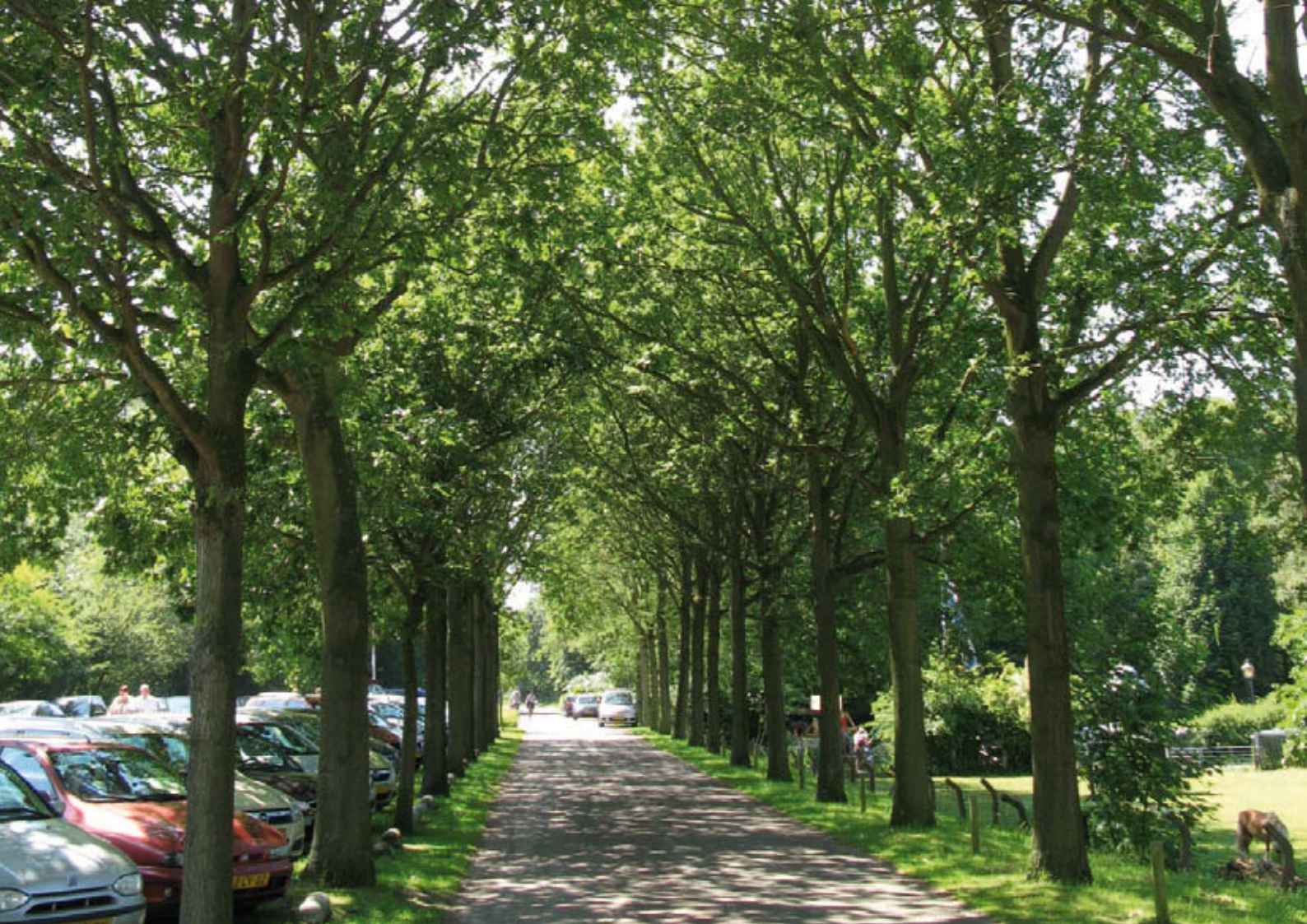
Parkeerplaats bij een natuurterrein grenzend aan een eetgelegenheid en pony weide, een risico locatie.