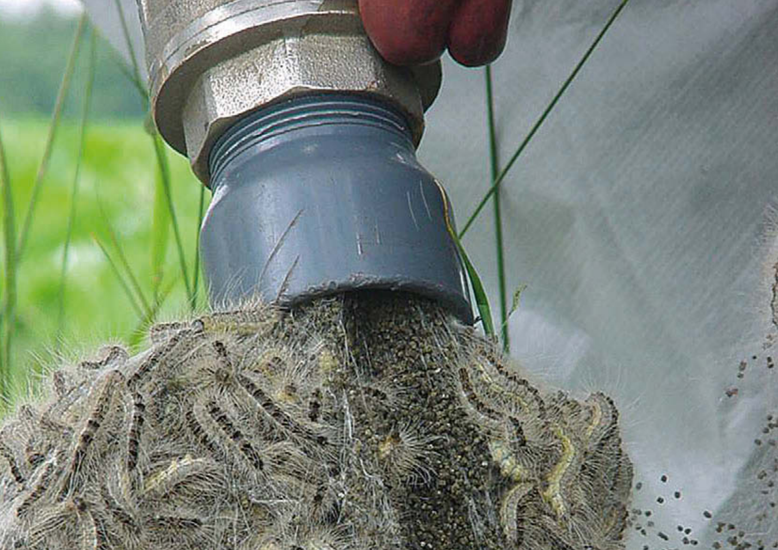
Mechanisch verwijderen van nesten en rupsen door het opzuigen in een giertank, een container of in een verassingsinstallatie