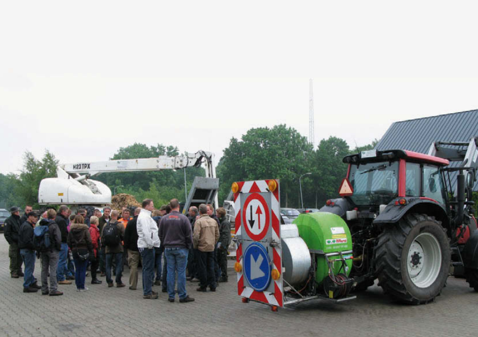
Veldwerkplaats over eikenprocessierups in Diever georganiseerd door de werkgroep Kennis voor Natuur van het Bosschap in juni 2012