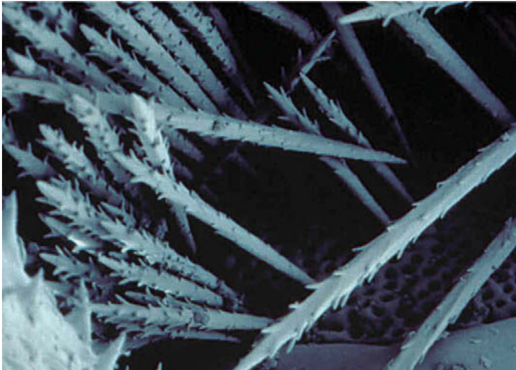
Uitvergroting van de brandharen

Op de website van het RIVM is een “toolkit” te vinden met informatie en communicatiemiddelen voor intermediairs die werken op het gebied van gezondheid en milieu. Deze is beschikbaar onder http://toolkits.loketgezondleven.nl/milieu_en_leefomgeving/?page_id=159