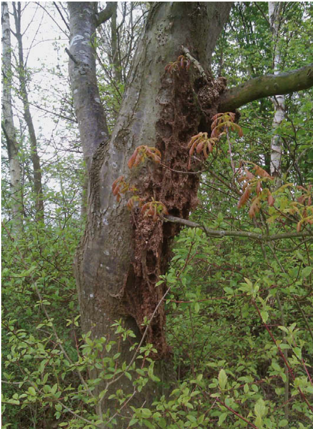
Nestrestanten van voorgaande jaren

Het is belangrijk om zoveel mogelijk nesten te verwijderen voordat vlinders uitvliegen. Op deze manier kan een toename van het aantal rupsen in het volgende jaar voorkomen worden. Het is ook zinvol om lege nesten te verwijderen, omdat deze nog altijd een risico op overlast geven, bijvoorbeeld bij onderhoudswerkzaamheden aan de bomen. Naar aanleiding van het streven naar bezuinigingen beperken sommige opdrachtgevers het weghalen van nesten tot een bepaalde hoogte en zetten dan geen hoogwerker in. Het is gebleken dat dit de overlast onvoldoende beperkt. Bovendien zorgen de vlinders uit de achterblijvende hoger hangende nesten weer voor nakomelingen in het volgende jaar.