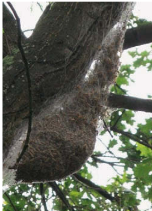
Groot nest met vervellingshuiden duidt op hoge aantallen eikenprocessierups