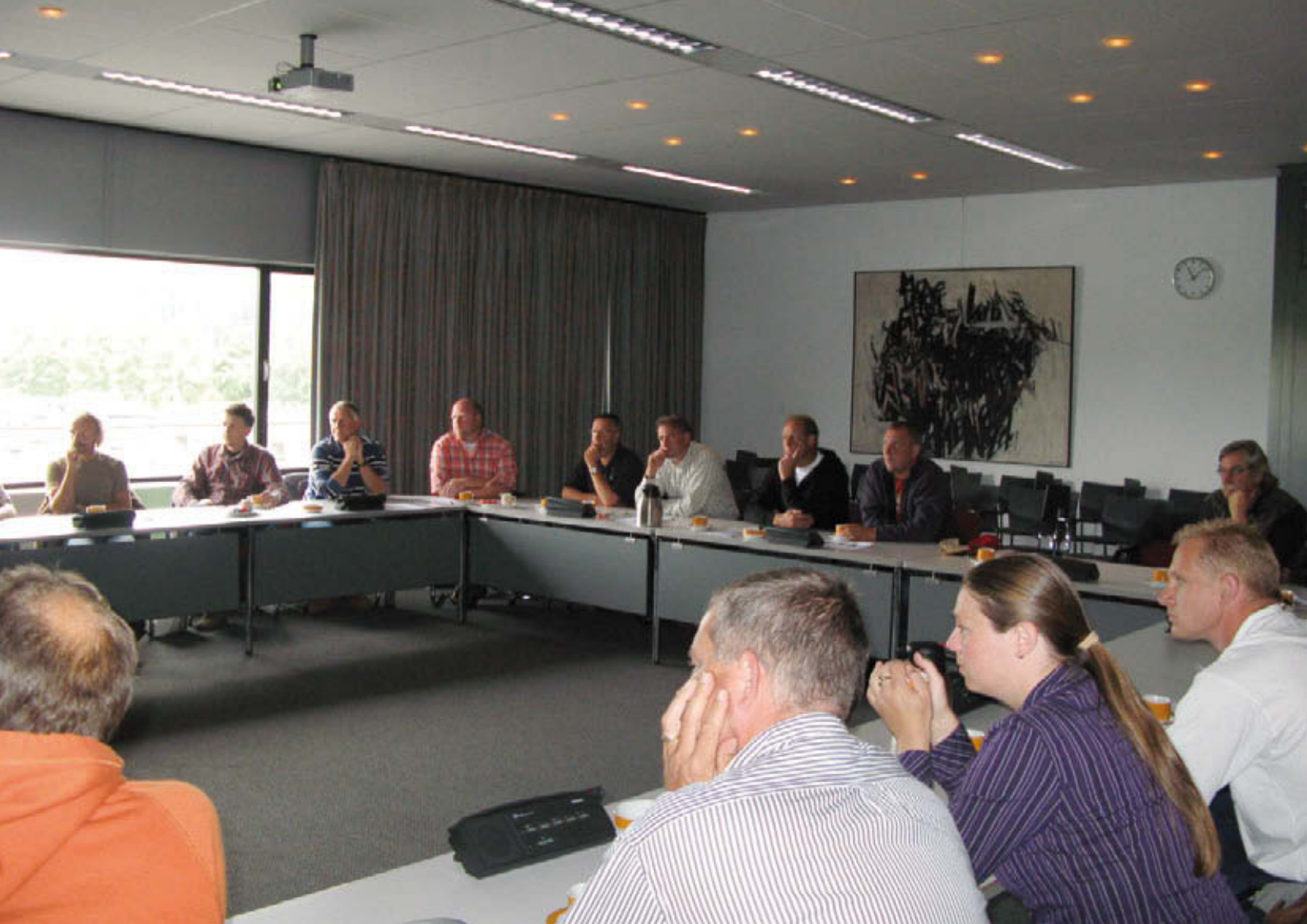
Uitwisseling van ervaring tussen gemeenten