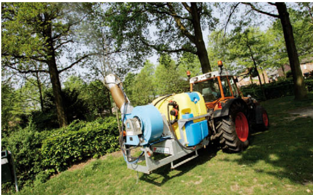
Boomnevelspuit voor het toepassen van Bt preparaten

De bespuiting kan het beste plaatsvinden bij een bladontplooiing vanaf 50% tot een bladontplooiing van 70%. De rupsen moeten via vraat het bespoten blad binnenkrijgen om gedood te worden. Bespuiting van de rupsen zelf heeft geen doding tot gevolg. De bestrijding kan het beste worden uitgevoerd door een luchtondersteunde nevelbespuiting met een bacteriepreparaat (Tabel 4). Hierdoor vormen zich kleine druppeltjes die gelijkmatig over het blad verdeeld worden. Het is van belang niet alleen de buitenste laag van de kroon te bespuiten maar ook de onderliggende lagen. In de praktijk wordt gewerkt met een elektrostatische laadunit, waardoor een beperking van de drift wordt bereikt en een gunstiger druppelspectrum ontstaat, waardoor een goede druppelverdeling over het blad plaatsvindt. Hierdoor wordt de kans op vraat van blad met middel vergroot. Bij minder toegankelijke terreinen kan een kleine trekker (smalspoor) met kleinere spuitunit en flexibele spuitmond worden toegepast.