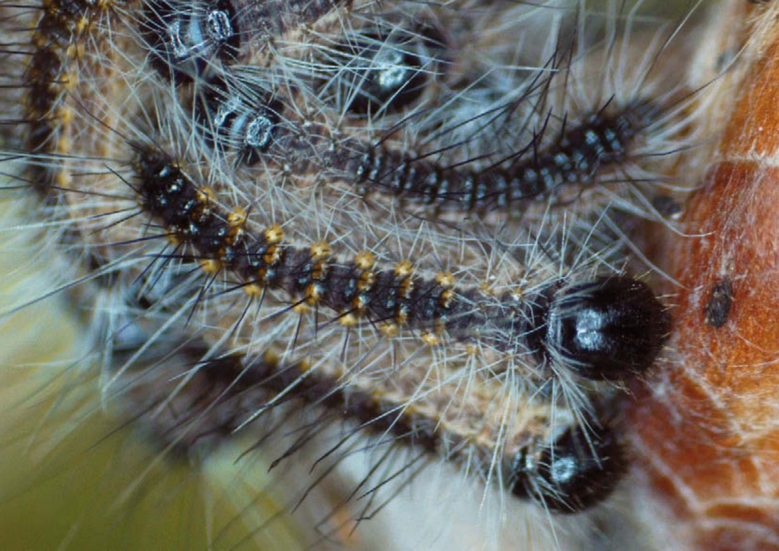
Jonge eikenprocessierupsen