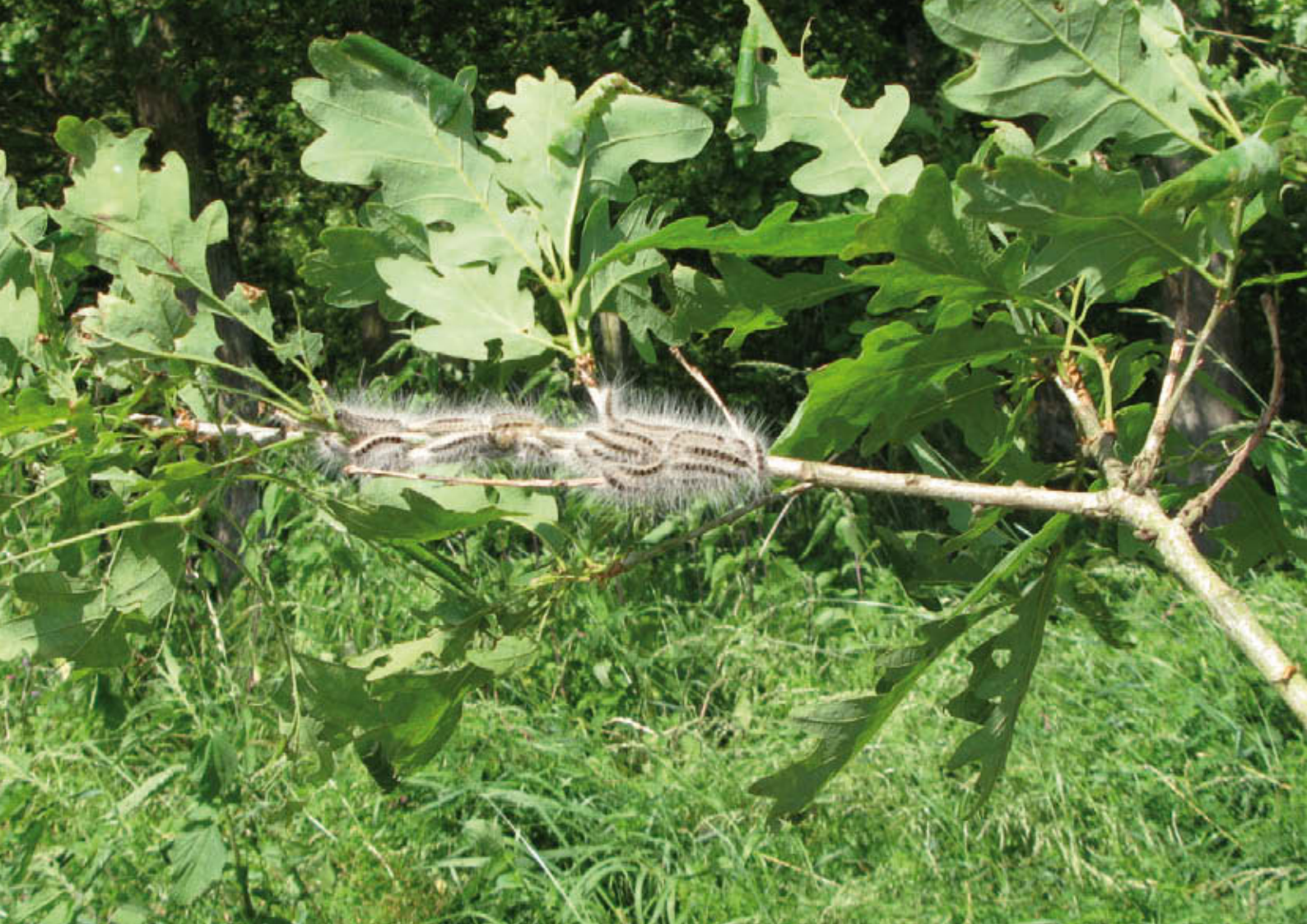
Eikenprocessierups in het vijfde stadium