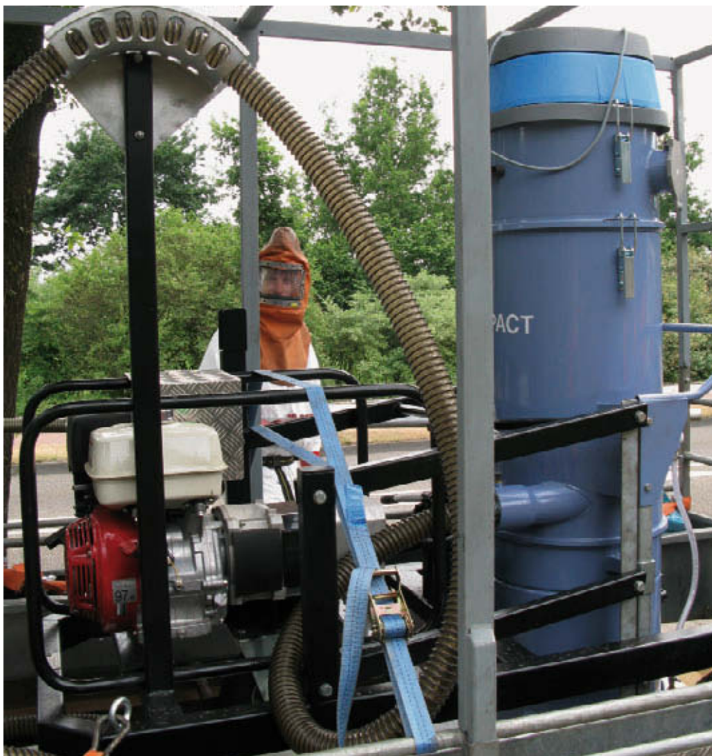
Uitvoerende medewerkers moeten voldoende bescherming dragen bij werkzaamheden

Zie voor informatie over gezond en veilig werken in de agrarische en groene sectoren http://www.stigas.nl