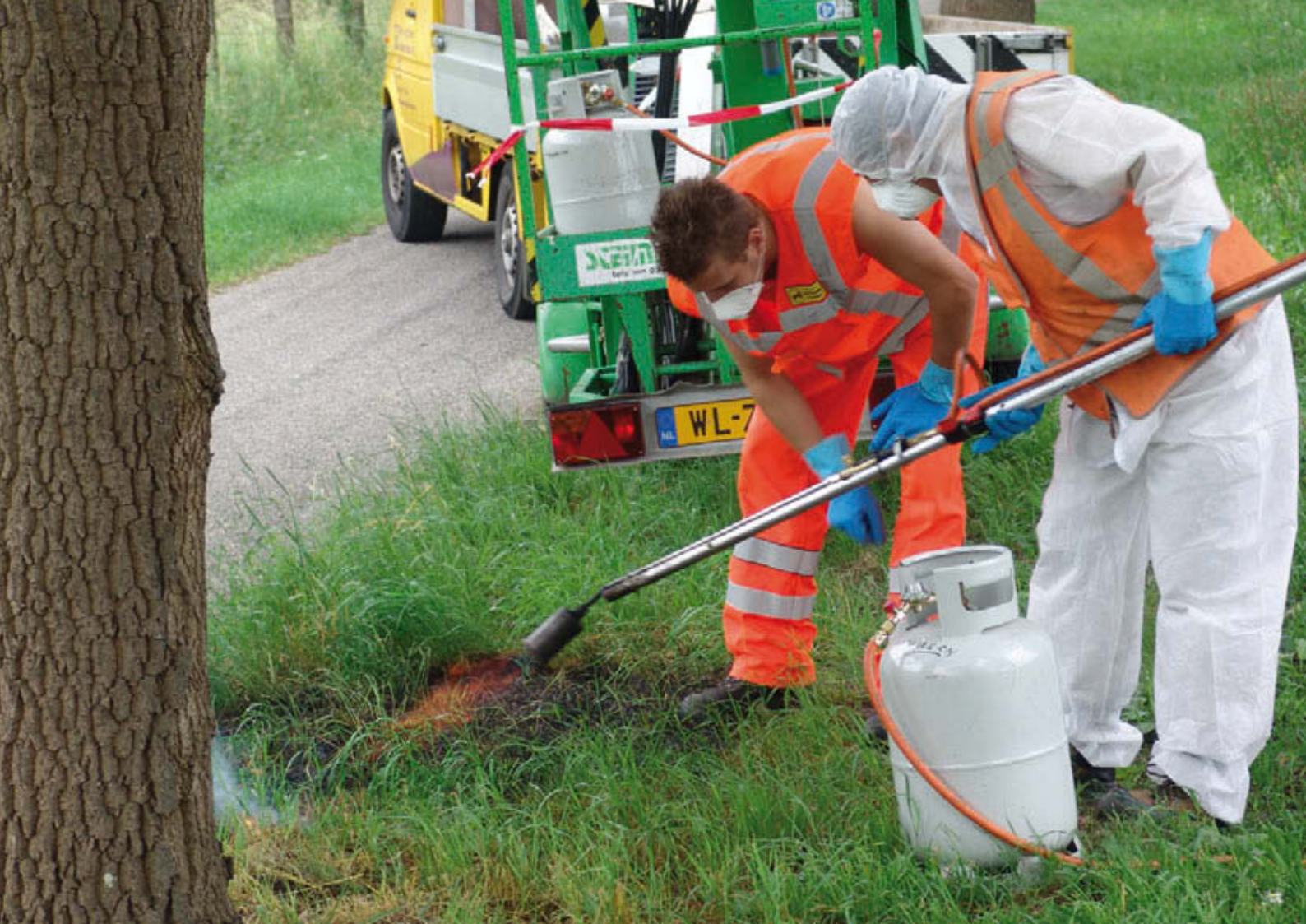
Van juiste bescherming tijdens branden is hier geen sprake!