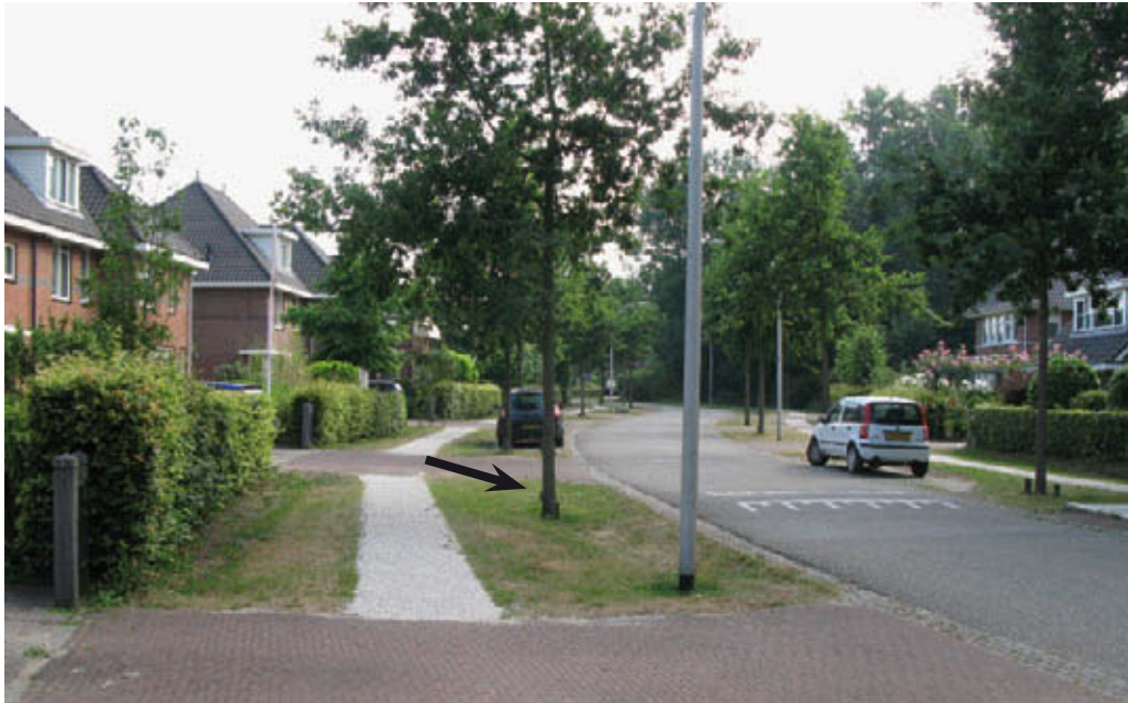
Burgers informeren over de situatie is belangrijk