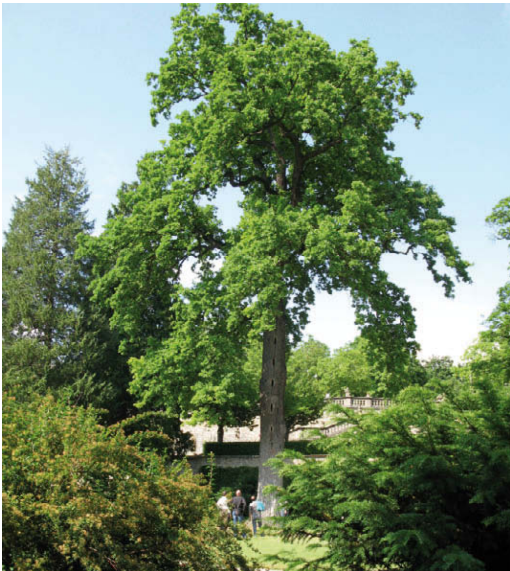
Ook in monumentale eiken kunnen nesten van eikenprocessierups worden aangetroffen

Eikenprocessierups houdt er van om in het vijfde en zesde stadium zich te verzamelen op de stam van de boom. Hieruit zou men de conclusie kunnen trekken, dat eiken in een zuilvorm (oa 'Fastigiata') met takken tot vlak boven de grond, minder aantrekkelijk zijn. Echter, ook in deze zuileiken wordt eikenprocessierups aangetroffen.