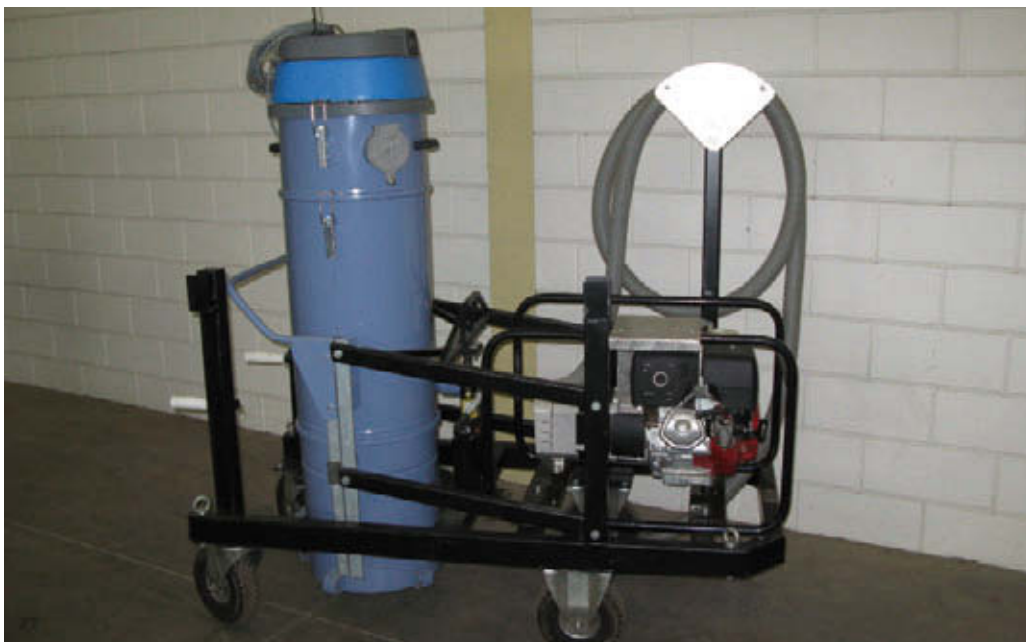
Handzame kleine zuigunit voor moeilijk terrein of op een hoogwerker

Eén voorbeeld is een hoogwerker met een overdruk cabine boven aan de hefarm. Zulke machines bieden perspectief vanwege de snelle verplaatsbaarheid, het goed op hoogte kunnen werken en de verbeterde arbeidsomstandigheden.