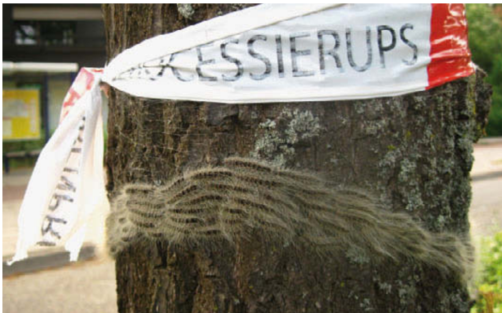
Waarschuwen van publiek en markering voor vervolgactie

Indien er een lage plaagdruk is in gebieden met weinig mensen, kan men volstaan met algemene informatie op permanente borden zoals bij ingangen van veel bos- en natuurgebieden aanwezig zijn. Hou wel rekening met recreatie- en kampeerterreinen, fiets- en wandelroutes en evenementen die periodiek of eenmalig in een gebied worden georganiseerd. Mogelijk is een beheersstrategie hier wel aan de orde.