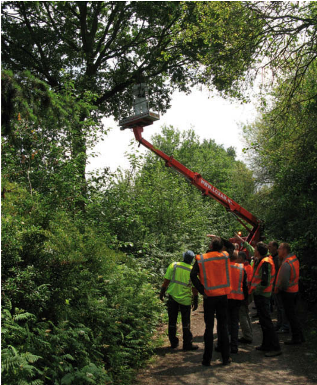
Kennisuitwisseling: medewerkers van provincie en gemeenten uit Drenthe op werkbezoek bij provincie Noord-Brabant en gemeente Helmond.

Bij de evaluatie kunnen verschillende partijen betrokken zijn. Het is niet alleen een aandachtspunt voor de openbaar groen afdeling, maar ook voor de afdeling publieke gezondheid, en voor de afdeling gerelateerd aan natuur en landschap. Zoek contact met andere terreinbeheerders in de regio, die tevens te maken hebben met deze problematiek, betrek de regionale GGD erbij en wissel ervaring uit. De aanpak van het volgende jaar wordt ook bepaald door de situatie in de regio.