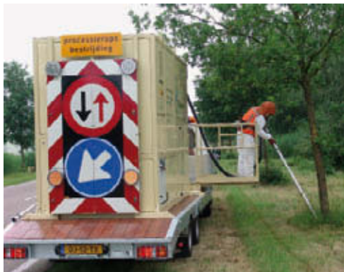
Zuigen en verassen: het "rupsencrematorium"

Aan de hand van de beslisfactoren in tabel 5 kan de beheerder met behulp van de risico-inventarisatie én de resultaten van de monitoring een keuze maken uit de maatregel(en) waarmee de eikenprocessierups wordt bestreden. In 3.4 wordt een schema getoond voor de verschillende situaties en bijbehorende maatregelen.