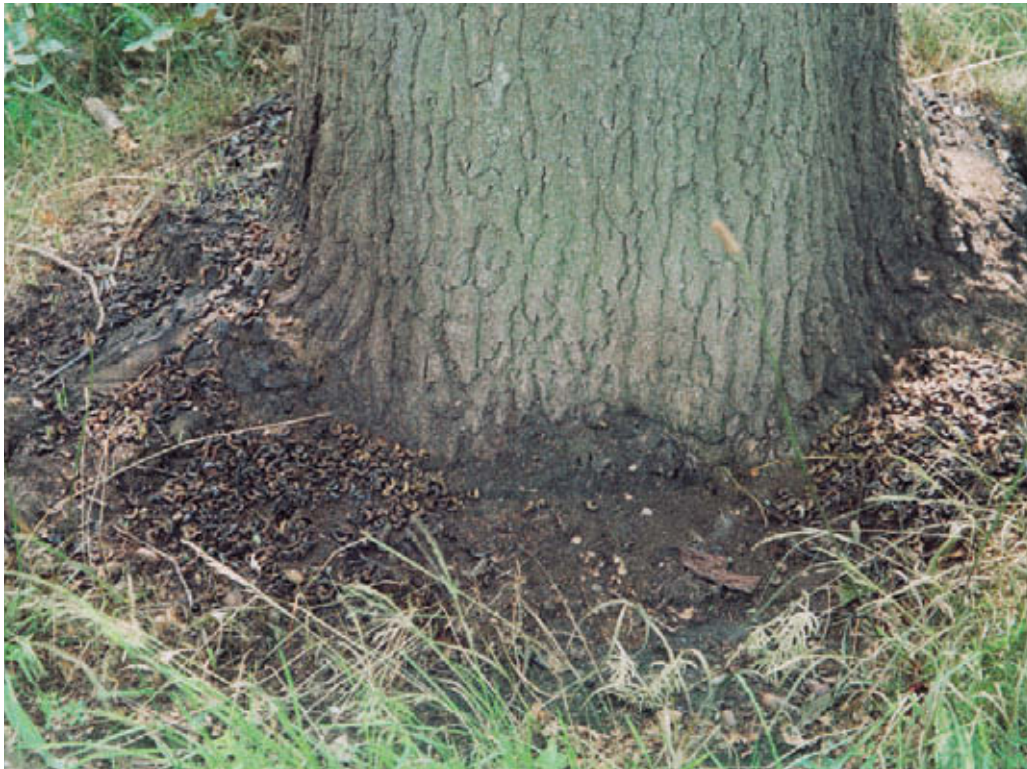
Afgebrande rupsrestanten in de berm

De restanten zullen langzaam via natuurlijke weg afbreken en in de grond spoelen, maar brandharen kunnen in de grond nog lange tijd intact blijven. Verstoring van de grond kan dan contact met brandharen tot gevolg hebben.