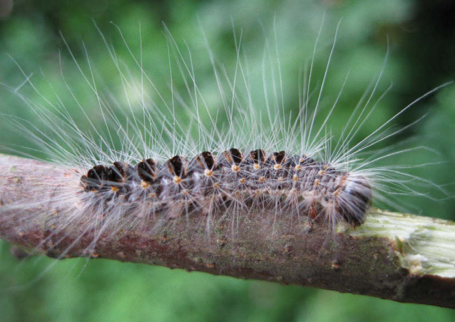
Eichenprocessierups zesde stadium met donkergekleurde borstels brandharen en lange niet-irriterende witte haren