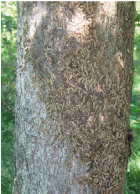
Hoge dichtheid aan vervellingshuidjes van eikenprocessierups

Inzet van feromoonvallen als bestrijding is niet toegestaan. Bij bestrijding van eikenprocessierups door feromoonvallen moeten we denken aan het ophangen van zeer veel feromoonvallen. Hierdoor zouden veel mannetjes voordat paring kan plaatsvinden, worden weggevangen. Dan kunnen minder vrouwtjes bevrucht worden en er dus minder eipakketten worden afgezet. Voor deze toepassing is een toelating van het College Toelating Gewasbeschermingsmiddelen en Biociden noodzakelijk. Deze toelating is momenteel niet voorhanden. Gebruik van feromoonvallen moet dan ook gezien worden als een hulpmiddel om informatie te verkrijgen over de omvang van een (toekomstige) populatie en over de effectiviteit van een –op de rupsen- uitgevoerde bestrijding.