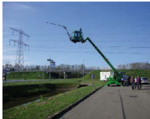
De "bugbuster" een nieuwe ontwikkeling: een zuigunit op hoogwerker met cabine