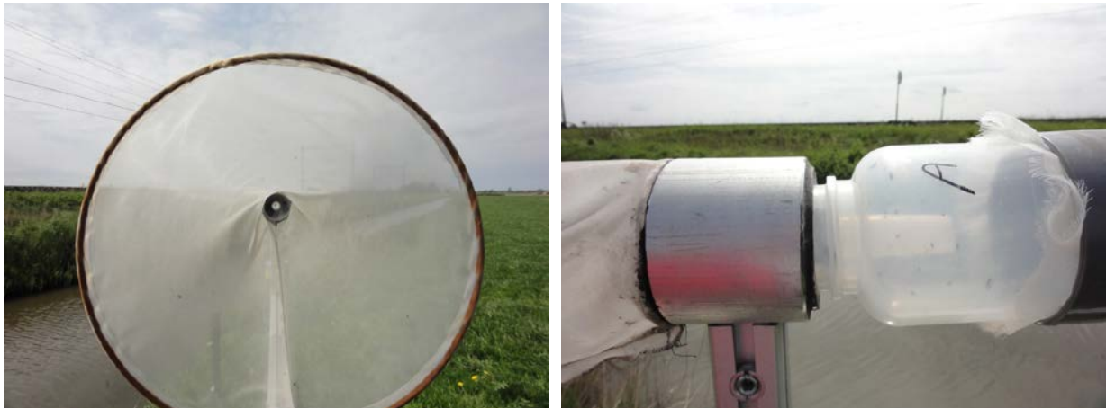
Figuur 2. Bladluizenfuiken geplaatst bij de spoordijk langs de N241 bij Dirkshorn/Blokhuizen (linksboven), en in een perceel aan de Koningskade nabij Hoogwout (rechtsboven). De bladluizenfuike bestaat uit een trechter van gaasdoek (rechtsonder) die overgaat in een luchtdoorlatende opvangbus. Het geheel is op een met de wind mee draaiende windvaan geplaatst.